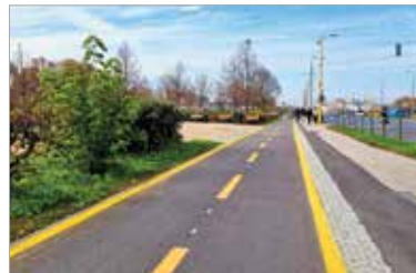
A Piac téren már elkészült a bicikliút a Selyem utcától a Hosszú sétatéri kerékpársávig

Az érintett szakasz a Selyem utcától a Hosszú sétatéri kerékpársávig tart, ezzel a Piac tértől a Sóstó Ipari Parkig biztonságosan lehet már közlekedni kerékpárral. A Palotai úti bicikliút tervei is elkészültek. Itt hosszadalmasabb az előkészítés, mert nem minden terület az önkormányzaté. Jó hír azonban, hogy küszöbön van az utolsó megállapodás is, és a jogi folyamat után kezdődhet a közös járda és