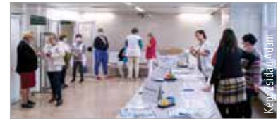
Volt diákok, akinek felkeltette érdeklődését az egészségügy

A nap folyamán a gyerekek a kórház több részlegén jártak: megismerkedhettek a radiológiai, a hemodinamikai és a patológiai