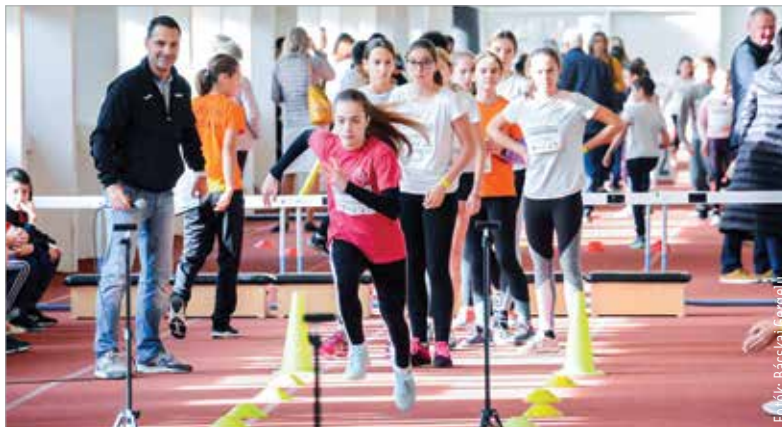
Futók futószalagon: egymást követték a gyerekek a Breggyóban

belül felmérjék Székesfehérvár 8 és 12 év közötti tanulóit. Mintegy 3000 diák 12 690 mérését követően két versenyszámban is kialakultak az évfolyamok városi toplistái. E ranglista legjobb tizenkét eredményét elért fiataljai a Regionális Atlétikai Központ fedett pályáján, egy gála keretében döntötték el, ki a leggyorsabb és ki a legruganyosabb Székesfehérváron. Az esemény sztárvendégei voltak Zsivoczky Attila világ- és Európa-bajnoki érmes, országos csúcstartó tízpróbázó, a Kölyökből Atléta Prog-