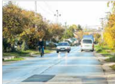
A Zámoly utcában mindenhol új, burkolt árok lesz

A beruházás keretében a Kiskút útja mellett a hiányzó járda is megépül. Kerékpársávok lesznek az út mindkét oldalán, ami az út szélesítésével, közműkiváltásokkal, valamint új árkok és csapadécsatorna építésével is jár. A Fecskeparti útnál, valamint a Vajda sor és a Kertalja utca végénél is zebrákat alakítanak ki az új járdához. Várhatóan tavasszal az utca alatti ivóvízvezeték is kicserélik, még a burkolatépítés előtt. A munkával jövő nyáron végez majd a kivitelező. A Zámoly utcában mindenhol új, burkolt árok lesz, a Zámoly köztől a város felé pedig csapadécsatorna épül.