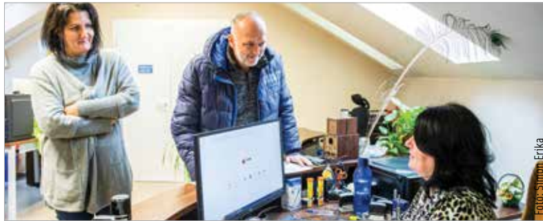
Nagy segítség az új gépek beszerzése

A Kríziskezelő Központ a Sörház tér 3. szám alatti központban folyamatosan várja az adományokat: a karácsonyi csomagostáshoz lenne szükség étel-ekre, valamint meleg, téli ruhanemű-re, elsősorban férfiak számára.