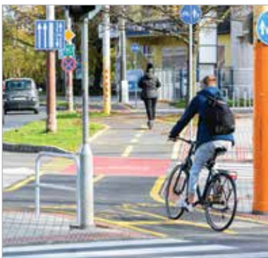
A Berényi út és a Kadocsa utca kereszteződésében már biztonságosak a biciklis átkelőhelyek

A Pozsonyi úti kerékpársáv be-kötése a Berényi úti kerékpárútra már elkészült, biztonságos biciklis átkelőhelyek épültek. Ezzel együtt a kereszteződés burkolatát is sikerült felújítani. A fejlesztés révén a Fiskális úttól be lehet kerékeznii egészen a belvárosig. Hiányzik ugyan a Szekfű Gyula utcai kerékpárútszakasz, de a Széna téren és a most épülő Rákóczi úti kerékpárúton a Vár körúti kerékpársávokon lehet biciklizni.