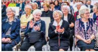
Arany-, gyémánt- és vasokleveleket adtak át szerdán a Hiemer-házban

A Pedagógusok Szakszervezete és Székesfehérvár önkormányzata évek óta megemlékezik a város pedagógusairól: minden év novemberében vehetik át az óvodapedagógusok, tanítók és tanárok, akik ötven, hatvan, hatvanöt, hetven vagy hetvenöt éve fejezték be tanulmányaikat és kezdték el pályájukat. A járvány miatt az elmúlt két évben nem volt lehetőség a személyes találkozóra, így a múlt héten a 2020-ban, e héten szerdán pedig a 2021-ben évfordulós emlékdiplomásokat köszöntötték a Hiemer-ház Báltermében. „A pedagógusok munkájának legnagyobb eredménye, ha diákjaik boldog, sikeres felnőttként helytállnak az életben” – hangsúlyozta az ünnepségen Jámbor Ferencné, a Pedagógusok