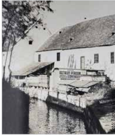
Egy „pillanatkép” a kiállítás anyagából