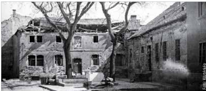
A talapzat előtt, a földön feküdt a ledöntött szobor