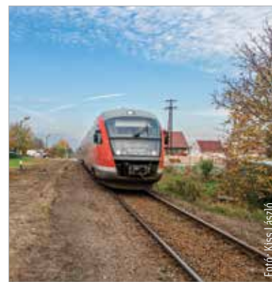
A szárazréti megállóhelyet még rendbe teszi a város

Kiemelte: a városnak is van teendője, hiszen a szárazréti megállóhelyet rendbe kell tenni. A busz-megálló mintájára egy kisebb váró épül majd városi forrásból. Következő lépésként azt szeretnék elérni, hogy a fehérvári helyi buszbéreltel is lehessen használni a vonatot ezen a szakaszon, integrálva azt a helyi tömegközlekedésbe. Erről még lesznek tárgyalások az illetékes szakminisztériummal. „A Fehérvár és Komárom közötti vasútvonal ütemes menetrendjének bevezetése nagy siker volt eddig, olyan gyorsan, hogy decembertől bővülni fog a szolgáltatás egy esti, nyolcadik