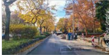
Elkezdődött a Rákóczi utca felújítása, új kerékpársáv is lesz

Épül a Rákóczi utcai új kerékpársáv is, ezzel együtt az útburkolat is megújul az Aron Nagy Lajos tér és a Gáz utca közötti szakaszon. A déli útpályán – ahol szélesebb az aszfalt – külön kerékpársáv épül a megmaradó párhuzamos parkolók mellett. A felfestés úgy készül majd, hogy biztonságos távolság maradjon a 1,25 méter széles kerékpársáv és a parkoló autók között is. A belváros felé vezető északi oldalon csak minimálisan lehet szélesíteni az utat, itt kerékpáros nyomok lesznek kijelölve. A szegélyeket is javítják, illetve ezen az oldalon is felújítják az útburkolatot. A Széna téri körforgalom átépítésének a tervei is készen vannak, de a teljes felújítás most nem fért bele a keretbe.