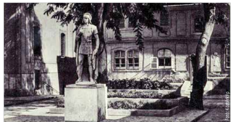
A szobor a régi helyén, egy korabeli képeslapon