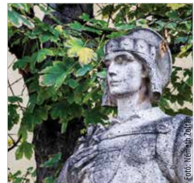
Ma is látszik, hol törött le a szobor feje

váltást követő első polgármestere közreműködésével. A szobor teste azonban még a világháború végének zürzavarában eltűnt. Mendemondák, városi szóbeszédék szóltak arról, hogy a szobor testét elásták, ezzel akadályozva meg teljes elpusztítását, ám hosszú évtizedekig semmi konkrétum nem derült ki a szobor sorsáról. Aztán a rendszerváltás meghozta a nem várt áttörést, és valóban a föld alól előkerült Szent Imre szobrának teste! Már 1988-ban erőteljesen foglalkoztatta a szobor sorsa a város két világháború között készült köztéri alkotásait kutató Igari Antalt, aki a szakdolgozatát is e témának szentelte. Ugyanebben az évben