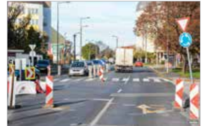
A Móri úton is kerékpársávok lesznek az út mindkét oldalán