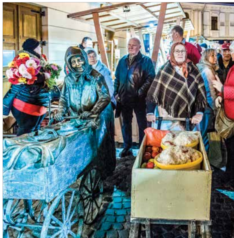
Kocsis Balázs alkotása városunk egyik legnépszerűbb köztéri szobra