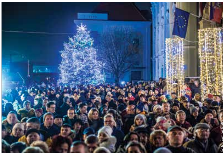
Az ünnepet köszöntő sokaság a város karácsonyfája körül gyülekezve várta a színpadi műsort és a fények felgyűlésát