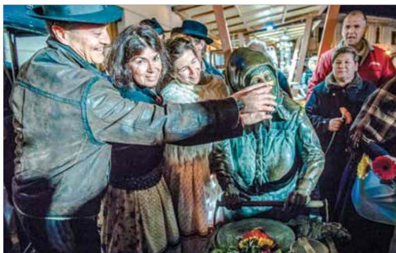
„Deb gabog lebegőt!”