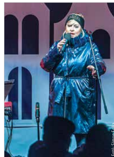
A színpadon Szulák Andrea karácsonyi műsora szórakoztatta a közönséget. A következő hetekben is lesznek koncertek vasárnaponként.