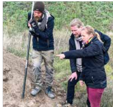
Három szondát nyitottak meg a Szabadbattyánban zajló hitelesítőfeltáráson

„A harmadik szonda feltárásával még nem végeztünk. Mivel az idő most már rosszabbra fordul, ezt a felületet nem tudjuk teljes egészében megvizsgálni, mert nem szeretnénk, ha sérülnének a föld alatt rejlő római emlékek. Jövőre szeretnénk itt egy kiterjedtebb kutatást végezni. A harmadik helyiségre mindenképpen egy nagyobb szondát kellene nyitni, hogy felszínben is jobban lássuk az összefüggéseket. Feltehetően itt található az a fűtőcsatorna, amiről Pereczes