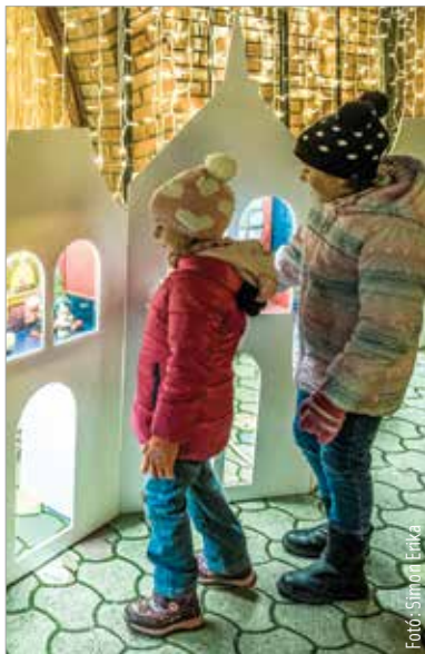
Az idei ünnep újdonságaként nagy sikert arattak Manóváros Vasvári Pál utcába beköltöző lakói