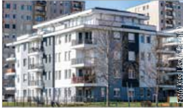
A magas négyzetméterárak továbbra is jellemzők Székesfehérváron

Számottevő változások történtek az évben az országban belül a lakás piac motorját jelentő költözéseket tekintve az ingatlan.com legújabb, hivatalos adatokon alapuló elemzése szerint, mely ismerteti az úgynevezett vándorlási adatokat is. Többek között azt, hogy hányan költöztek be a megyébe és hányan távoztak onnan a tavalyi évben.