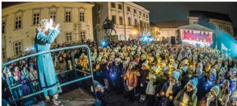
A gyertyagyújtást megelőzően a Kisangyalok kara, tizenhárom iskola több mint hatszáz diákja varázsolt karácsonyi hangulatot a Városház téren

Több mint hatszáz gyermek hangján szállt a karácsonyi ének advent első vasárnapján a Városház téren, ahol több ezer fehérvári gyűlt össze, hogy a Kisangyalok kara teremtette ünnepváró hangulatban lobbanjon fel az adventi koszorú első gyertyájának lángja. Több helyszínen is tartottak ünnepi programokat, és ez így lesz a karácsonyig hátralévő hétvégéken is.