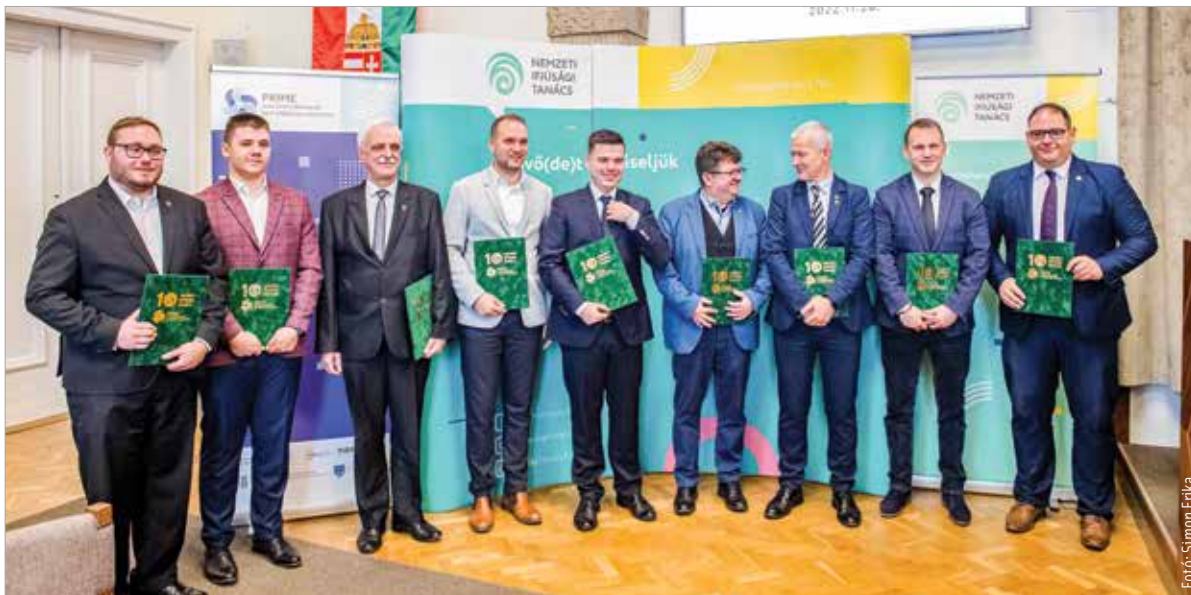
A projekt a jövő év első felében felkészítéssel indul, a megvalósítás két éven belül várható. A Nemzeti Ifjúsági Tanács partnerei között ott van többek között a Pécsi Tudományegyetem, a Sapientia Erdélyi Magyar Tudományegyetem és a felvidéki Selye János Egyetem.

A projekt célja, hogy a diákönkormányzati rendszer megújuljon nemcsak Magyarországon, hanem az egész Kárpát-medencében. Komplex szolgáltatási és képzési rendszert szeretnének kidolgozni nemcsak a diákvezetők, hanem a diákönkormányzatokkal foglalkozó pedagógusok és az önkormányzati ifjúsági referensek számára is. Kovács Péter, a Nemzeti Ifjúsági Tanács elnöke elmondta: „A diákönkormányzatiság mint intézményrendszer a középiskolás korosztály számára egy nagyon jó demokráciagyakorlat. Megtanulnak a fiatalok demokratikus módon működni, önszerveződésben gondolkodni, illetve a saját érdekeiket képviselni. Ahhoz, hogy tudatos állampolgárrá váljanak a felnövő generációk, ez egy nagyon jó tanulási lehetőség!” A program jó lehetőséget teremt