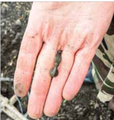
Fémdetektoros kutatást is végeztek a Seuso-kincsekkel összefüggésbe hozható területen

A feltárásról hamarosan videós összefoglalóval is jelentkezik a Szent István Király Múzeum.