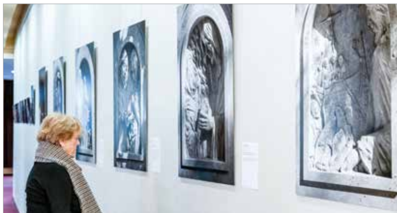
A fény útja megmutatja a feltámadás és a mennybemenetel közötti történéseket

„A via lucis egy út, mint ahogyan úton vagyunk mindannyian, és utunk során Jézus Krisztusra támaszkodunk. Az ő útmutatása és élete alapján vezetjük az életünket, ő mutat utat nekünk ezen gondolat megerősítésé-