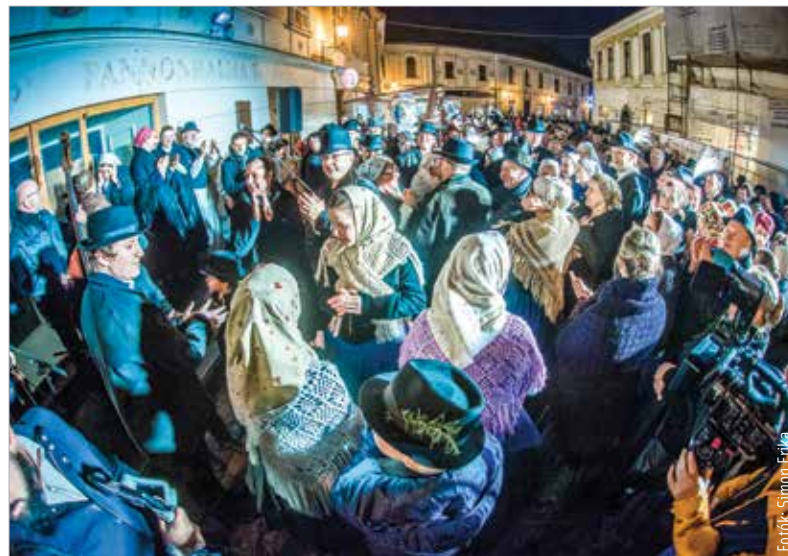
Idén is megtelt a Liszt Ferenc utca ünneplőkkel