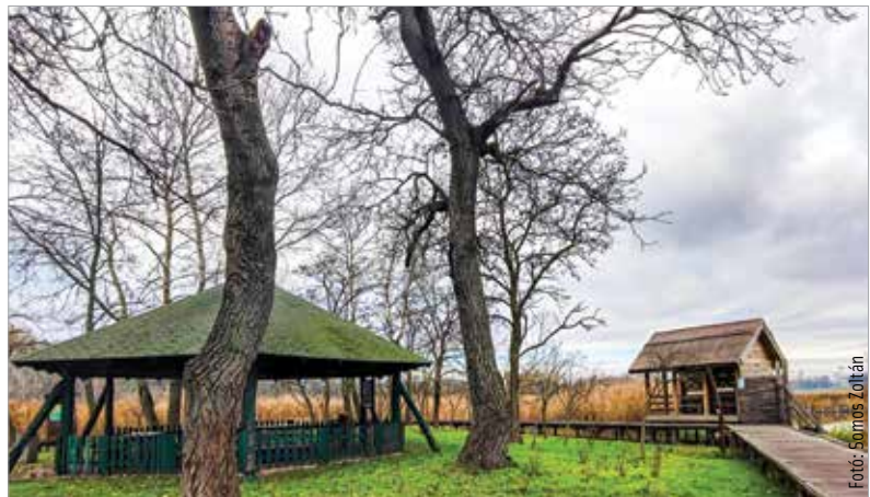
Sötétedésig élvezhetjük a Sóstó téli látványát

A Sóstó Vadvédelmi Központ változatlanul üzemel: állatfogadás minden nap 8-tól 18 óráig, a látogatókat pedig szerdától vasárnapig várják 10 és 17 óra között. Garantált program a Vadvasárnap minden vasárnap 10 és 12 óra között, melynek keretében izgalmas állatorvosi bemutató, gondozói állatetetés és szakmai előadás is van. Csoportokat csak szerdától szombatig, előzetes bejelentkezés alapján fogadnak.