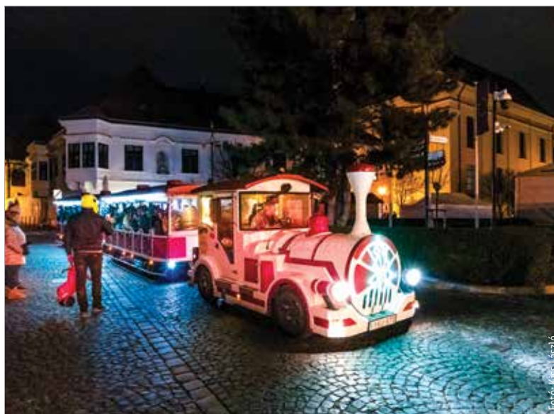
Az adventkor induló fényvonat minden generáció számára vonzó látványosság a fehérvári belvárosban