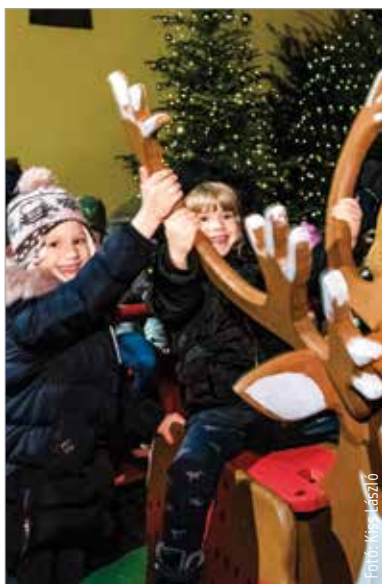
Az adventi udvar gyerekzsivaja is a karácsony előtti időszak elmaradhatatlan háttéré