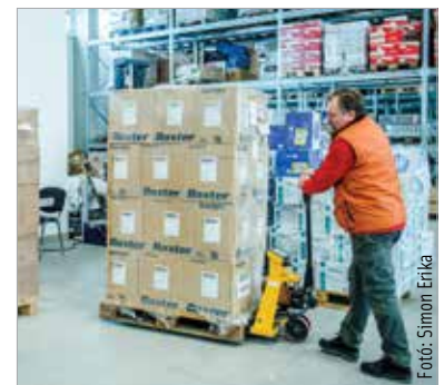
Az adventi adománygyűjtést a Civilközpont Országos Hálózata és a Miniszterelnökség szervezte. Fehérváron a megyei Civil Közösségi Szolgáltatóközpont koordinálta a gyűjtést, a Katolikus Karitászi pedig a csomagok szállítását.

Az adományok szállítását a katolikus szeretetszolgálat koordinálja a következő hetekben. Két településre azonban már a második