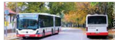
Egyelőre nem változik a járatsűrűség