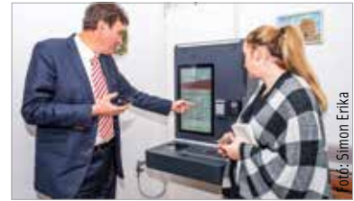
A mesterséges intelligencián alapuló berendezés bárki számára szabadon hozzáférhető és használható

A mesterséges intelligencia térhódításának folyamata tehát ezentúl