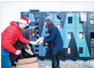
Az első csomagok az Alba Bástya Család- és Gyermekjóléti Központ udvarán található automatában landoltak szerda délelőtt

„Három automatát ajánlott fel az IVM Zrt. térítésmentesen, ebből egy az Irányi Dániel utcában található, kettő pedig a város jól megközelíthető helyein: az egyik az uszoda mellett, a másik az Ady Endre utcában. Amikor bekerülnek az adományok, mi értesítést kapunk róla, így amikor szükséges, a kollégáim kiürítik az automatákat, az adományokat elhozzák az Irányi Dániel utcába, csomagokba rendezik őket és eljuttatják azokat a rászorulóknak, akik vagy velünk vagy az