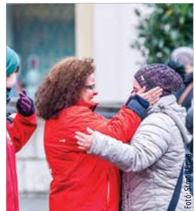
A szeretetet mindenki megérdemli!