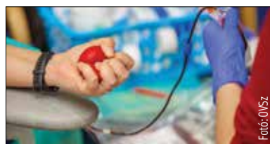
A területi vérellátó a Seregélyesi út 3. szám alatt található

Ismét várják a segíteni szándékozókat Székesfehérváron: az ünnepek előtt is nagy szükség van vérre, ezért a területi vérellátóban december 20-ig 9 és 15 óra között adhatunk vért. A véradáson 18 és 65 év közötti egészséges emberek vehetnek részt. Fontos, hogy személyi igazolványt, laccím- és tajkártyát mindenki vigyen magával! Közben zajlik az Országos Vérellátó Szolgálat 1-3-9 #véradochallenge nevű kampánya, melynek célja új véradok toborzása. Egy vérado megmenthet három életet, majd kihívja két barátját, így együtt már kilenc ember életét menthetik meg.