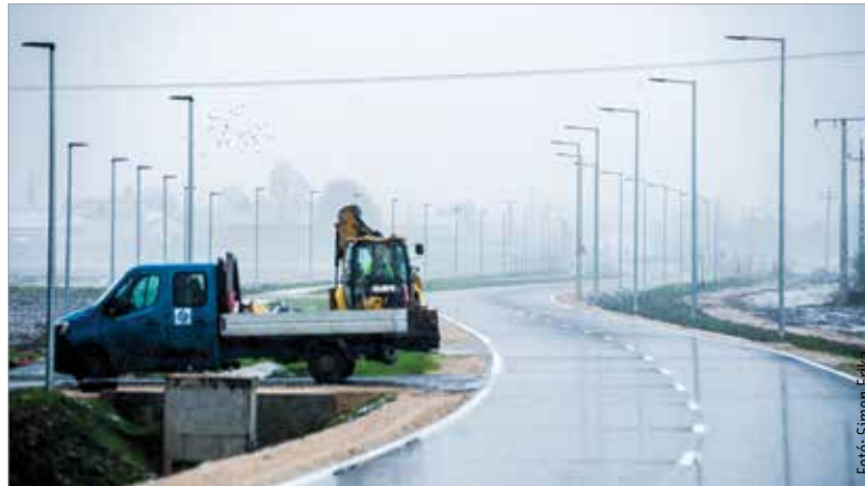
Az úton továbbra is dolgozik a kivitelező, a forgalom számára tilos az áthaladás!

Végehez közeledik a Seregélyesi és a Sárkeresztúri utat összekötő út kivitelezése. A tervek szerint a műszaki átadás után, kora tavasszal vehetjük használatba a modern közvilágítással és kerékpárúttal szegélyezett, közel öt kilométeres szakaszt. Cser-Palkovics András polgármester Mészáros Attila alpolgármesterrel és a kivitelezésben résztvevőkkel együtt járta be a hamarosan elkészülő útszakaszt. „Nagyon jól áll a kivitelezés, remélhetőleg kora tavasszal át tudjuk adni az utat a forgalomnak! Évtizedek óta nem történt ilyen útépités a városban. Bízom benne, hogy a belváros körüli utak forgalmára is jótékony hatással lesz!” – nyilatkozta a polgármester.