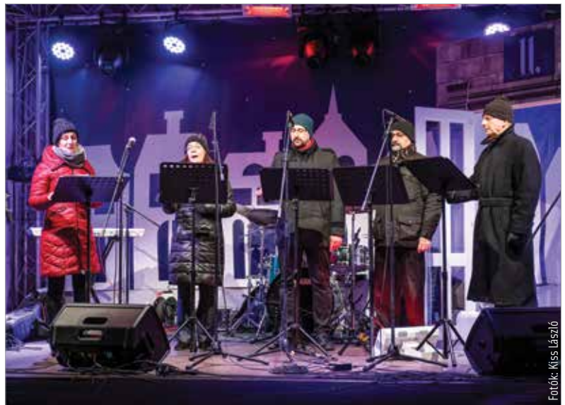
A MusiColore énekegyüttes egyházi és karácsonyi énekeket adott elő