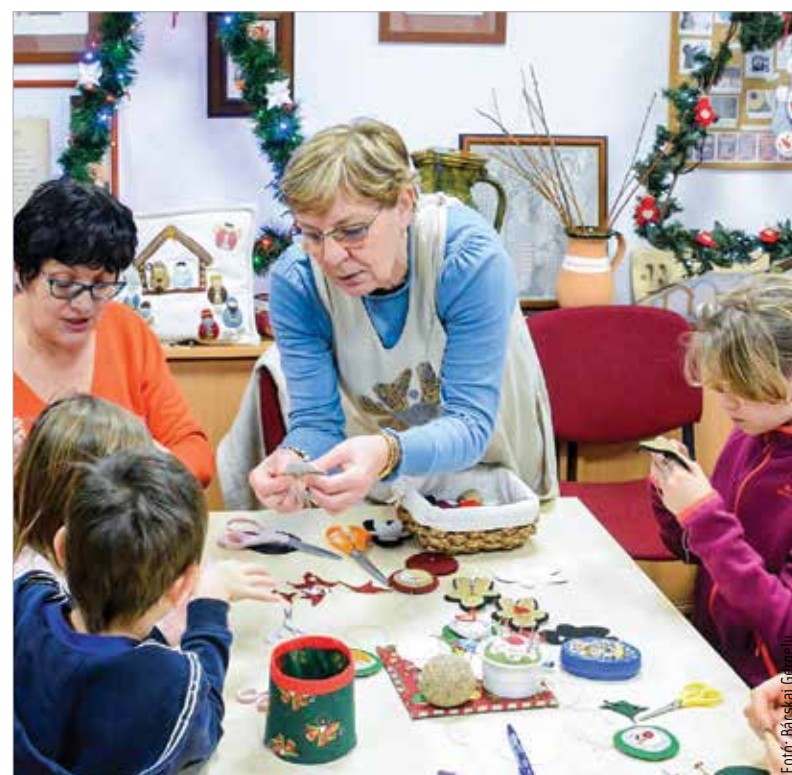
A gyerekek is elmerülhettek a kézműveskedésben