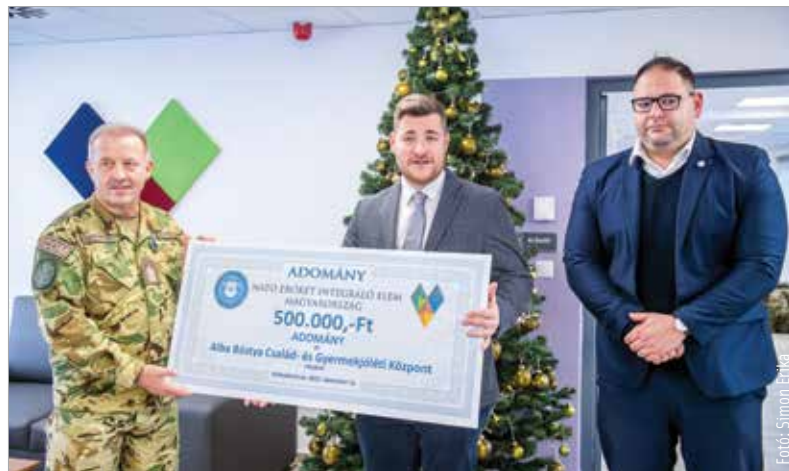
A támogatásnak köszönhetően ötven – kettő és tíz év közötti – gyermek juthat színházi élményhez