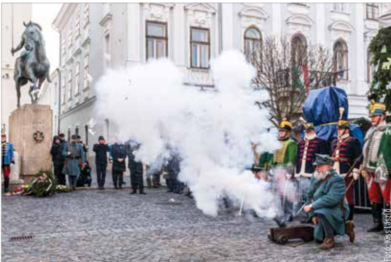
Száznyolcadik évfordulója alkalmából emlékezett meg a Fehérvári Huszárok Egyesülete a limanovai csatáról. Idén is a 10-es huszárok Városház téri emlékművénél gyűltek össze az emlékezők. P. B.