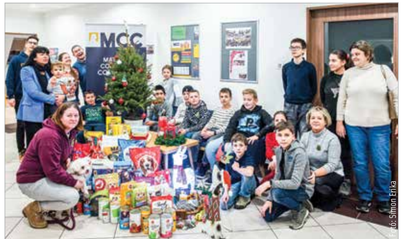
Nagy mennyiségű adományt gyűjtöttek a Mathias Corvinus Collegium Székesfehérvári Képzési Központjában az ASKA állatmenhelye számára. Az ajándékokat kedden adták át a központban, ahol az ASKA egyik munkatársa és védené közreműködésével a diákok megismerték a menhely működését, mindennapi munkáját.