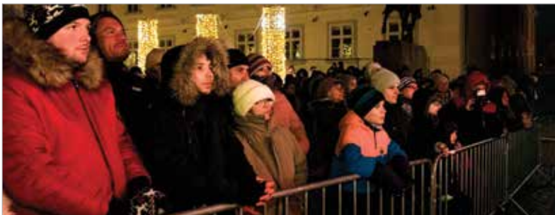
A csípős hideg ellenére sokan gyűltek össze