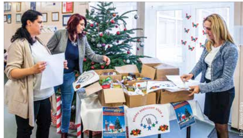
Ezerkét száz rászoruló családnak lesz szebb a karácsonya

kiemelte: komoly városi összefogást sikerült létrehozniuk. Az Alba Bástya Család- és Gyermejkölési Központ számára eddig érkezett felajánlásoknak köszönhetően ezerkét száz rászoruló családnak lesz szebb a karácsonya. Az alpolgármester hozzátette, hogy december tizenhatodikáig várják az adományokat az Alba Bástya Irányi Dániel utcai központjába, valamint az adománygyűjtő pontokon. Tartós élelmiszer, tisztálkodószer, édesség, gyümölcs, de akár játék is helyet kaphat a felajánlások között!