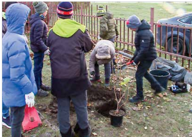
Három platánfa és hat bangita került az iskola kertjébe

Az országos programnak köszönhetően száz intézményt támogatott növényekkel a bank és a 10 Millió Fa Alapítvány. Az István Király Általános Iskola kertjében három platánfát és hat bangitát ültettek el.