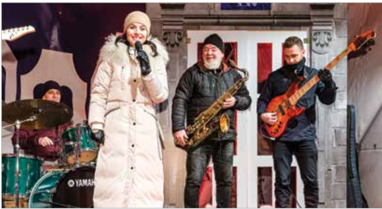
Zséda koncertje nagy sikert aratott