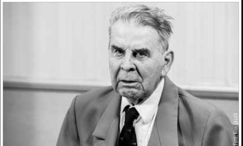
Hada Tibor (1929–2022)