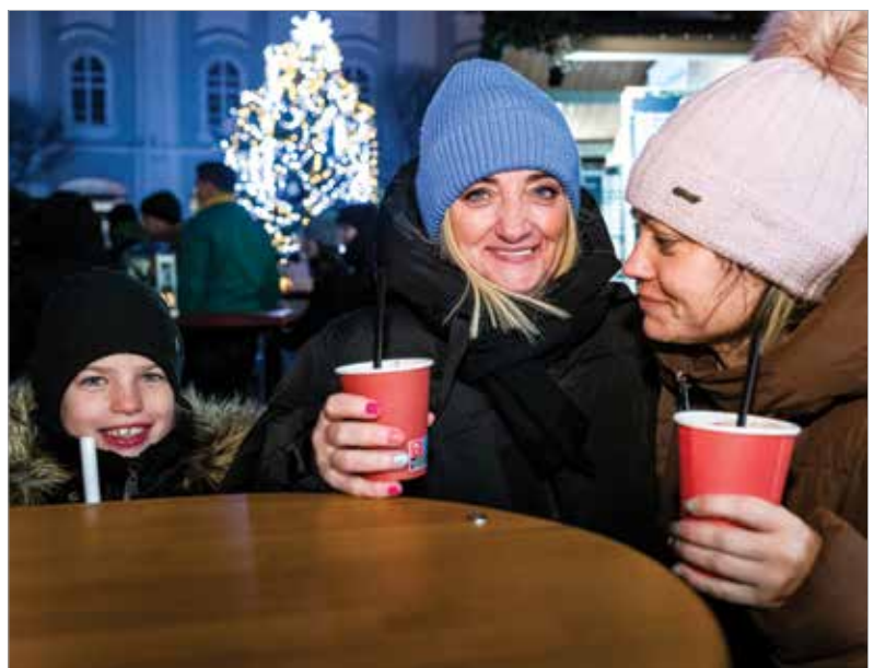
Fontos az emberi kapcsolatok öröme