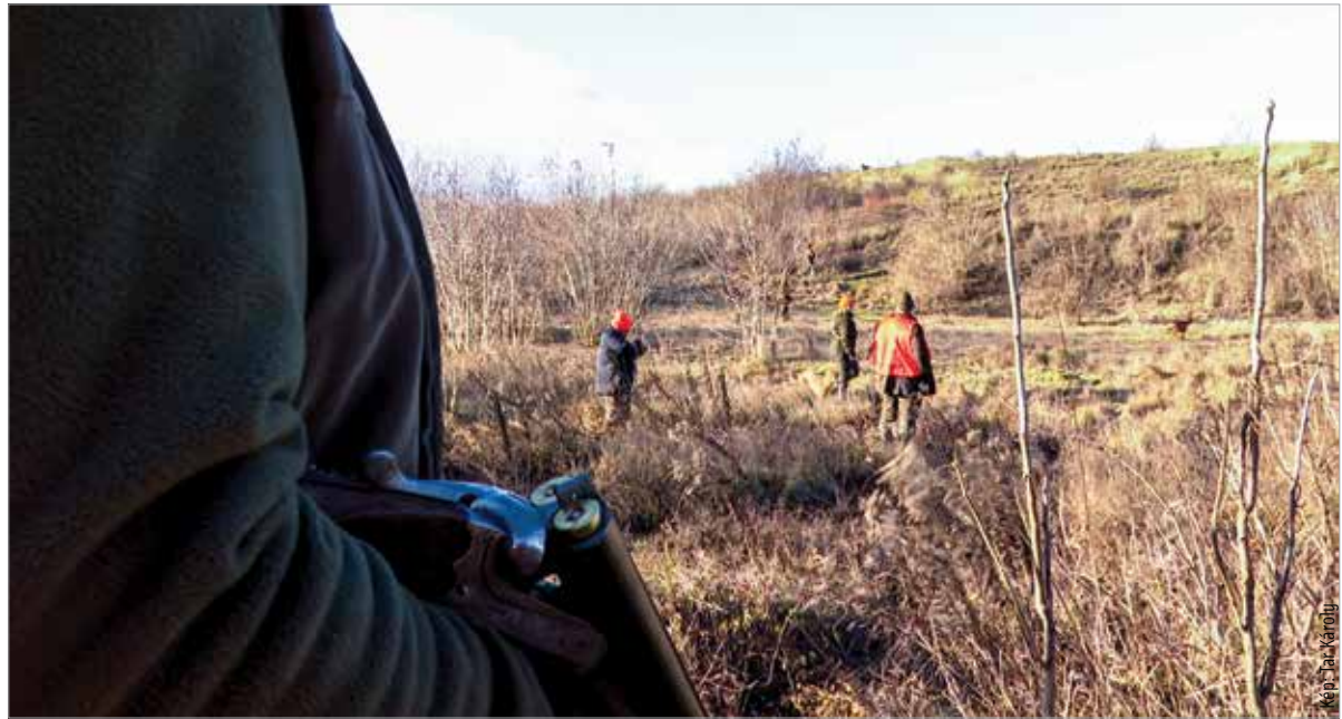
Idén már két intézmény részesül a támogatásból megyénkben: a Szent György Kórház mellett a Móri Városi Kórház is

Országsszerte harmincnegyzár helyszínen mintegy ezer vadász gyűlt össze, hogy fácánvadászattal támogassa a beteg gyermekeket. Fejér megyében két helyszínen, Kápolnásnyéken és Felsődoboson durrogtak a puskák. Fejes László, az esemény főszervezője lapunknak elmondta: Fejér megyéből indult a kezdeményezés, és hat évig megyei léptékű volt. 2019-ben alapították meg a Jótékonyági Vadászat Közhasznú Nonprofit Kft.-t, mely kifejezetten az országos terjeszkedésért felel. Ez a nonprofit szervezet építette fel a Jótékonyági vadászatot szerte az országban. Nobilis Márton, az agrárminisztérium államtitkára a rendezvényen úgy fogalmazott: „A kormánynak kiemelten fontos, hogy a magyar családok asztalára jó