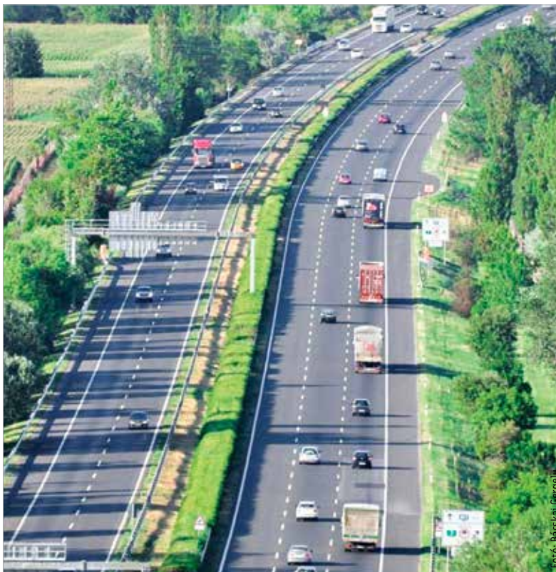
Az autópálya-közlekedés díjai közül legkevésbé az éves vármegyei matricák ára emelkedett

A kormány úgy döntött, hogy tovább bővíti a családi adórendszer, és mostantól nem kell személyi jövedelemadót fizetniük azoknak a harminc év alatti nőknek, akik gyermeket vállalnak. Az szja-mentesség nem új a családi adórendszerben: egy éve személyijövedelemadó-mentességet élveznek a huszonöt évnél fiatalabb dolgozó fiatalok, és három éve a négy vagy