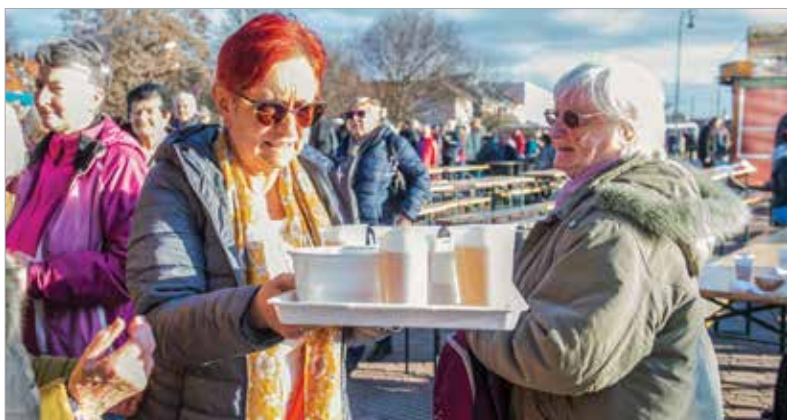
Az ezerötszáz adag főzeléket a honvédség gulyáságúiban és a Rostási Hagyományos Konyha fazekában készítették. Mellé idén is egy pohár meleg teát kínáltak a Palotai kapu téren.