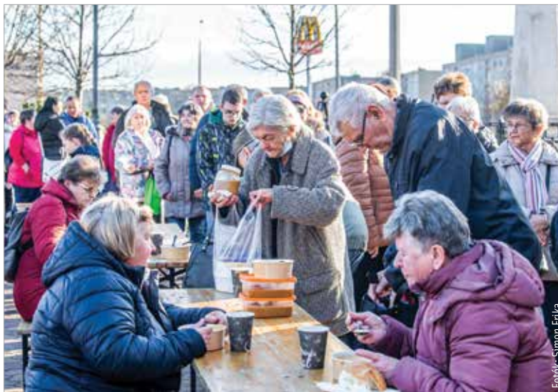
A néphagyományok szerint az, aki január elsején lencséből készült ételt fogyaszt, szerencsés, gazdag és boldog lesz az új esztendőben