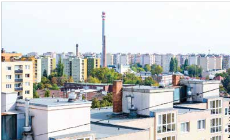
Körülbelül ötven százalékkal csökkent a távhő ára Székesfehérvár önkormányzata és a városi intézmények számára

A polgármester a részletekkel kapcsolatban kiemelte, hogy az új rendelet értelmében január elsejétől körülbelül ötven százalékkal, 25 586 Ft/GJ-ra csökkent a távhő ára az önkormányzat intézményei és épületei számára: „Ennek eredményeképpen a Vörösmarty Színházat a tervezettnél korábban, már március elsején újranyithatjuk! Persze ez még mindig jóval magasabb a korábbi, „békebeli” áraknál: annak idején 4400 Ft/GJ-ért tudtuk fűteni az önkormányzati épületeket. A 2022 végén tapasztalt 50 890 forintos ár tehát több mint tízszeres költségnövekedést jelentett. Ez