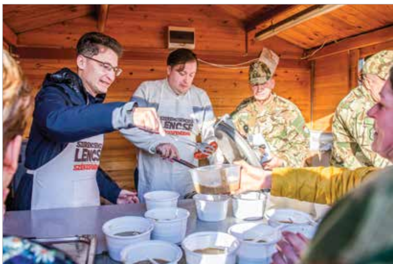
A rendezvényt az önkormányzat, a Honvédelmi Minisztérium és a Magyar Honvédség Parancsnoksága szervezi