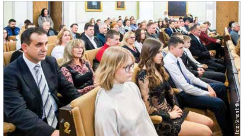
Diákok és felkészítő tanáraik is elismerésben részesültek az év végi díjátadón

ért kitüntetését kilenc tanár nyerte el. Mészáros Attila köszöntőjében úgy fogalmazott, hogy a díjazott fiatalok igazi példaképek kortársaiknak: „Sok lemondással jár az, hogy ma itt ülhetek ezen a gálán. A mai fiatalok sok mindenkben jók: van, aki jól sportol, jól tanul, jó a művészetekben és a kultúra területein. Ti azonban sok mindenkben vagytok egyszerre jók!” Székesfehérvár alpolgármestere köszönetet mondott a felkészítő tanároknak és edzőknek is, akik erőfeszítéseikkel segítik a diáksportolókat előrehaladását.