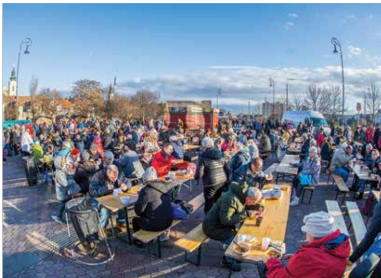
Szerencsehozó lencsével indíthatták az új esztendő a fehérváriak

Szerencsehozó lencsével indította az új évet Székesfehérvár. Január elsején sokan ültek le az Alba Plaza előtt felállított asztalokhoz: családok, baráti társaságok, a városban szilveszterező turisták közösen fogyasztották el azt az ezerötszáz adag lencsefőzeléket, mellyel Székesfehérvár önkormányzata, a Magyar Honvédség, a Honvédelmi Minisztérium, valamint az Alba Plaza vendégelte meg őket, szerencsés új évet kívánva mindenkinek.