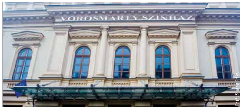
A teátrumba márciustól várják újra a közönséget, az elmaradt előadásokat pedig a melegebb hónapokban pótolják majd