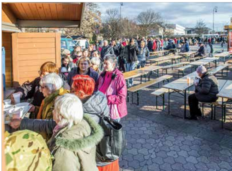
A város önkormányzata tizennyedik alkalommal szervezte meg az akciót: január első napján bőséget és egészséget hozó lencsefőzelékkel vendégelték meg mindenkit