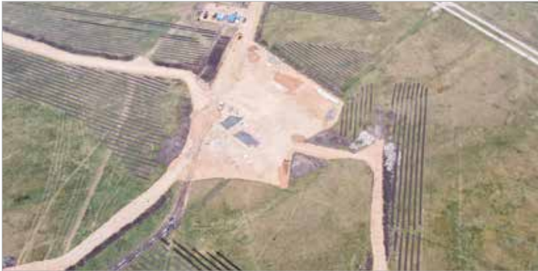
Az Alsóvárosi-rét látképe

parkosított területeken, igazi zöld oázist létrehozva az Alsóvárosi-réten, a Sóstó után újabb belterületi természeti csodával várva a fehérváriakat.