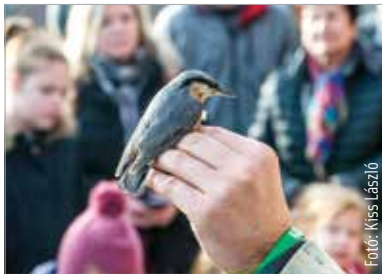
Több madarat is meggyűrűztek a gyerekekkel

Nemcsak madarakkal, rágcsálóval is találkozhattak az érdeklődők. A központban felnőtt nagy pele a látogatók kedvencévé vált, őt várhatóan tavasszal engedik majd vissza a természetbe. A foglalkozás nagyon népszerű a gyerekek és a felnőttek körében is, így lesz még Vadvasárnap: januárban 15-én, 22-én és 29-én is tartanak ismeretterjesztő foglalkozást a vadvédelmi központban.