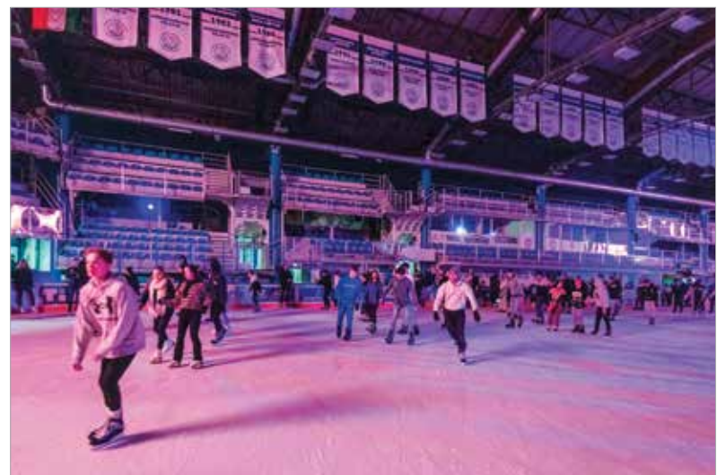
Jégdíszkó is volt