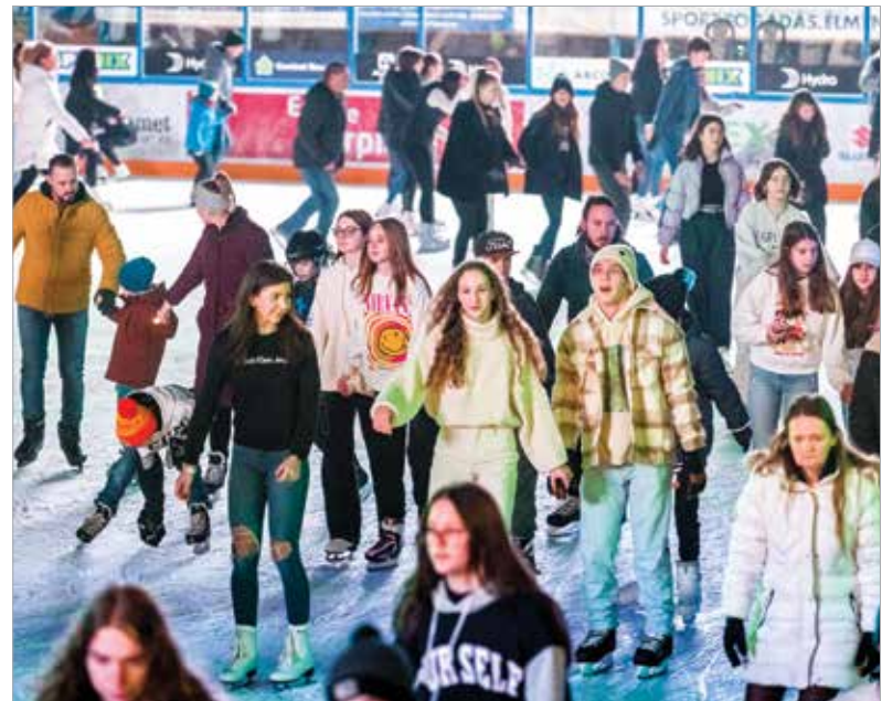
Minden korosztály élvezte a siklást