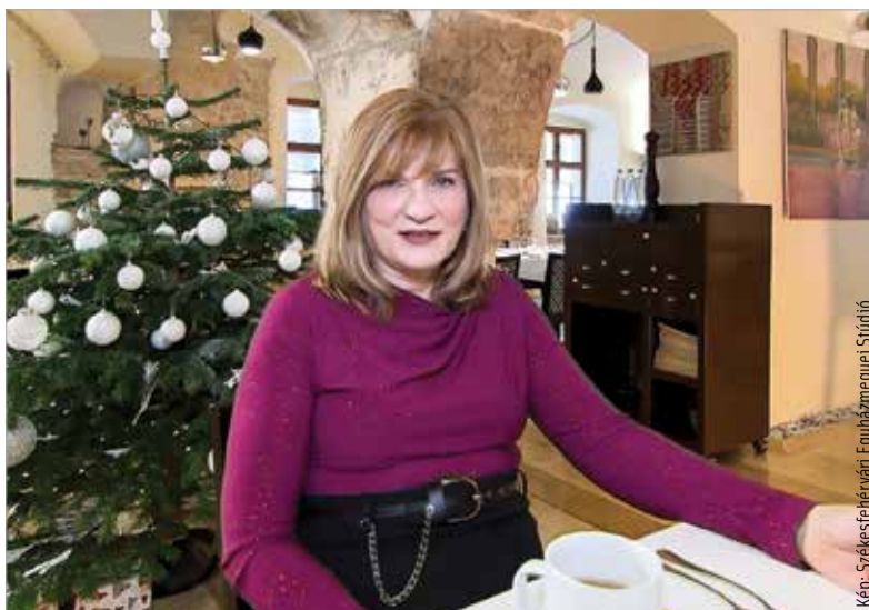
Képfelirat: Székesfehérvári Egyházmegyei Stúdió

Berta Kata felelevenítette Henri Boulad jezsuita szerzetes mondanását: „Ne gondolatok nagy dolgokra, magatokat viszitek át majd az örökkévalóságba, az, akik vagytok!” A műsorban azt szeretnék bemutatni, hogy ami jó, ami szép bennünk, az örökké velünk lesz: „Boulad atya tanított meg arra, hogy egy szeretettel elkészített vacsora, egy buszmegállóban való gondolkodás, várakozás a szereteteinkre, a családuinkra, a másokra, ezt mind-mind visszük majd magunkkal, és ez lesz az érték, ez lesz a fontos az életben. Szeretnénk elmenni az emberek közé, és szeretnénk megmutatni, mennyi minden örökkévaló dolog van bennünk, körülöttük!”