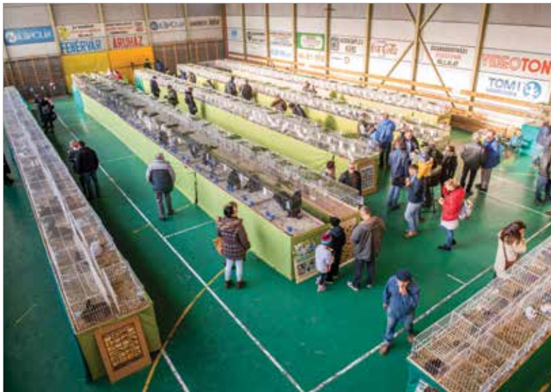
A Volán csarnoka ideális helyszín volt

keretében díszmadarakat, egzotikus madarakat, díszbaromfikat, különleges galambokat, illetve nyulakat tekinthettek meg a látogatók. A nagyszámú érdeklődő láthatta a székesfehérvári bukógalamb számos példányát is, de nagy sikert arattak a hagyományos és díszbaromfik, illetve az óriásnyulak is. Külön érdekesség, hogy a kiállításon az a magyar óriásnyúl