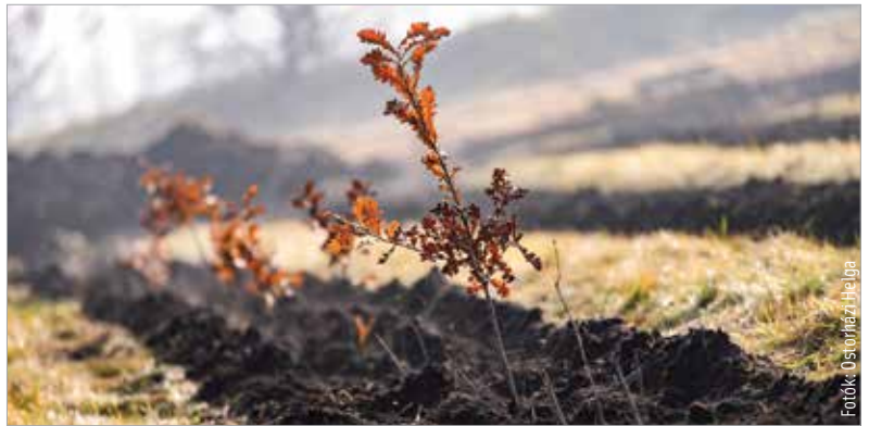
Tízezer facsemetét ültetnek el

Erdészeti szempontból egyébként a telepített fák már „rögtön” erdőt képeznek, a szakemberek így is kezelik a területet, de persze a laikus szemlélő még sokáig csak apró csemeték tömegét fogja látni. A gyorsan növekvő fajták körülbelül egy év alatt már derék- vagy embermagasságot érhetnek el, az évek során pedig fokozatosan alakul ki az a látkép, amit a közvélemény erdőként szokott azonosítani. Az összesen kétmilliárd forintos beruházás, a Zöld város – Fehérvár tüdeje fejlesztési program második üteme tehát lezárul az idei év második felében, a természet munkája azonban