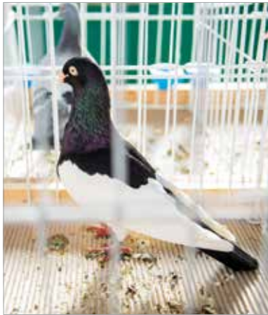
A galambászok különleges fajtákkal jelentkeztek