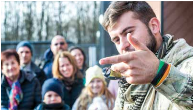
A cinege szerencsés, újra szabad lett!

Egy meggyűrűzött cinege is újra szabaddá válhatott vasárnap, de rajta kívül még több madarat megvizsgáltak, a lábukra gyűrűt helyeztek fel, és szabadon engedték őket a Sóstó Vadvédelmi Központban. Sajnos nem minden madár gyógyult meg, vannak, akik egész életükben a központ lakói maradnak. Baleset következtében félig látását