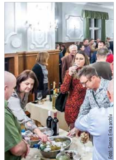
Tizenhét borvidék borait kóstolhatjuk

Fejér vármegyéből tizenegy borászattal mutatkozik be: a Csordás & Nagy Pince Pákozdról, a Bella Pince Sukoróról, a Paulus Molnár Borház, a Szabadkai Pincészet, a Geszler Családi Pincészet, valamint a Brigád a Móri borvidékről, az ApróKertek, Köllő Zsolt Pincészete és a Nagy Gábor Családi Szőlőbirtok Pázmándról, a Csóbor Pincészet Agárdról, valamint az Etyeki Kúria az Etyek-Budai borvidékről.