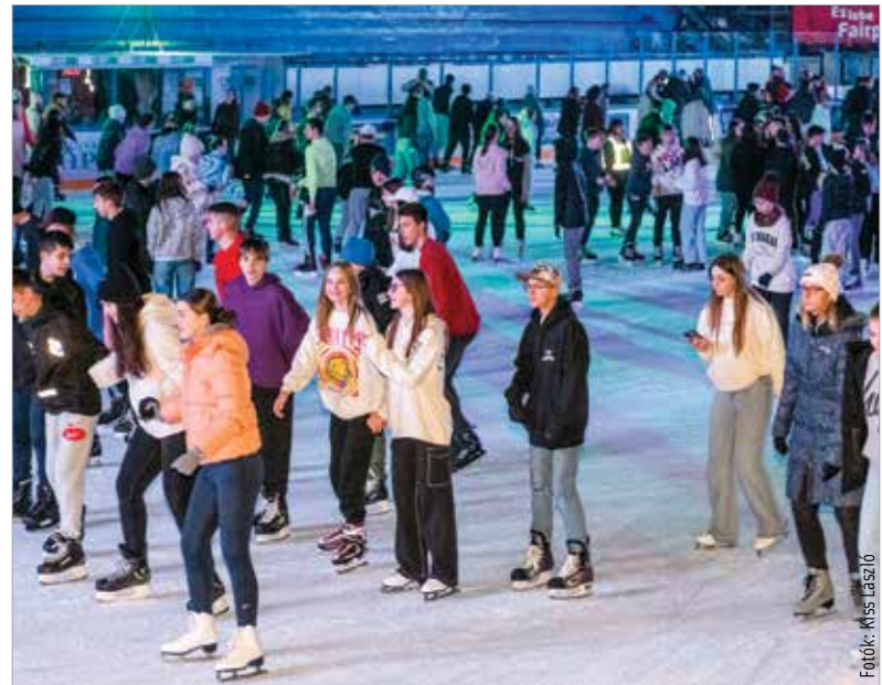
Sikeres volt a fehérvári program!