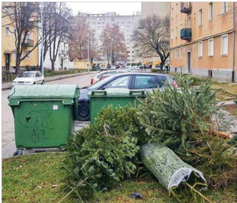
A tömbházak övezetekből január végéig viszik el a fákat

A karácsonyi ünnepkör végét jelentő január hatodikát, vagyis vízkeresztet pedig talán még kevesebben tartják, hiszen hagyományosan ekkor kellene lebontani a karácsonyfákat. Hogy a fehérváriak mennyire ragaszkodnak a hagyományokhoz, az változó. Néhányan nehezen engedik el az ünnep érzését, akár január végéig is őrzik a feldíszített fát, azonban az sem egyedi, hogy éppen csak megvárják az új évet a