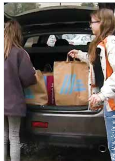
Alig pár hete, hogy a Tóvárosi iskola által összegyűjtött adományok megérkeztek. A segítségre azonban továbbra is szükség van!

„Ha a fehérváriak ellátatlan emberekkel találkoznak a lakókörnyezetükben, olyanokkal, aki nem szokott ott lenni, és hiányos az öltözete, ne kelekedjenek segíteni neki! Hiába van enyhe idő, ilyenkor is ki lehet húlni. Ha életet kell menteni, nem minket, hanem mentőt kell hívni! Ha olyan hajléktalannal találkoznak, aki segítségre szorul, de