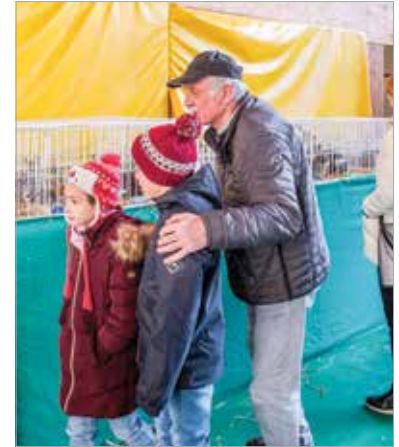
A családok számára is kikapcsolódást nyújtott a kiállítás

keretében díszmadarakat, egzotikus madarakat, díszbaromfikat, különleges galambokat, illetve nyulakat tekinthettek meg a látogatók. A nagyszámú érdeklődő láthatta a székesfehérvári bukógalamb számos példányát is, de nagy sikert arattak a hagyományos és díszbaromfik, illetve az óriásnyulak is. Külön érdekesség, hogy a kiállításon az a magyar óriásnyúl