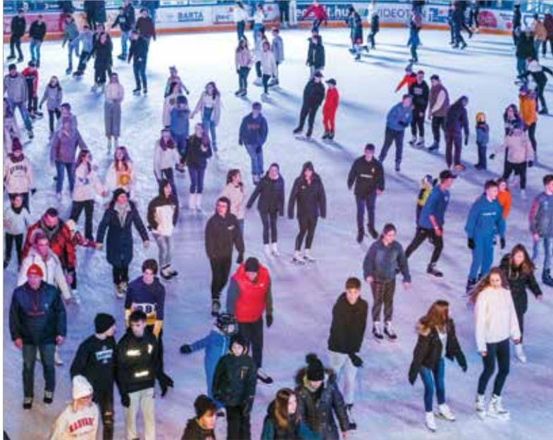
Rengetegen választották a korizást szombaton este

Kétségtelen tény, hogy Székesfehérváron szeretünk korcsolyázni. Mi sem bizonyítja ezt jobban, mint hogy régóta és kevésbé régóta korcsolyázók százei találkoztak szombat este az ifj. Orcskey Gábor Jégcsarnokban a Jégpályák éjszakáján, ahol késő estébe nyugló korcsolyázás és jégdíszkó is volt. Ezen az estén az országban több mint harminc helyszínen várták a korcsolyázókat a jégpályákon.