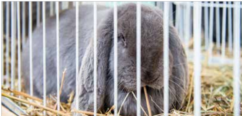
Népszerűek voltak a nyulak is