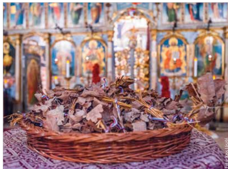
A Rác utcai Szerb ortodox templomban január hatodikán, pénteken délután istentisztelettel indult az ortodox karácsony. Badnyakszenteléssel és tűzgyújtással ünnepeltek a hívők.