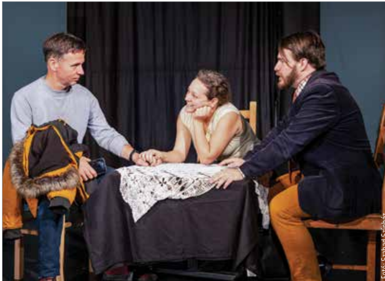
Az Örökség Csoport Örökség című előadása továbbra is várja az érdeklődőket