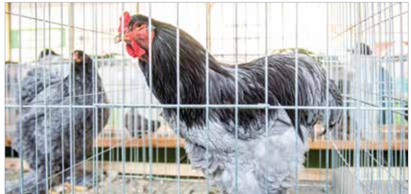
A baromfiállomány is sikert aratott