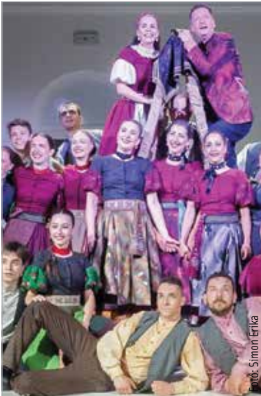
Újra itt a Mesenép!

Az egyesület máshogy nem is kezdhetné az évet, mint egy hagyományos tánc házi programmal. Január 14-én,