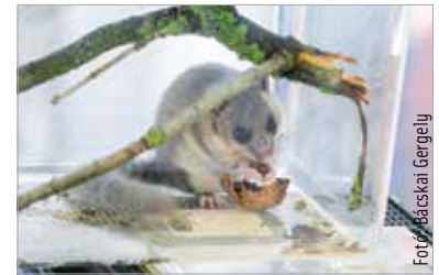
A központban felnőtt nagy pele a látogatók kedvence