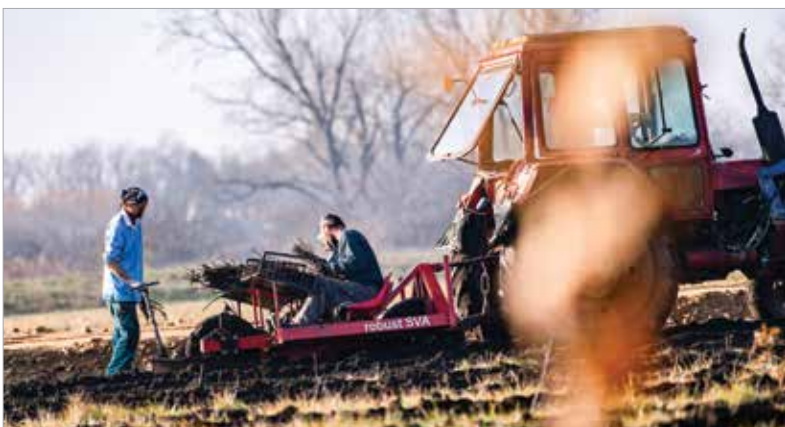
A kedvező időben jól haladnak a munkálatok

polgármester. Egyrészt az önkormányzat nem rendelkezik teljes nyilvántartással a fehérvári nyugdíjasok köréről, ezt az adatsort nem adja ki a nyugdíjfolyósító. Másrészt ha nem ebben a formában, nem támogatásként adnák a hétezer-ötszáz forintot, akkor adóköteles lenne ez az összeg. Ezért szükséges, egyben célszerű ezt igényléssel megoldani. Az igénylőlapot a székesfehérvár.hu oldalról lehet letölteni, majd a kitöltött lapot online, e-papír formájában lehet a legegyszerűbben beadni. E-mailben nem tudják fogadni a kérelmeket! Másik lehetőségként a Városháza portáján lévő gyűjtőládaiba is be lehet dobni a kitöltött igénylőlapot, illetve postai úton is fogadják az igényléseket, de annak van költsége, egyben lassabb is.