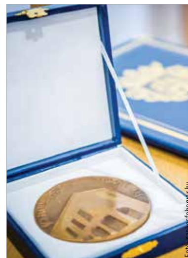
Nyolc díjra várja a jelöléseket Székesfehérvár önkormányzata

A Penna Regia, a Sipos Gyula, a Székesfehérvár Közbiztonságáért, Oktatásáért, Ifjúságáért, Egészségügyéért, Sportjáért illetve Bölcsődéi gondozásért díjakra lehet benyújtani jelöléseket. A javaslatnak tartalmaznia kell az önkormányzati díj megnevezését, amely adományozására vonatkozik a javaslat, a javaslattevő nevét, a díj adományozására javasolt személy, közösség nevét, elérhetőségét és