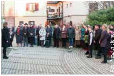
A magyarországi svábság máig egy olyan összetartó közösség, mely túlél minden nehézséget

Január tizenkilencedikét az Országgyűlés 2012-ben a magyarországi németek elhurcolásának és elűzetésének emléknapjává nyilvánította arra emlékezve, hogy 1946-ban ezen a napon hagyta el Magyarországot az elűldözött német lakosokat szállító első vonatszerelvény. A második világháború lezárását követően, a kollektív bűnösség elve alapján Magyarország területéről 1948-ig mintegy 220-250 ezer embert hurcoltak el Németországba. Székesfehérváron 2015 óta minden évben megemlékeznek a sorstragédiáról. Szerdán a Kossuth utcai emléktáblánál hajtottak fejet a megemlékezők az elhurcoltak előtt. „Nagyon sokan erről nem tanultunk az iskolában. Egészen az 1990-es évekig nem