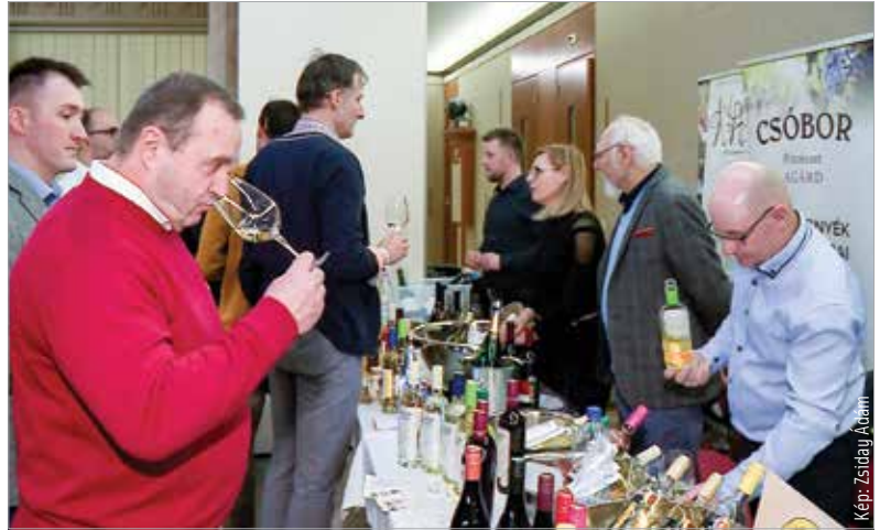
„Minden bor társ, de igazi lényét akkor tárja fel, ha közösségben isszák!” (Hamvas Béla)