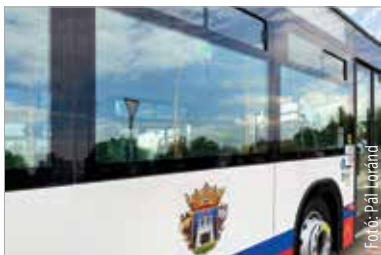
Január huszonnyolcadikától három vonalon is változásokra kell számítani

A Csapó utcából induló 11A jelű járatok végállomása a Holland fásoron, a Next Stop kanyarodósávján kijelölt Sóstói bevásárlóközpont C elnevezésű megálló lesz. A járatok nem érintik a két körforgalom közötti megállókat.