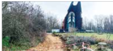
Jelenleg a kápolna környezetének felújítási munkálatai zajlanak