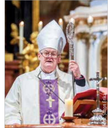
Spányi Antal celebrálta a szentmisét

A megemlékezésen a megyés püspök szívhez szóló gondolatokkal idézte meg a tragikus történeteket. Spányi Antal úgy fogalmazott: katonáink példaképek voltak, mert nemcsak hazájukért, hanem egymásért is harcoltak, és hősiességükkel egy olyan üzenetet fogalmaztak meg a jövőnek, melynek alapja a hazaszeretet és a tisztelet.