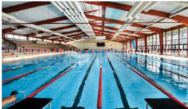
Nyitva marad az uszoda a fűtési szezon végéig, a költségek jelentős részét átvállalja a kormány

zott Vargha Tamás. Székesfehérvár polgármestere a tavalyi év végén jelezte, hogy jó esély van a megállapodásra. Az uszoda főépületének nyitva tartását akkor február tizedikéig meghosszabbította. Most azonban már biztos, hogy a fűtési szezon végéig nem kell a bezárás gondolatával foglalkozni: „A támogatás második, első negyedévre szóló része hamarosan megerkezik, hiszen hatékony és konstruktív tárgyalásokat tudunk folytatni Schmidt Adám sportért felelős államtitkárral. Az uszodát így biztosan nyitva tudjuk tartani a további téli hónapokban is. A mostani 127 millió forint az uszoda rezsiköltségének jelentős részét fedezi. A maradékot az önkormányzat állja.” – fogalmazott Cser-Palkovics András.