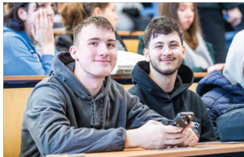
Az Óbudai Egyetem a műszaki képzések mellett a gazdaságtudományokat is elérhetővé teszi a városban. A diákoknak február tizenötödikéig van lehetőségük jelentkezni.

Székesfehérvári Városfejlesztési Közhasznú Nonprofit Kft.