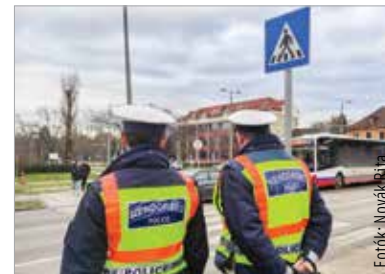
Rendszeres ellenőrzéssel szeretné a székesfehérvári kapitányság a gyalogosgázolások számát csökkenteni

A márciusig tartó közlekedésbiztonsági akció elsődleges célja a figyelemfelhívás. Azoknak a sofőröknek, akik az elsőbbségi szabályokat nem tartják be, helyszíni bírság esetén tizenötezer forintos pénzbírság és hat büntetőpont járhat. De a szabályszegő gyalogos szintén számíthat bírságra, ottól ötvenezer forintig!