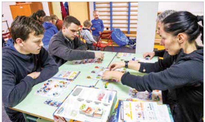
Az ünnepen jutott idő a társasjátékokra is