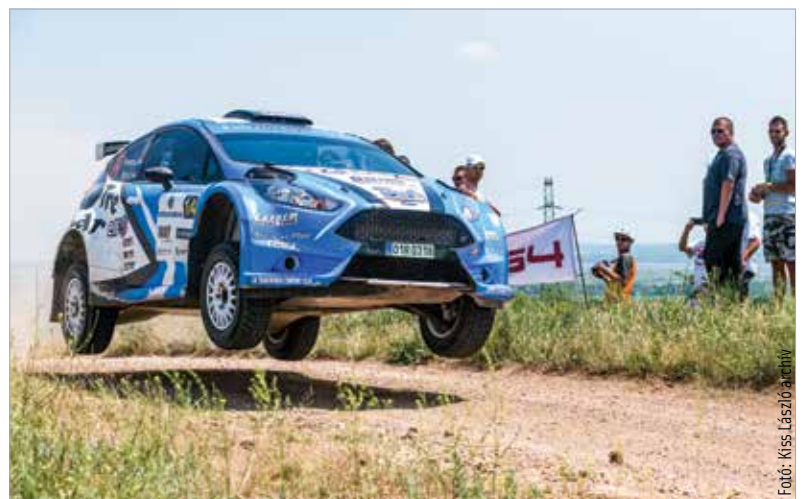
A Székesfehérvár Rallye százhusz kilométeres lesz

Az esemény hivatalosan Székesfehérvár Rallye 2023 néven fut. A táv százhusz kilométeres lesz, murvás talajjal kell megküzdeniük a versenyzőknek. Helyszín a város központja és környéke. A rendezvényt a hazai rallyesport évadnyitó eseményeként rendezik meg.