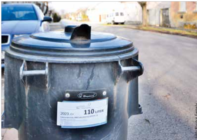
Ne felejtjük el felragasztani az új matricát!

Február 1-től már nem üríti azokat a hulladékedényeket a Depónia, amelyekre nem kerültek fel az idei évre vonatkozó matricák. A Depónia feliratú és a szolgáltató nyilvántartása szerint alkalmazott edény ürméretének, valamint darabszámának megfelelő edényazonosító matricát már mindenkinek kipostázták. A levélben érkezett az idei évre vonatkozó hulladékszálítási naptár is, amely az év folyamán végzett hulladékszálítások (vegyes, szelektív, üveg-, zöldhulladék, karácsonyfa) időpontjait tartalmazza. A hulladékgyűjtési renddel kapcsolatosan a Depónia Nonprofit Kft. oldalán a településkereső funkcióval található további részletes információ. Az edényazonosító matricát tartalmazó levélben ugyancsak postázta a szolgáltató a megfelelő darabszámú, a zöldhulladék díjmentes elszállítására jogosító matricát is, melyek 2023-ban használhatók fel. Ezeket a maximum száztíz literes, áttetsző