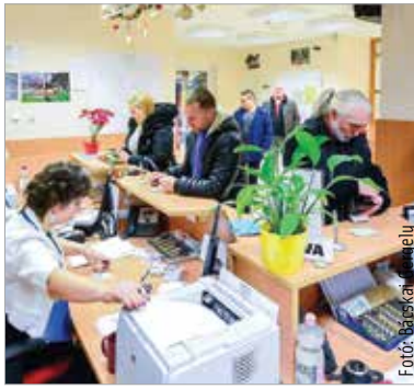
Felkészültek a megnövekedett ügyfélforgalomra

Az ügyfélszolgálat – felkészülve a várhatóan megnövekedett ügyfélforgalomra – január harmincegyedikéig, keddig meghosszabbította nyitvatartással üzemel, ugyanis a 2022-es éves bérletek 2023. január végéig érvényesek, és még mindig sokan halasztják az utolsó pillanatra a megújításukat.