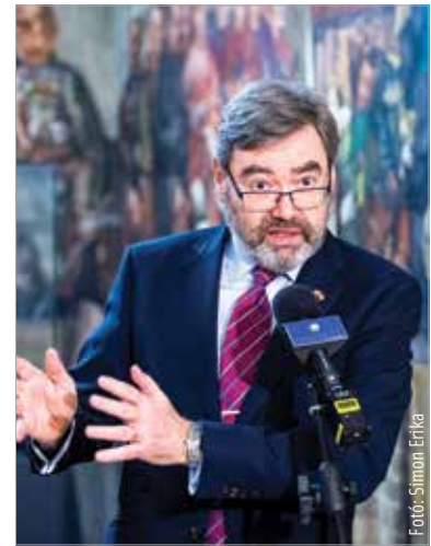
Magyarul köszöntötte a helyi sajtót a brit nagykövet