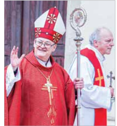
A fogadalmi szentmisét Spányi Antal megyés püspök celebrálta

esztendőben január huszadikán szentmisét tartanak Felsővárosban. Így volt ez az idén is: Spányi Antal megyés püspök a város paposságával tartott szentmisén emlékezett meg az elődök fogadalmáról. A mise után az esemény résztvevőit forró teával és a Szent Sebestyén napján hagyományos fánkkal vendégelte meg a Fehérvári Polgárok Egyesülete és a Székesfehérvári Községi és Kulturális Központ a templom előtti téren.