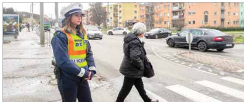
Már a rendőrök jelenléte is a szabályok betartására sarkall