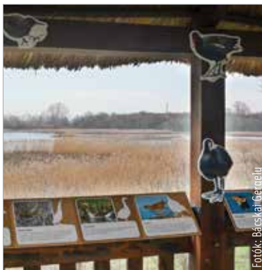
Megújultak az információs táblák