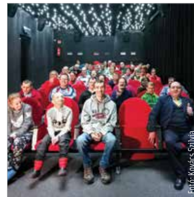
Sikerült mosolyt csalni a Szent Kristóf-ház lakóinak és dolgozóinak arcára

A cég munkatársai rendszeresen szerveznek jótékonyági megmozdulásokat – ezúttal egyértelmű volt, hogy a Szent Kristóf-ház kapja a dolgozók privát gyűjtéséből lehetővé vált karácsonyi meglepetést. A ház lakói és dolgozói Az elfeledett karácsony című filmet nézték meg a különvetítés során, amit együtt választottak ki. Mindenki nagyon várta az alkalmat, hiszen az év során ritkán adatik meg olyan pillanat, hogy