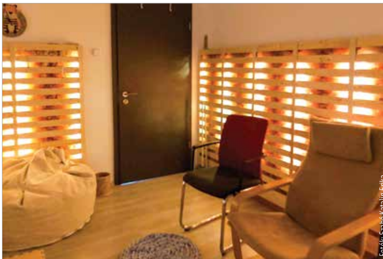
Hangulatos és az egészségnek is jót tesz a sószoza

„A pozitív hatást sóvizes párologtatókkal igyekezzük fokozni, a sónak köszönhetően pedig csírámentes, vírusmentes, valamint baktériummentes a teljes szoba. A sőtéglák, amik