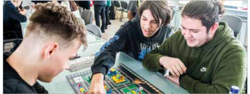
A Székesfehérvári Szakképzési Centrum öt logisztikai társasjátékot kapott a Hydrotól