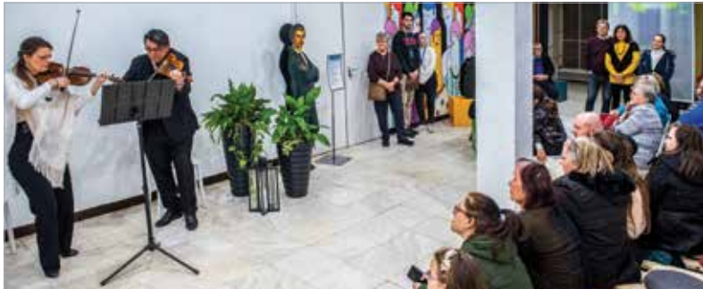
A szimfonikus zene is teret kapott az ünnepen

kar két kiváló művésze klasszikus dallamokkal emelte az ünnep méltóságát: a hegedű és a brácsa