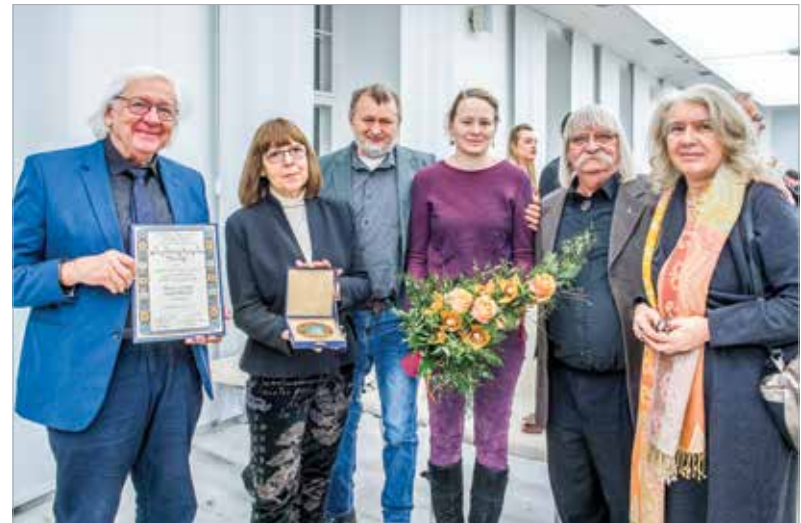
Együtt a fehérvári művészek díjazott csapata