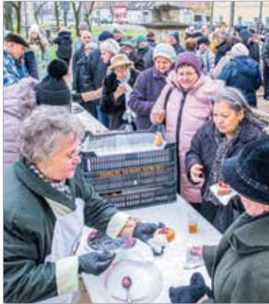
A mise végén hagyományosan meleg teával és fánkkal vendégelik meg a híveket

A Felsővárosi Általános Iskola diákjai kézen fogták egymást, és körbeölték a Szent Sebestyén-templomot – ezzel kezdődött el a búcsú.