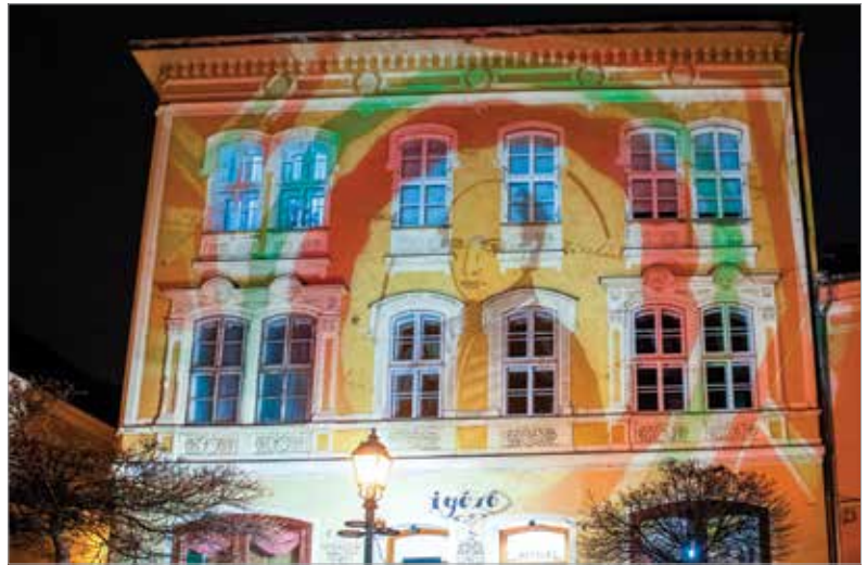
Kölcsey Ferencet köszöntötték az Igéző falán

2009-ben alapított csapata mára az ország egyik legnépszerűbb zenekara lett. A magyar népzeneből és a sanzon világából táplálkozó, pop-, rock- és funky-elemekkel, valamint