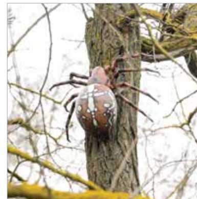
Egy gigantikus pók is költözött Sóstóra