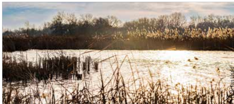
Jól vizsgázott a Sóstó vízgazdálkodási rendszere

A Sóstó vízállása százharminc centiméterig emelkedhet. A szakemberek abban bíznak, hogy még több eső esik, és akkor a szint elérése után a déli, mocsaras rész is víz alá kerülhet.