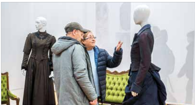
Nagy sikert arattak a Régimódi történet jelmezei