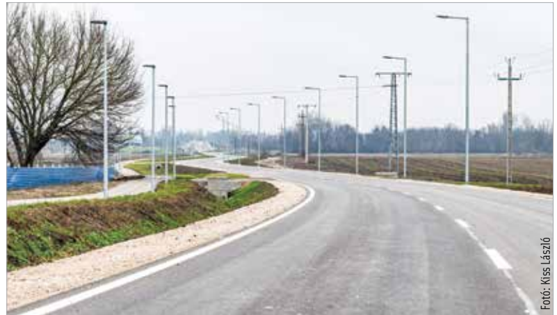
A déli összekötőút a látszat ellenére még nincs kész