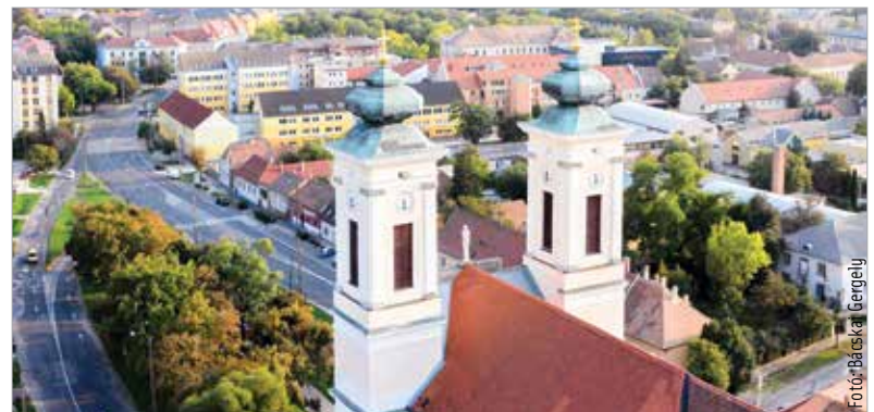
A templomban már a harmincas évek elején volt villanyáram

A templomba már a harmincas évek elején bevezették az elektromos áramot, és kivilágítottak voltak a toronyórák, azonban a város akkoriban nem fizette az áram költségeit, így azt kikapcsolták. A templom a második világháborúban megsérült, egyik tornyát el is vesztette, és csak 1960-ra lett teljes az épület – ismét a hívek adományából. Ekkor restaurálták a Szent Sebestyén-szobrot is.