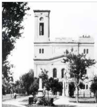
A második világháborúban megsérült a templom is

A két torony építése Fridl Károly rajzmester tervei alapján 1836-ban történt meg. Az építkezés idejére még a téglágot is a templom rendelkezésére bocsátotta a város. A követ a Csúcsos-hegyi kőbányából hordták, az