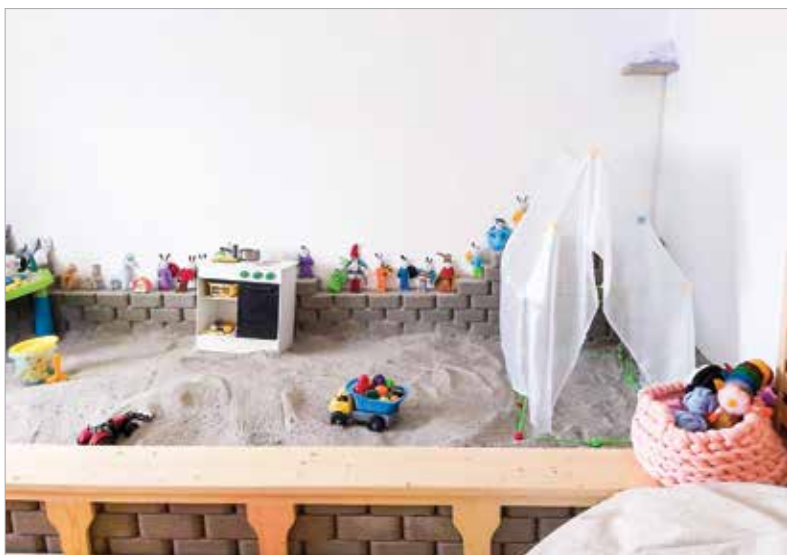
A kicsiknek sóhomokozó is van

A sószobát alapvetően két különböző célra szokták igénybe venni. Egyrészt a betegségek megelőzése érdekében – ide tartozik az immunrendszer megerősítése, a felkészülés az allergia- és influenzaszazonra vagy a test általános állapotának javítására – ezalatt leginkább a stressz, a kimerültség, a fáradékonyság, esetleg az alvászavar enyhítése, megszüntetése értendő, amire ugyancsak jó megoldás lehet a sóterápia. Ebben az esetben a sószoza hetente egyszeri látogatása ajánlott. Kevésbé szerencsés esetben az emberek nem megelőzés, hanem