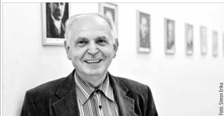
Saitos Lajos (1947–2023)

közös tapasztalásaink sűrítményeit tárta elénk. Olyan jellemző eseményeket, megrázkódtatásokat, egzisztenciális töréseket fogalmazott meg, melyeket érzékelhettek, átélhettek az emberek. Hitte és tudta, hogy a mai ember világképe egyre kevésbé ered a rácsodálkozó szemlélődésből. Ars poeticája maga az életút, egy egyéni tágasság keresése, egyben a múlt vizsgálata volt. Önálló kötetei – Elvétett ünnepeink, Éhségben, szomjúságban, Ézredvégi apokrif, Évszakok hullámverése, Por Isten szemében, Át a mezőn, Eleven fény, Mire megvirrad, Heródes testbeszéde – egyaránt hordozzák az igényes gondolatvilágot, mely jellemezte életét és írásait. Emlékét megőrizzük.