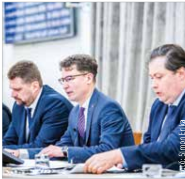
Majdnem négyötödös többséggel fogadta el a testület Székesfehérvár idei költségvetését

A képviselő-testület majdnem négyötödös többséggel fogadta el Székesfehérvár 2023-as költségvetését: huszonegyből tizenhét igen szavazattal döntöttek a városatyák. Fehérvár alampüködése az energiaárak emelkedése és az infláció okozta drágulások mellett is biztosított: „Száznégymilliárd forint a költségvetés főösszege. Ebből a legfontosabb az a harminckétszázmilliárd, ami saját bevétel. Ezen belül huszonhárommilliárd forint iparüzési adóval és négy milliárd forint építványadóval számolunk. Magánszemélyeknek továbbra sem kell helyi adót fizetniük Székesfehérváron. Negyvennégy milliárd forint körüli összeget költünk működésre – ez az intézmény- és városüzemeltetést jelenti. Kicsivel több mint ötvenmilliárdot költünk fejlesztésekre. Ebbe az áthúzódo fejlesztések is beletartoznak” – fogalmazott Cser-Palkovics András polgármester. Ilyen fejlesztés például a multifunkciós csarnok, az iskolafelújítási program, a kerékpárutak építése és a Fehérvár Tüdejé program. Az 50,7 milliárdos fejlesztési költségvetés jelentős részét, 39,4 milliárd forintot az állami támogatás adja, emellett szerepel a tervezetben az európai uniós