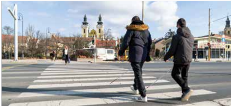
A fehérvári kereszteződésekénél már hangos jelzőlámpák segítik az átkelést