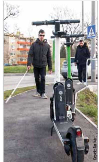
Van, hogy egyszerre több roller is a látássérültek útjában áll