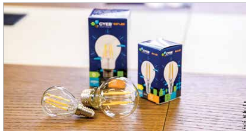
Csaknem három ezer háztartásban cserélhetik ki a régi izzókat LED-égőkre

A programban való részvétel feltétele, hogy az ingyenesen megkapott LED-ek a jelentkezéskor megadott háztartásba kerüljenek, és ott minimum két évig használatban is legyenek. A régi, hagyományos izzókat nem kell leadni. Az átvételhez szükséges a személyi igazolvány, a lakcímkártya és papíron az adott címre vonatkozó villanyszámla. Meghatalmazással mások által igényelt csomag is átvehető. Ennek menete, a városrészek szerinti időpontbeosztás és minden további fontos részlet megtalálható a székesfehérvár.hu honlapon.