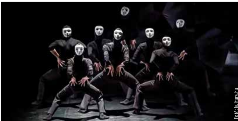
A prágai társulat nem csak klasszikus balettet játszik

táncművészet elismert nagykövétévé vált, rangos díjakat nyert el külföldön is. Jelenleg tíz állandó taggal és hat gyakornokkal dolgozik, saját technikai stábjával és menedzsmenttel rendelkezik. A repertoárjában a klasszikus tánc elemei éppúgy megtalálhatók, mint kortárs és modern technikák. Magyarországra az Intimate clouds című, kétrészes előadásukat hozzák el április negyedikén, kedden a székesfehérvári Vörösmarty Színházba. A Bizalmas levelek és a Fekete felhők nem sírnak című darabok lesznek láthatók. A programra a színházban már kaphatók a jegyek.