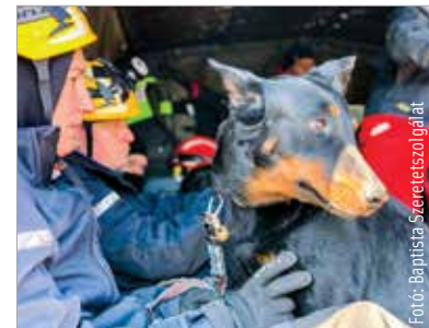
A mentőcsapat oszlopos tagjai voltak a kutyák is: sokat segítettek a speciális mentőknek a túlélők felkutatásában

„Ekkor már minden ház alól élőket jeleztek a családtagok, azt mondták, hangokat hallottak. Amikor a ház alatt ott vannak valakinek a hozzátartozói, és megjelennek a markológépek, akkor szerintem teljesen normális, hogy nem akarják feladni a reményt, megpróbálnak mindenbe belekapaszkodni. Erről szólt a munkánk az utolsó két napban. Háromszáz házat néztünk át úgy, hogy már többször is voltunk bennük. Amikor a kutya először megy