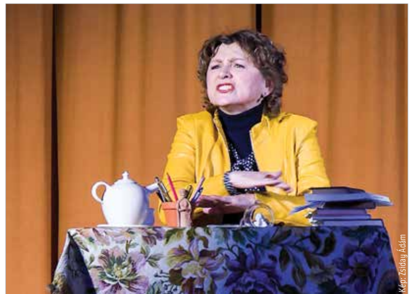
Jókai Anna iránymutatást adott az élethez

tetlenül szükséges tárgyak jelezték a közelséget, az otthonosságot, segítségükkel elevenedett meg előttünk Juhász Róza alakításában Jókai Anna: versek és prózák hangzottak el, az életút fontosabb állomásaira utalva. Az előadás hűen adta vissza Jókai Anna egy fontos gondolatát: „A multikulturális gondolatok nem azt jelentik, hogy mindenki özszevissza beszélhet, hanem hogy a sok anyagban találkozhat a világ bölcsessége!”