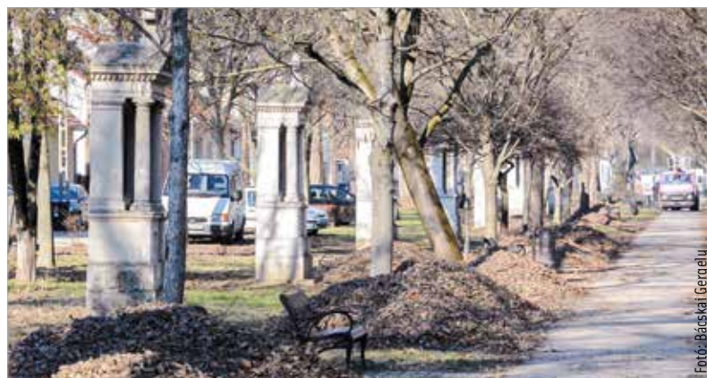
A kálváriát övező fák többsége jó állapotban van

meg. Az elsődleges azonban minden esetben a faápolási szempontok figyelembe vétele és minél több egyed megmentése. A kálváriatoron szerencsére az idősebb fák is jó állapotban vannak, azonban található itt tíz, hatvan-hetven év körüli nyugati ostorfa, közel egyméteres átmérővel. Közülük három nagyon rossz állapotban van és veszélyes. Ezeket nem lehet megmenteni, ki kell vágni, nehogy nagy bajt okozzanak. A Városgondnokság az idős egyedek pótlásáról is gondoskodni fog, olyan helyen, ahol azt a közművek megengedik.