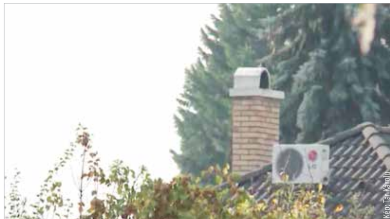
Családi házaknál egyeztetett időpontban ellenőrzik a kéményeket

Az egy lakásos lakóingatlanokban, vagyis a családi házakban nem kötelező a rendszeres kéményseprés, azonban gázfűtésnél két évente, szilárd tüzelésnél évente, megrendelés alapján, térítésmentesen történik a munka egy előre egyeztetett időpontban. A társasházakban sormunka alapján dolgoznak a szakemberek – itt kötelezően el kell végeztetni a kémények ellenőrzését, tisztítását. Ennek 2023-as ütemterve már elérhető a városi honlapon is. A vonatkozó törvény szerint kéménytűz, illetve szén-monoxid-szivárgás esetén a tulajdonosnak azonnal szüneteltetnie kell a tüzelőberendezés és az égéstermék-elvezető üzemeltetését.