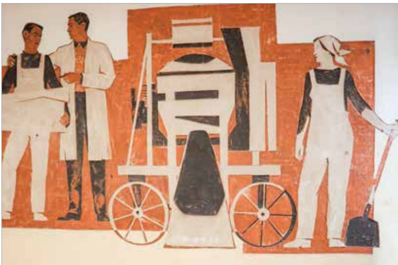
Az „Építkezők” 1960-ban készült