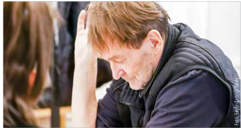
Ezzel a rendezéssel tér vissza Székesfehérvárra Cserhalmi György

játéka, és máris többről van szó, mint egy gyilkossági ügyről. A mára már klasszikussá vált mű lefegyverzően beszél félelmekről, előítéletekről, gyengeségekről. A Vörösmarty Színház is műsorára tűzte évekkel ezelőtt a darabot, most pedig egy rendkívüli felújításban lesz ismét látható. A színház épülete átmenetileg zárva van, de a Városháza Dísztermében színházi élményhez juthatnak a nézők! Már a díszletek is állnak, a próbák is megkezdődtek. A februári előadásokra villámgyorsan elkapkodták a jegyeket, de a színház honlapján van regisztrációs lehetőség a későbbiekre.