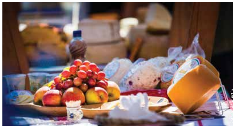
Hagyomány, érték, minőség

termék előállításában mennyiben támaszkodnak a hagyományos módszerekre és technológiákra. Az elismerést azok kaphatják meg, akik igazoltan Fejér vármegye közigazgatási területén termelt vagy gyűjtött alapanyagokból készült termékeket állítanak elő. A pályázatot idén két kategóriában – feldolgozott élelmiszer, valamint kézműves ipari termék – nyújthatják be a jelentkezők. A pályázati felhívás adatlapja, valamint a pályázható termékek köre megtalálható a Fejér Vármegyei Önkormányzat honlapján és a www.fejerpaktum.hu oldalon.