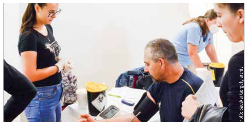
Vérnyomásmérésre és specifikus vizsgálatokra egyaránt lehetőség lesz a szűrőnapokon