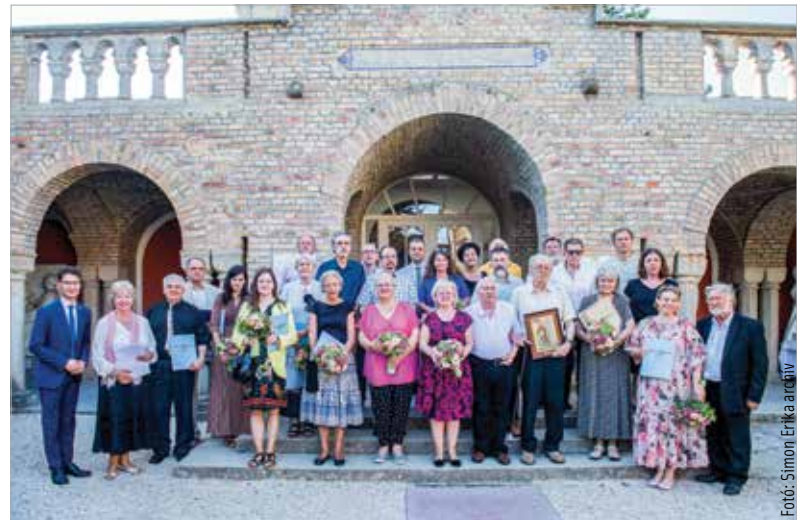
A Lánzos–Szekfű-ösztöndíj díjazottjai a tavalyi ünnepélyes átadón

teremtettek, illetve tartalmaznak. A pályázatokat április harmadikáig lehet benyújtani. Az ösztöndíjak odaítéléséről, összegéről az alapítvány kuratóriuma dönt. Kedvező elbírálás esetén az ösztöndíj átadását követően utalják át a megítélt összeg ötven százalékát, míg a másik felét a pályamunka elfogadását követően fizetik ki. A támogatás adómentes. A díjat hagyományosan az augusztus huszadikai ünnepségekhez kapcsolódó nyilvános kuratóriumi ülésen adják át. Ez eseményt az utóbbi években a Bory-várban rendezték.