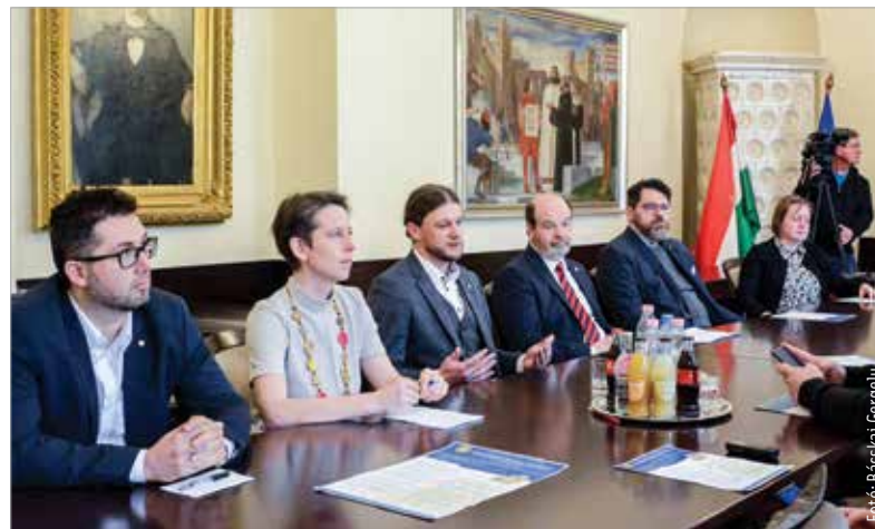
Kétéves programsorozattal és kiállítással ünnepli fennállásának százötvenedik évfordulóját a múzeum

A kezdetek 1871-re nyúlnak vissza, amikor egy újságcikk hatására mozgalom született. Az intézmény jogelődje az 1873-ban életre hívott Fejérmegyeyi és Székesfehérvári