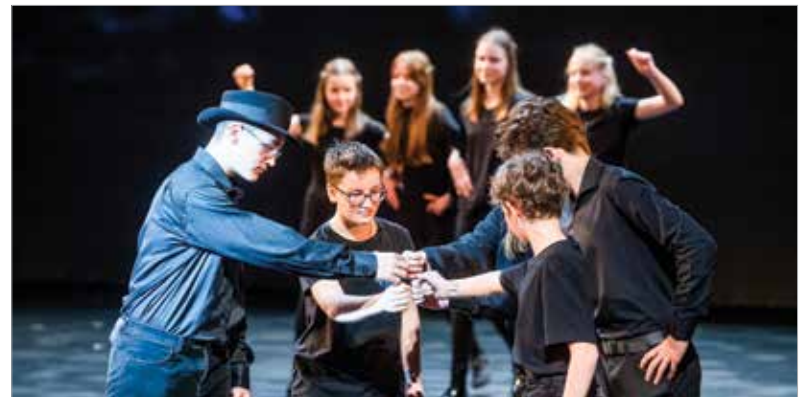
„Nem azé a madár, aki elszalajtja”

része szállít fegyvereket Ukrajnának. Magyarország azonban kitart álláspontja mellett, vagyis nem szállítunk, és nem is engedünk át fegyverszállítmányt hazánkon.