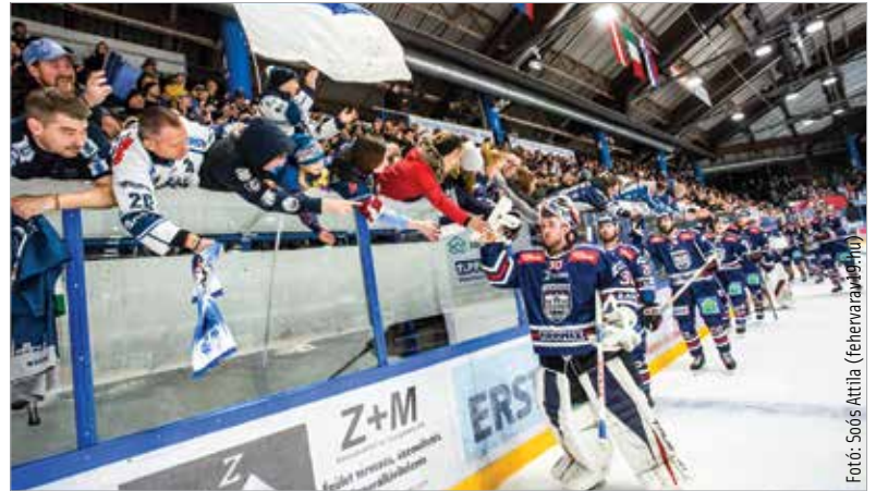
Ebben a szezonban is járt a köszönet a szurkolóknak a csapat tagjaitól!