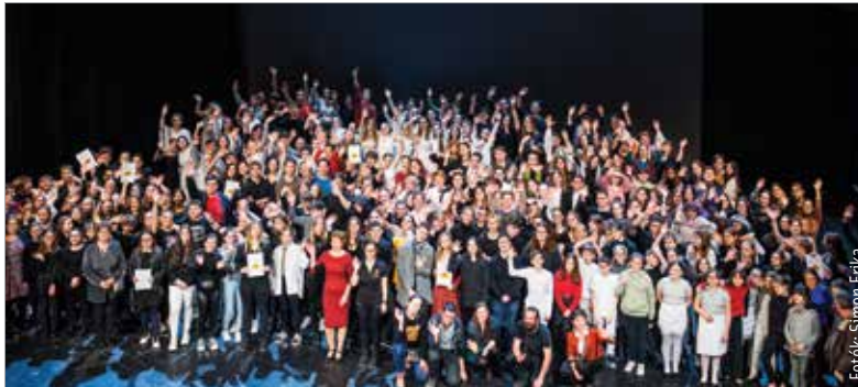
A bejelentés pillanata

Ötletes megoldásokat láthatott a közönség az egyes Arany-balladák feldolgozására hétfő este: az Aranyszék című produkcióból kiderült, hányféleképpen jelenhet meg a halál, az elmúlás, a szerelem, az örület, a szabadság és a hűség a színpadon. Az Atlantisz program első előadását 2015-ben láthatta a fehérvári közönség a Vörösmarty Színházban. E művészeti nevelési program célja, hogy közelebb hozza a színházat a gyerekekhez. Az elmúlt években így játszhatta el több száz diák a Lúdas Matyit, Arany János Toldi című elbeszélő költeményét, valamint az Odüsszeiát is. Most Arany János balladáin volt a sor.