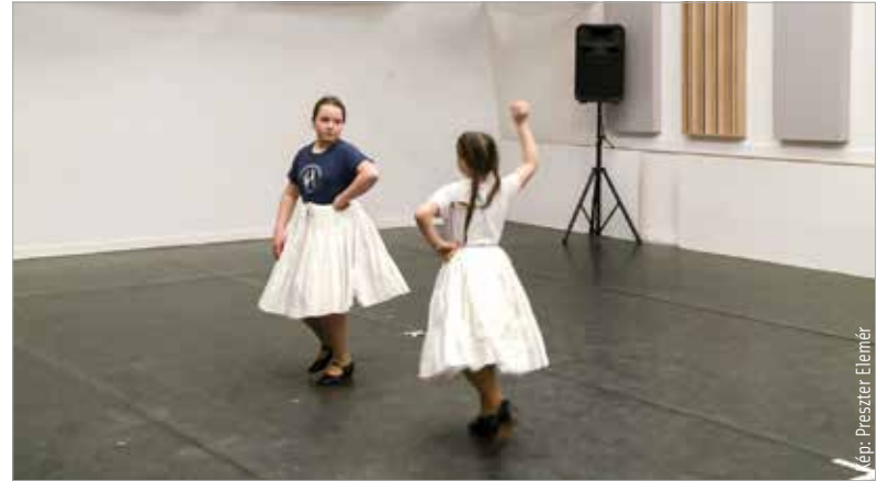
A legfiatalabbak is bemutatkozhattak a találkozón