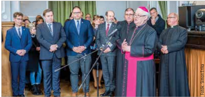
Székesfehérvár önkormányzata és a város közössége megbecsülését Cser-Palkovics András polgármester tolmácsolta a főpásztornak

a Magyar Katolikus Püspöki Konferencia, az egyházmegyei papság, a szerzetesrendek, a város, a vármegye és a különböző civilszervezetek megannyi képviselője. Udvardy György veszprémi érsek tekintett vissza Spányi Antal hittel végzett tevékenységére, majd Ugrits Tamás pasztorális helynök tolmácsolta Ferenc pápa áldását és köszöntőjét. A katolikus egyházfő méltatta Spányi Antalnak az Esztergom-Budapesti Főegyházmegyében, majd a Székesfehérvári Egyházmegyében mutatott tevékeny lelkipásztori buzgóságát, kitartását, a nehézségek között is