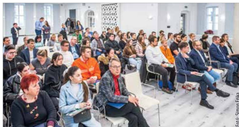
A hallgatók a tematikus héten megismerhették a civilszervezetek működését

Magyarországon közel hatvanezer civilszervezet működik, szerepük pedig egyre nagyobb. Erről Szalay-Bobrovniczky Vince civil- és társadalmi kapcsolatokért felelős helyettes államtitkár számolt be a hallgatóságának: „A fiatalok számára bekapcsolódási lehetőséget szeretnénk kínálni a civilszervezeti életbe. Erről szólna az a szeminárium, amit tervezzünk a Kodolányin, hogy a fiatalok számára minél vonzóbbá tegyük a civiléletet.”