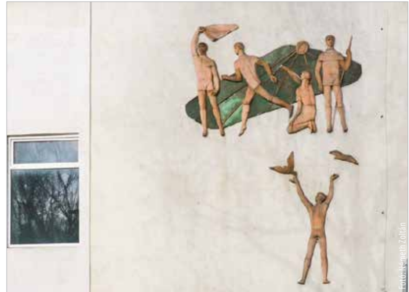
Lesenyei Márta Tornászok című domborműve a Deák és a Martinovics utca sarkán látható