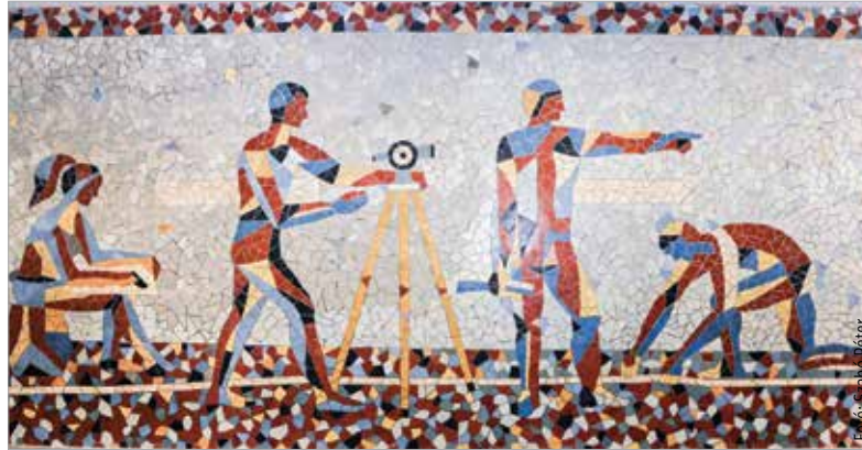
A Földmérők című, kilenc négyzetméteres mozaikot Koppány Attila tervezte és Horváth Imre készítette

1974-re datálódik az iskola aulájának díszje, a Földmérők című mozaik. A közel kilenc négyzetmé-