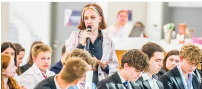
Komoly tartalmi munka zajlott Székesfehérváron

„Érdemi konzultáció, párbeszéd és vita alakult ki, komoly munka zajlott az elmúlt napokban Székesfehérváron. Nagy büszkeség számunkra, hogy házigazdaként negyedik alkalommal