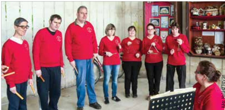
A Szent Kristóf Ház gondozottjainak alkotásaiból nyílt tárlat a Fő utcán. Az alkotások a Márvány udvar bejáratánál lévő kültéri vitrinekben tekinthetők meg.