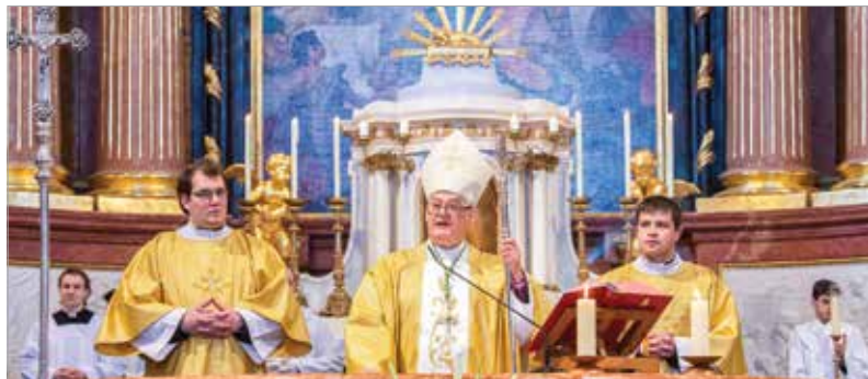
Az áldás negyedszázada mindannyiunké

megőrzött kiválóságát, a papok és a hívők iránt tanúsított gondoskodását, valamint a Magyar Katolikus Püspöki Konferenciáért végzett munkáját.