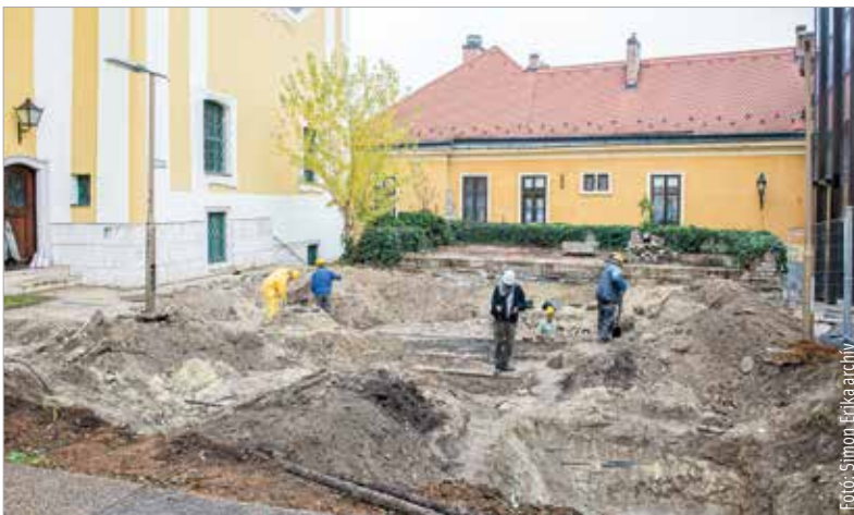
Az ásatai munkák kezdete novemberben

Mint az intézmény közösségi oldalán olvasható, az ásatai eredményeivel a nagyközönség testközelből is megismerkedhet: március 31-én, pénteken 13.30-tól és 14 órától nyílt napot tart a Szent István Király Múzeum az ásatai helyszínén. A programon való részvétel előzetes regisztrációhoz kötött, jelentkezni a bejelentkezés@szikm.hu e-mail-címen lehet március 30-án, csütörtökön 15 óráig.