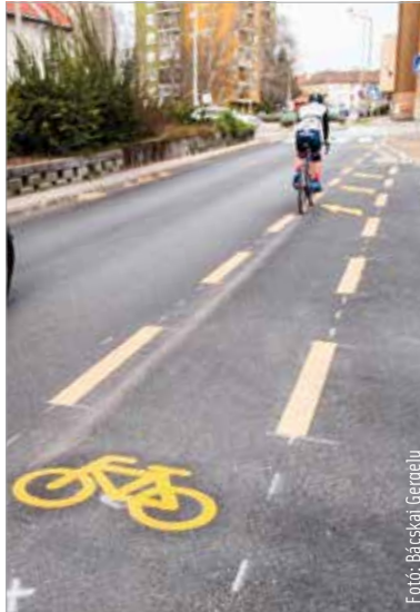
Az új kerékpársáv a Rákóczi úton

A hálózati fejlesztések tovább folytatódnak a Móri út felújítása és a Kiskút útja átépítése során, a vasútállomásnál pedig új, fedett biciklitárolókat helyeznek majd ki. „Az arra közlekedők már láthatták, hogy elkészült a Rákóczi út Széna tér és József utca közötti szakaszán a felújítás és a kerékpársáv-építés. Azért kiemelten fontos ez, mert kulcsszakaszt jelent a kerékpárutak hálózatosodásában. A kerékpárnak ugyanis csak akkor van valós esélye alternatívaként az autó helyett, ha a lehető legtöbb úti célt el lehet vele érni külön sávon, külön úton. Persze a teljes hálózat kiépítése években és százmilliókban, ha nem milliárdokban mérhető folyamat, de dolgozunk rajta, egyszerre egy-két kisebb szakasszal” – fogalmazott a polgármester. Az eddig elkészült sávokon túl a Móri út első ütemének felújítása és a Kiskút útjának átépítése is tartalmaz kerékpáros fejlesztést. „Leggyakrabban a holland példát szokás felhozni a kerékpáros fejlesztések