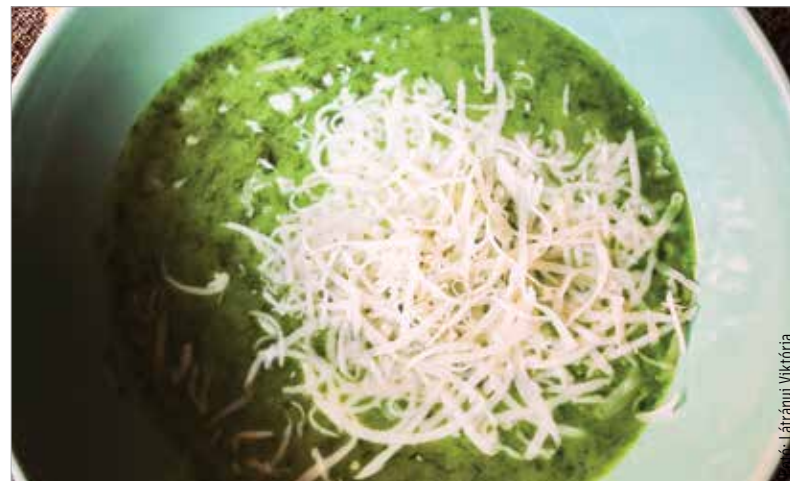
Gyorsan elkészíthető, finom és egészséges!

coljuk meg a burgonyát, és vágjuk apró darabokra. Egy nagyobb méretű lábosban hevítsünk fel egy kanál olajat, majd tegyük bele a medvehagymát, aztán a felaprított krumplit, és gyakran kevergetve pároljuk meg. Ezt követően öntsük fel vízzel, tegyük bele a fűszereket és morzsoljuk bele a leveskockát. Forraljuk körülbelül tizenöt-husz percig. Amikor a krumpli megpuhul, vegyük le az edényt a tűzhelyről, és a tartalmát pépesítsük botmixerrel. Vegyünk ki belőle néhány evőkanállal, keverjük össze a főzőtejszínrel, és folyamatos kevergetés mellett öntsük vissza a levesbe. Tegyük még egy kis időre a tűzhelyre a krémlevesünket, és főzzük együtt a tejszínrel forrásig. Tálalhatjuk reszelt füstölt sajttal, pirított kenyérkockával vagy pirítottal is!