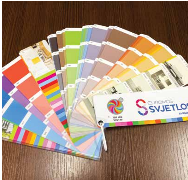
A falfestékek között a bíborvörös a legnépszerűbb

A vörösnek ez az árnyalata jól illik az otthonokra mostanában jellemző szürke összes árnyalatához, de a földszínekkel sem vész össze. Ezért aztán bátran használhatjuk kiegészítő árnyalatként! Megtehetjük díszpárnákkal, vázakkal, gyertyatartókkal, díszlákkal vagy akár egy faliképpel, esetleg