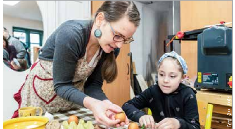
A legkülönbözőbb technikákkal készültek a hímes tojások