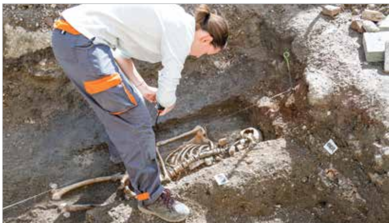
A középkori templom körüli temető további részleteit is sikerült feltárni

ban szereplő Alba Civitas bizonyítja az ispáni vár meglétét. Számos erődítésfalat és a védműhöz tartozó árokszakaszokat is találtak a kutatók során. Ezen belül helyezkedhetett el a négykaréjos alaprajzú templom, amit a kutatók többsége a Szent Péter-plébániatemplommal azonosít, és van arra vonatkozó adat, hogy Géza nagyfejedelem is itt temették el feleségével együtt.