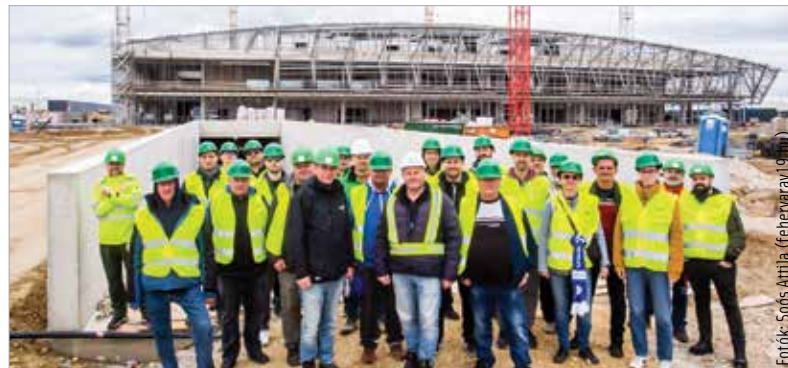
Nem építőmunkások, szurkolók! Nemsokára betöltheti a hangjuk a csarnokot.

hogy a csapat és a szurkolók is otthon érezzék magukat az Alba Arénában. Az új csarnok a tervek szerint decemberben készül el, a kivitelezés most nagyjából ötven százalékos