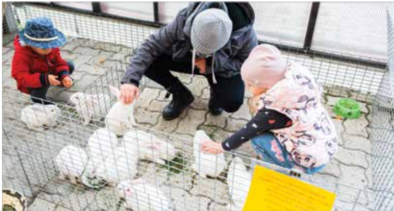
A nyuszikkal is sokan ismerkedtek