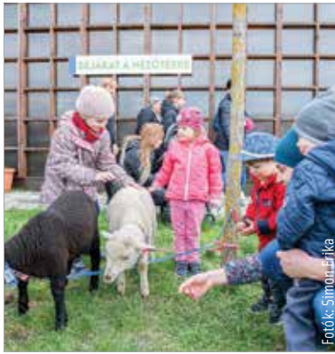
Nagy sikert arattak a bárányok

A húsvéti ünnepekör hagyományaihoz méltóan olyan játékokat is megismerhettek a gyerekek, amelyek gondolatosságukban kapcsolódtak a húsvét eszmerendszeréhez. A gyermekes szülők számára igazi kikapcsolódást nyújtott a kötetlen programkavalkád, amit mosolygós arcok erősítettek meg a napsütéses márciusban.