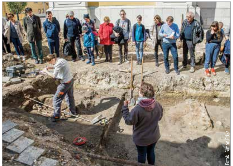
A Géza nagyfejedelem téri feltárási eredményeit ismerhették meg a fehérváriak

rüli temető további részleteit is sikerült feltárniuk a Szent István Király Múzeum szakembereinek. Főleg a török kor utáni sírok maradványait találták meg. Az előkerült leletanyag változatossága tanúskodik a történelmi belváros kiemelt szerepéről. Ezen a területen jött létre Fehérvár legkorábbi településrészlete. Ezt bizonyítják az előkerült Arpád-kori kerámialeletek is. A források-