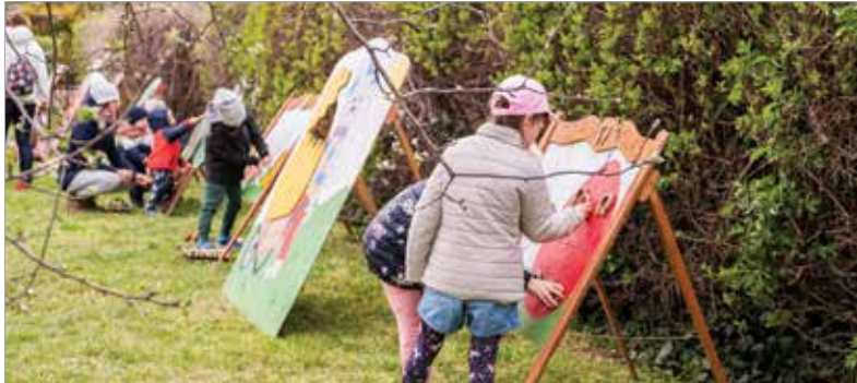
A logikai játékok nagy sikert arattak

A hűvös időjárás ellenére is több húsvéti programra várták a kicsiket és nagyokat városzerte. A Fehérvári Kézművesek Egyesülete házában játékos tavaszváró volt nyuszikereső játékkal és kézműves programokkal, de Sóstón és Maroshegyen is családi programokkal várták az érdeklődőket.