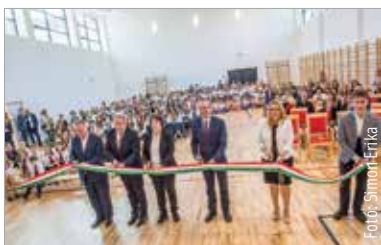
Nézze meg az új közösségi tereket: a székesfehérvár.hu oldalon böngészheti képgalériánkat!

Az iskolába mintegy ötszáz gyerek jár. Az intézmény legrégebbi épületszárnya a Mártírok útjára néz, és 1943-ban épült, majd az újabb rész 1959-ben, az új rész tetőtere pedig 2002-ben. 2021-ben komoly beruházás keretében kezdtek el az intézmény korszerűsítését. Az iskola területén két éve indult a beruházás, aminek részeként új tornaterem épült, beépítették a tetőteret, ahol az egyes művészeti ágak, tanszakok követelményei szerint az alapfokú művészetoktatás, a tehetséggondozás folyik. Egy kórustermet, valamint a tornaterem melletti területen épületbővítéssel tánctermet is kialakítottak. Az új szinten még három teremnek és az énekkar számára egy próbateremnek is jutott hely.