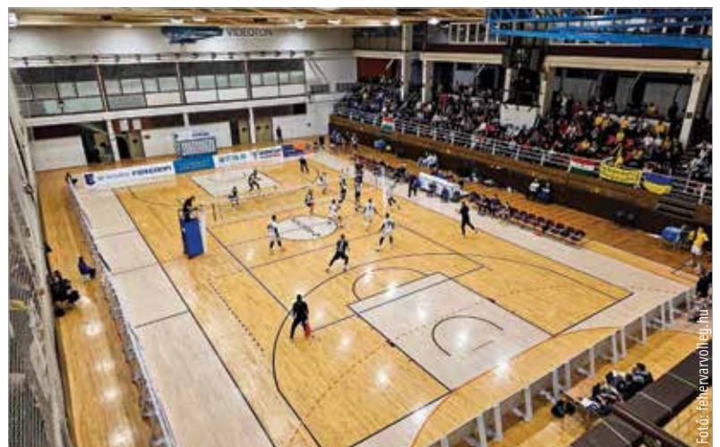
Legutóbb is sokan bátorították a VOK-ban a csapatot, pénteken a döntőt is kiszorolhatják!