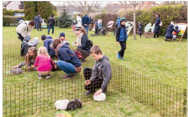
A rossz idő ellenére is sokan választották a szabadtéri eseményeket