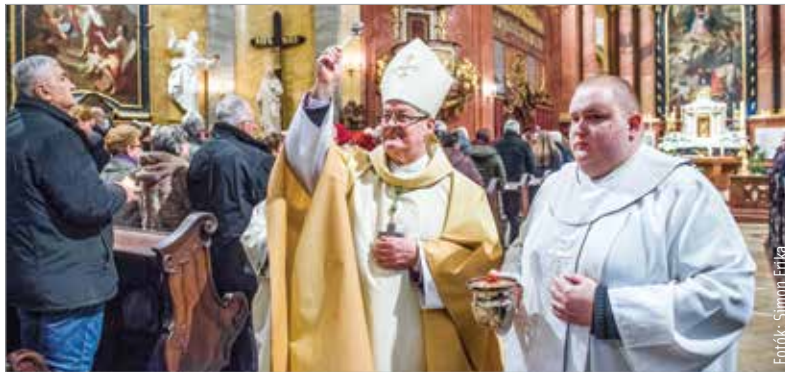
A félelem nélküli öröm ünnepe nem egy estére vonatkozik

„Krisztus nem erre a világra támadt fel, nem maradt közöttünk: feltámadt az örök életre! Krisztus akkor legyőzte a halált, legyőzte a világ sötét hatalmát, és ma