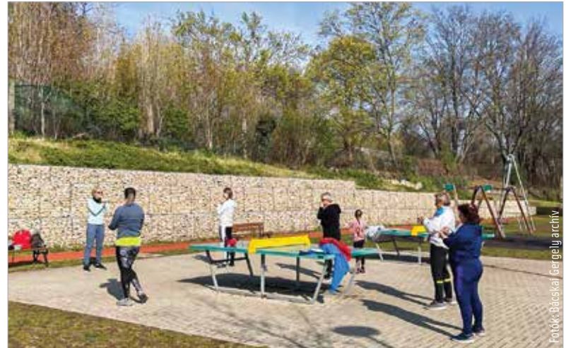
Ingyenes vezetett edzés a Túrósáki úti szabadidőparkban

az Erzsébet utcában, még csak tervben volt az ugyanilyen sportter kialakítása a Bregyóban és a Haleszban. Az ingyenesen használható sportlétesítmények mellett több mint száz egyesület és szakosztály is várja a sportolni vágyókat Székesfehérváron.