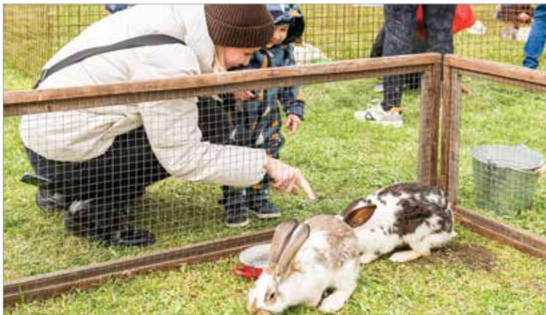
A nyuszisimogató minden gyerek kedvence