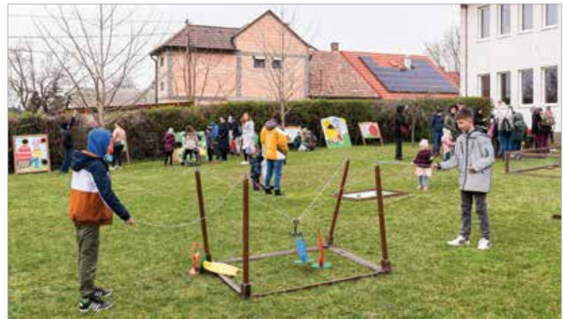
Ügyesség és technika – ez a siker titka!