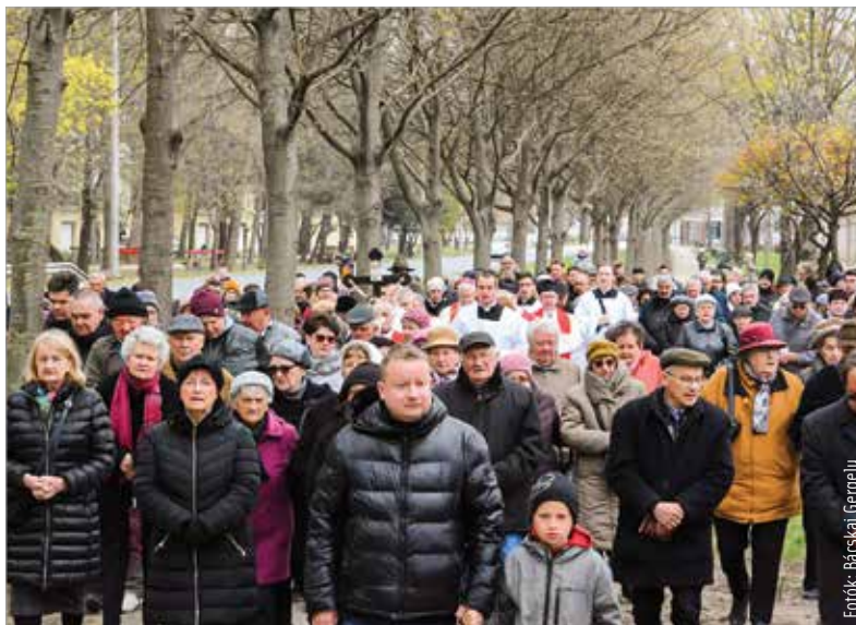
Az idei keresztútjáráson a család állt a középpontban