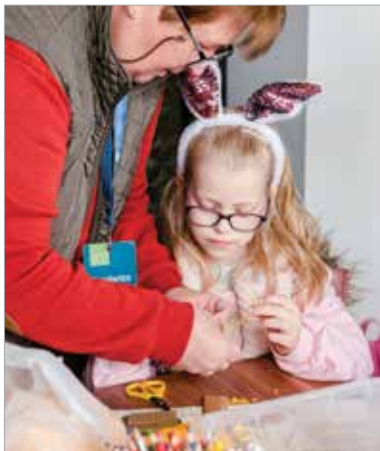
A kis kézműveseknek is kedveztek a húsvéti programokkal