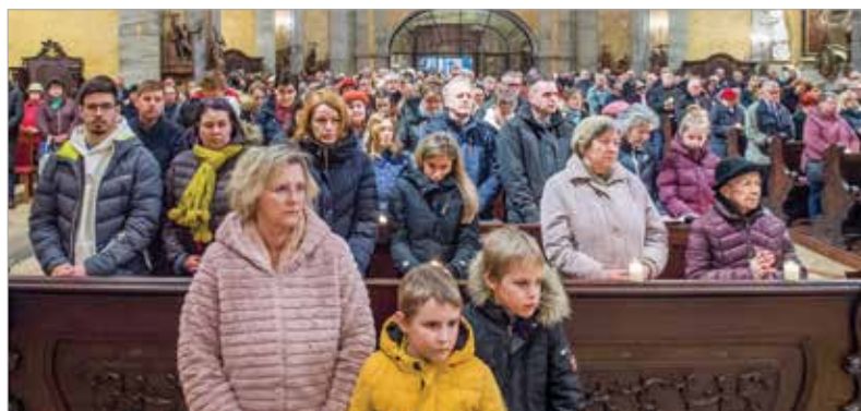
Krisztus a mi életünkben is győz!

A szentbeszéd után a jelenlévők megújították keresztségi fogadalmukat, közösen elimádkozták a mindenszentek litániáját. A püspök megáldotta a vizet, mellyel a sorok között járva meghintette a híveket. Az ünnepélyesség fokozódott, majd a békeköszöntés alatt az Oltárszentesség is visszatért a templombelsőbe. Áldozás után – mivel az időjárás nem tette lehetővé a belvárosi körmenetet – a szentségi áldás után fejeződött be a püspöki szentmise.