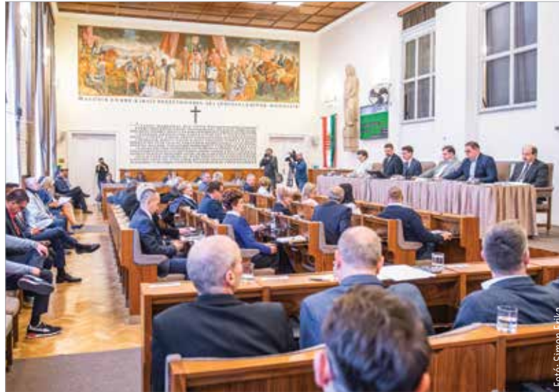
A város egyszeri, vissza nem térítendő támogatást ad a fehérvári rendelők közüzemi díjaihoz

A testület döntött arról is, hogy az autizmussal élő gyermekek nevelése jobb körülmények