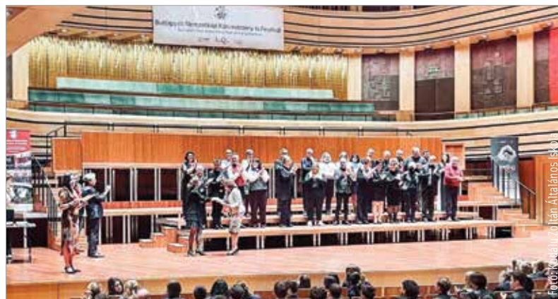
A kóruséneklés igazi csapatmunka

Az ötfős, izraeli, osztrák, olasz, svéd és magyar szakemberek alkotta zsűri az éneklés tisztasága mellett értékelte az előadás módját, a műsor dramaturgiáját, a hangszínt, a gyermekek beleélését. Mindezek tükrében még nagyobb eredmény, hogy a kórus és karnagy első nemzetközi versenyüket aranydiplomával, kategóriájuk második helyezettjeként zárták.