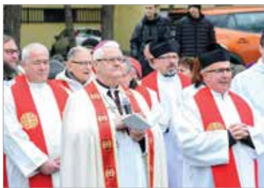
A keresztút eredetileg az a mintegy másfél kilométeres útvonal, amelyen Jézus a kereszttel a Praetoriumtól kiment a Golgotára

A nagypénteki keresztútjárás során immár hagyományosan itt idézik fel Jézus szenvedésének