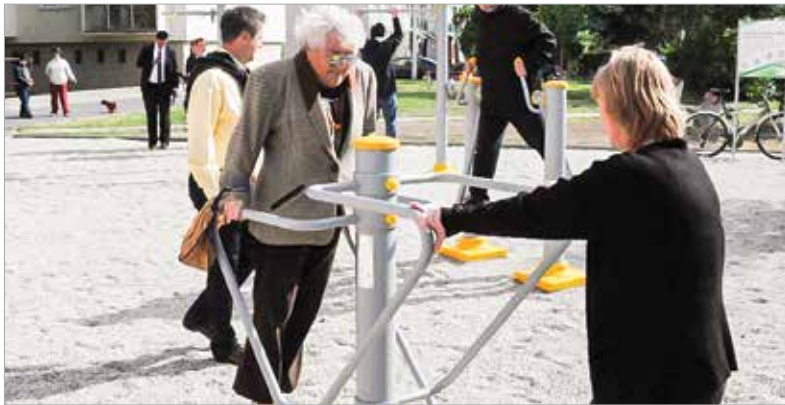
Az első fitnesspark átadása 2013 májusában

fehérváron minden feltétel adott. A Városgondnokság százhuszonegy játszótér, huszonnyolc fitnessjátszótér, hat kondipark és negyvenhárom sportpálya fenntartásáért és működtetéséért felel Székesfehérváron. Így tehát a hová egyáltalán nem lehet kérdés városunkban! Az elmúlt tíz évben ráadásul kimondottan sokat fejlődött a sportinfrastruktúra, hiszen amikor 2013 májusában átadták az első fitnessparkot