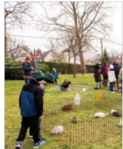
A nyuszikereső játék nem maradhatott ki