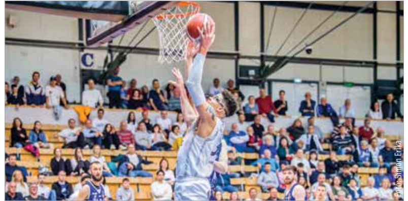
Ha nem is remekelt, de megszerezte a fontos győzelmet a rájátszás első meccsén az Alba

Kucsera egymaga hetet a meccsen – míg az Alba ebben a műfajban nem remekelt. Szünetben így a Kecskemét vezetett, de a harmadik negyedben megvillant valami a „régiből” fehérvári oldalon. Az első féldőben kosárra sem dobó Ford elkapta a fonalat, az Alba pedig rohanós játékkal megfordította a mérkőzést. Bár a negyedik játékrész megint nyugvanyelős volt, végül 89-82-re győzött a Fehérvár, ezzel 1-0-ra vezet a három győzelemig tartó párharcban. Szombaton Kecskeméten, kedden Fehérváron játszanak újra a csapatok.