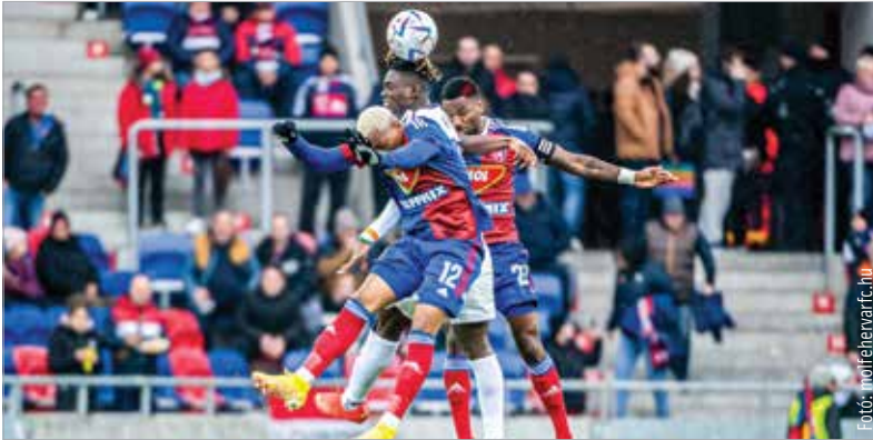
Küzdelem az volt a Fehérvár-Újpest meccsen, de élvezetes játék nem nagyon

A csapat idegenben nagyon rosszul teljesít a szezonban, vagyis nem nem tűnik biztatónak, hogy a következő három meccsből egy Kisvárdán, egy pedig Debrecenben lesz. Az edzőváltás óta tart a veretlenség, de a hátralévő hét fordulóban csak győzelmekkel távolodhatna el a veszélyes zónából a fehérvári klub!