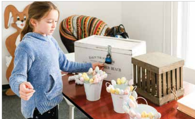
Tojásból sosem elég!