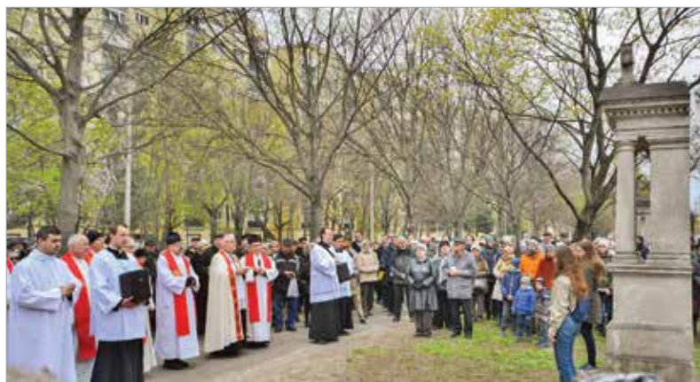
A város polgárai és papjai közösen emlékeztek Jézus kereszthalálára

egy-egy állomásait. A szabadban emelt keresztút tizennyházi stációs kápolnából vagy oszlopból áll, és a kálváriához vezet.