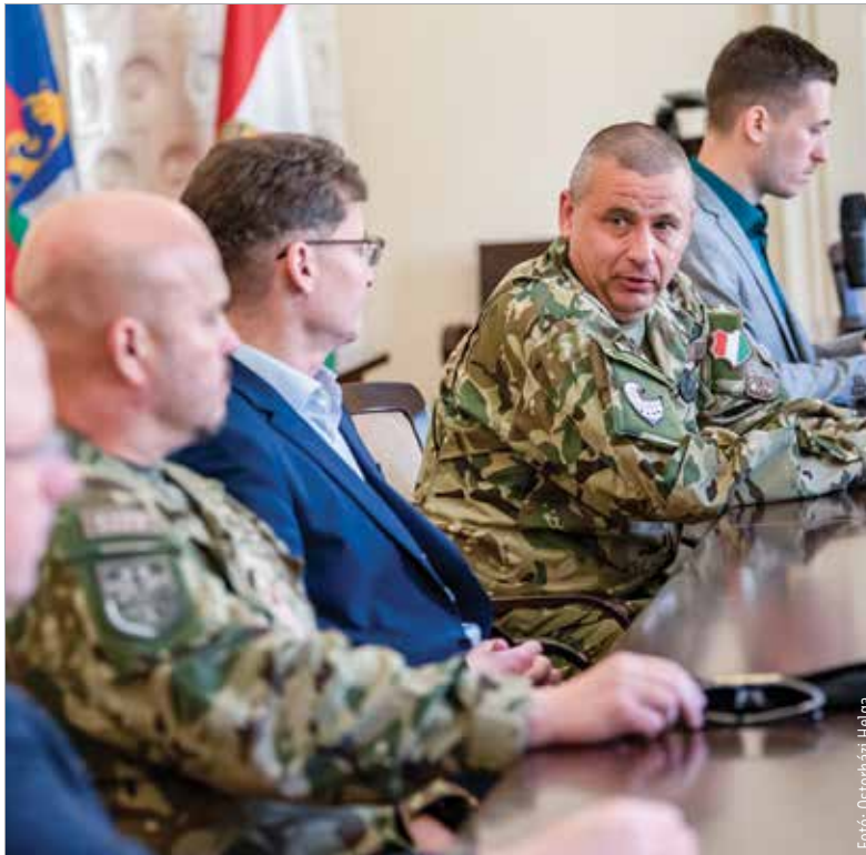
A Magyar Honvédség modernizációjáról, a haderőreform alakulásáról és a magyar katonák harci hatékonyságának növeléséről is szólt Ruszin-Szendi Romulusz vezérkari főnök fehérvári látogatásán

„Székesfehérvárnak megkerülhetetlen szerepe van a Magyar Honvédség életében. Nemcsak azért, mert itt van a szárazföldi parancsnokság és az összhaderőnemi műveleti központunk. A nemzeti szervezeteken kívül olyan NATO-szervezetek is itt székelnek, amelyek a kollektív védelem égíse alatt biztosítják Magyarországot számára azt a biztonságot, amit a Magyar Honvédséggel közösen katonai szempontból garantálni tudunk” – nyilatkozta Ruszin-Szendi Romulusz. Egy új Magyar Honvédséget épí-