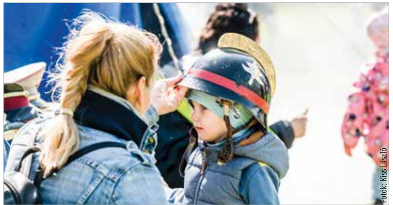
Tűzoltó leszel s katonal!