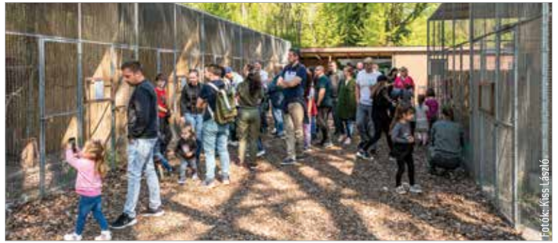
A központ komoly eszközparkkal rendelkezik, és sikerült tartalommal megtölteni a tereket