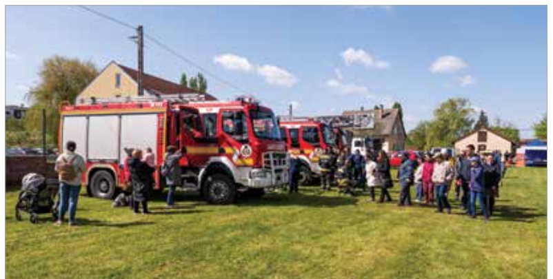
A tűzoltóautó örök sláger