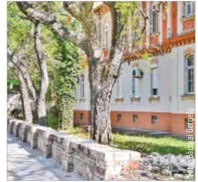
Éltveszélyessé vált a kerítés, le kellett bontani