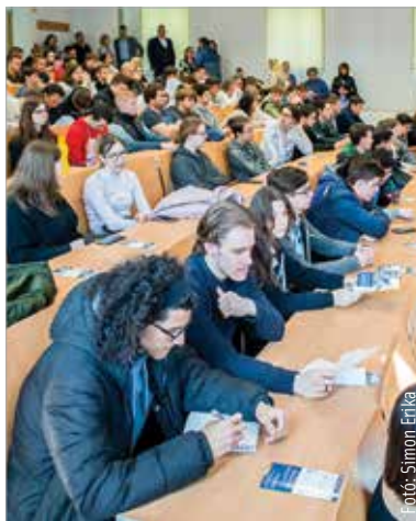
Leendő hallgatókkal telt meg a terem

A duális képzés előnye, hogy a hallgatók már az egyetemi évek alatt megszerzik azt a munkatapasztalatot, amit a hagyományos oktatásra jelentkezők csak a diploma után. Éppen ezért egyre népszerűbb ez a képzési forma az Obudai Egyetemen, ezen belül is a fehérvári székhelyű képzések, a város ugyanis évek óta zászlóshajója a piaci igényeket kiszolgáló modellnek – erről már az egyetem rektorhelyettese beszélt a Fehérvári Televízió híradójának: „A duális