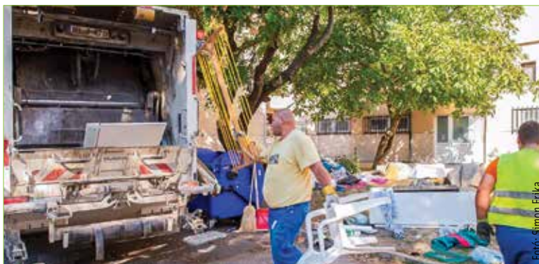
A lomtalanítás igénybevételének jogosságát ellenőrizni fogják

hulladék (pl.: nyílászáró, ablaküveg, padlószőnyeg, műpadló, mosdó- és wc-kagyló, csempe, stb.)