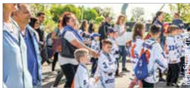
Idén a felvonuláson több mint kétezer sportoló vesz részt

Lesz sorverseny, melynek néhány éve nagy sikere volt: általános iskolások és a város ismert sportolói, sztárjátékosai