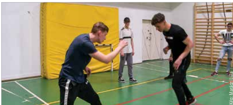
Üss vagy fuss! mottóval önvédelmi alapképzés indult a Székesfehérvári Szakképzési Centrum iskoláiban az iGenerációért Egyesület és a Cosmo Sport Fitness és Aerobic Központ támogatásával. A foglalkozásokat a szervezők minden fehérvári szakképző intézménybe elviszik. N. R.