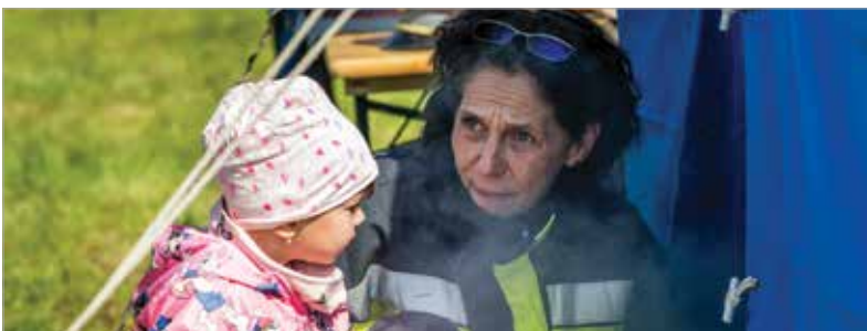
Azt is ki lehetett próbálni, mennyit látni egy füsttel telített helyiségben