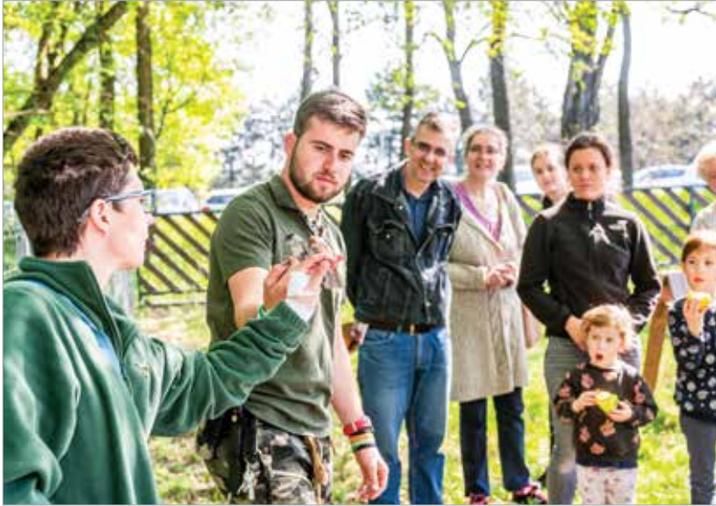
Amelyik madár képes az önálló életre, gyógyulás után visszaengedik a természetbe

Nyílt nappal ünnepelte egyéves születésnapját a Sóstó Vadvédelmi Központ. A múlt vasárnapi egész napos rendezvényen bemutatókkal, izgalmas előadással, játékos feladatokkal és szakvezetéssel is várták a látogatókat.