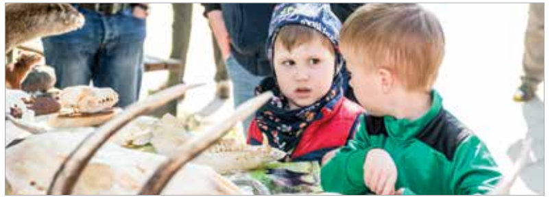
A gyógyítás mellett a szemléletformálásra is nagy hangsúlyt fektetnek az elhivatott szakemberek