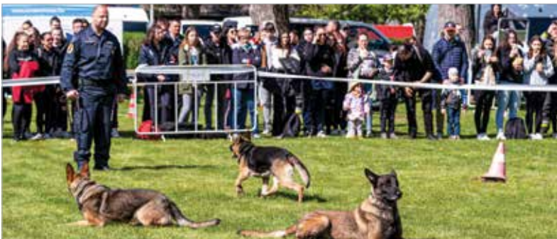
A kutyás bemutató során a rendőrök megmutatták, hogy nem érdemes elfutni igazoltatás során

Közös rendőr- és tűzoltónapi rendezvényt tartott a Fejér Vármegyei Rendőr-főkapitányság és a Fejér Vármegyei Katasztrófavédelmi Igazgatóság a Bregyó közti táborban. Lovas, kutyás és motoros rendőrök, közlekedésrendészet és balesetmegelőzés – a rendőrség számos szakterülete jelent meg a napon, és a tűzoltók is a vármegye több pontjáról érkeztek.