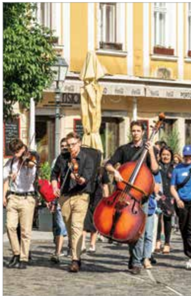
A rendezvény belvárosi sétával kezdődött, napközben pedig sokan bekapcsolódtak az egészségmegőrző, ismeretterjesztő programokba