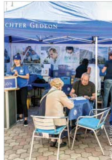
Több mint kétezer szűrést végeztek el. Közülük háromszáz esetben derült ki enyhe elváltozás, kétszáz esetben súlyos, további száz esetben pedig azonnali kezelést igénylő probléma.