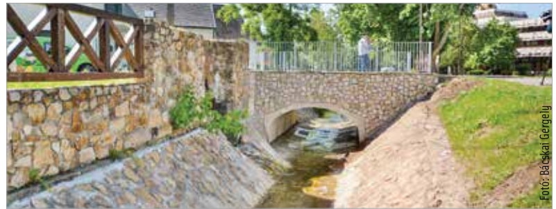
Impozáns látvány a Malom-csatorna felett átívelő híd