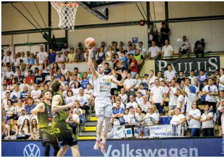
Vojvoda Dávid sokszor a mezőny fölé emelkedik

Kétszer nem lehet ugyanabba a folyóba lépni, tartja a mondás, amire a kosárlabdát résztvevői csak annyit felelnek: „Fogd meg a söröml!” A közéletű poén ezúttal arra vonatkozik, hogy nem tudott tanulni az Alba hibájából a Falco, vagy más szemzőből nézve: meg tudta ismételni a Szombathelyi bravúráját a Fehérvár. A döntő első mérkőzésén egy félidőt át oktattak az Alba idegenben, hogy aztán a harmadik és negyedik negyedben lenullázta szépen felépített előnyét. A címvédő bravúrosan fordított, majd eljött Fehérvárra, és pont ugyanúgy járt, mint ellenfele három nappal korábban. Az Alba Regia Sportszarnok közönsége talán lyukas garast sem adott volna a szünetben kedvenceik győzelméért, hiszen több mint húsz ponttal vezetett a vasi csapat. De most az Alba mutatott be feltámadást, öt perc alatt szinte eltüntette hátrányát, és elképesztő