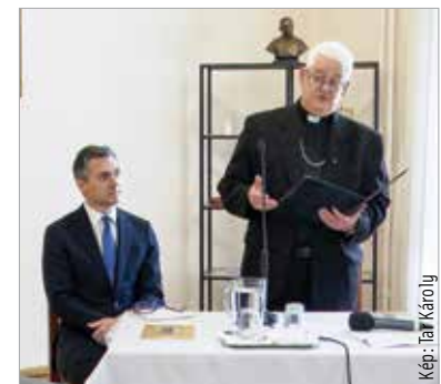
A kötet bemutatóján Spányi Antal megyés püspök is köszöntőt mondott

Ünnepélyes keretek között mutatták be a Szent István Hitoktatási és Művelődési Házban Varga Mátyás kötetét, mely megtörtént események alapján 1948-ba kalauzolja el az olvasókat: „A mű Szittay Dénes bakonykúti plébános és Shvoy Lajos székesfehérvári megyés püspök harcáról szól. A Shvoy Lajos ellen indult sajtóhadjárat volt a kutatás kiindulóponja, melynek oka az volt, hogy a püspök a kommunistákhoz közeledő Szittay Dénessel összetűzésbe került. A hadjárat akár a Mindszenty-per előfutárának is tekinthető, mindössze fél évvel előzi azt meg” – válaszolta a mű cselekményét a szerző. A kötetet Fejérdy András tudományos főmunkatárs, a Bölcsészettudományi Kutatóközpont Történettudományi Intézete igazgatóhelyettese mutatta be az érdeklődőknek. Kiemelte, hogy a szerző Pázmány Péter Katolikus Egyetemen benyújtott szakdolgozata volt a kötet előzménye: „Nagy öröm egy tanár számára, amikor szakdolgozatként olyan munka születik,