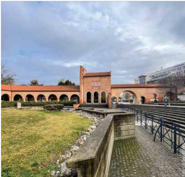
A cél közös: egy méltó emlékhely kialakítása

feltétele volt, hogy Székesfehérváron koronázzák meg a Szent Koronával, az esztergomi érsek által.” A miniszteri biztos felidézte, hogy 2014-ben úgy indult el az Árpád-ház kutatása, hogy bíborosi engedéllyel a Mátyás-templomban timent vehettek az ott elhelyezett tizenegy, királynak tartott csontvázból. Ezekből és III. Béla DNS-ének a segítségével ezután sikerült meghatározni az Árpádok férfitagjaira jellemző haploidot. Mostanra pedig már a Hunyadiak genomját is sikerült meghatározni, ami hamarosan várhatóan megtörténik a vegyes házi királyainkkal is. Kérdésünkre, miszerint lehet-e az a cél, hogy akit Fehérváron temettek el, az a koronázóvárosban kerüljön végső nyughelyére, Kásler Miklós kiemelte: alapvető emberi megközelítés, hogy valaki ott nyugodhassék az öröklétben és várhassa a feltámadást, ahol ő akarta. A Nemzeti Emlékhely éppen ezért nem lehet sehol másutt, csakis Székesfehérváron.