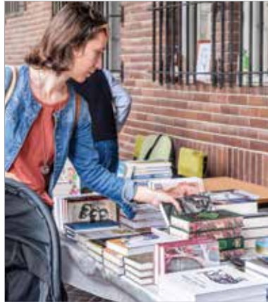
A Guttenberg-galaxis még mindig sokakat vonz