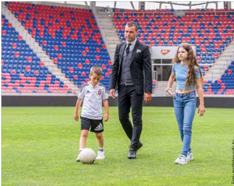
Gyermekeivel tett még egy utolsó sétát a sóstói gyepen a klubrekorder gólkirály

„Soha semmitől nem féltem a pályán, de féltem attól a pillanattól, amikor választanom kell a futball és a család között. Most eljött ez a pillanat. Volt időm átgondolni, hiszen az elmúlt egy évet a szeretteimtől távol töltöttem. Bár mindent a futballnak köszönhetek, és minden pillanataért hálás