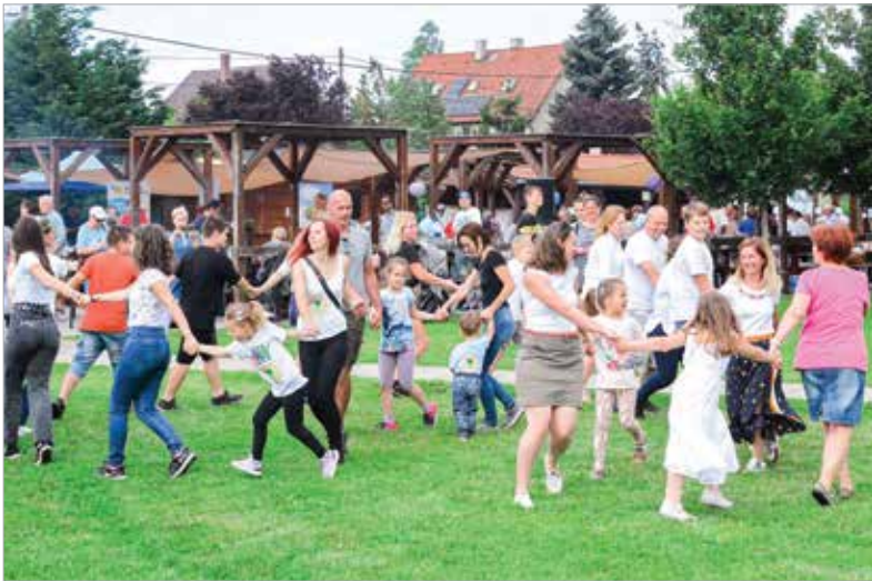
Körülöttük forog a világ!

Sokfajta zöldborsós ételkülönlegesség rotyogott a bográcsokban: összesen tizennégy csapat versenyzett egymással a különdíjakért és az értékes nyereményekért. A különleges finomságokat idén is szakavatott zsűri bírálta el. A délelőtt folyamán a borsó mellett a gyerekek álltak a középpontban, ugyanis hatodik alkalommal