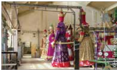
Az óriásbábok a Széphő Zrt. Király sori épületében pihennek, ha éppen nincsenek szolgálatban

A Tourinform Iroda által szervezett programon a látogatók megtekinthették a Király sori fűtőerőmű ipari műemlék jellegű épületét, megismerhették a különböző berendezések