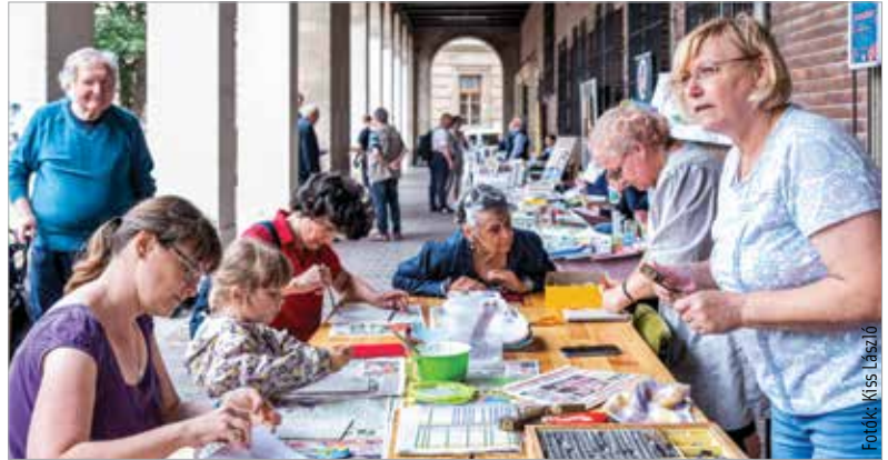
Izgalmas programokkal készültek a piknikre a szervezők