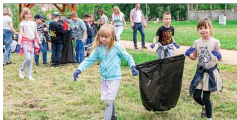
A szemétszedés az Önkéntesek hete keretében valósult meg. A cél az volt, hogy a gyerekek minél fiatalabb korban megtanulják, milyen tenni egymásért és a környezetért. CS. R.

Márkafüggetlen, teljes körű autójavítás.