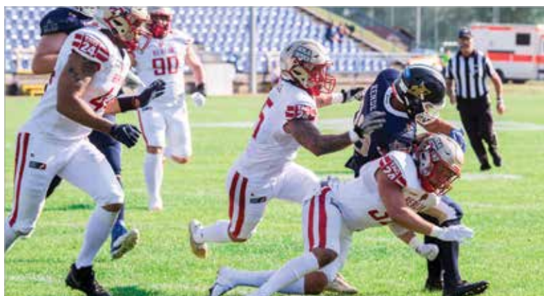
Túlerőben voltak a fehér mezés berliniek az ELF első fehérvári meccsén

Célba rugó és dekázóverseny, valamint foci minden mennyiségben – családi sportnapot szervezett a Videoton Baráti Kör Egyesület a Főnix Parkban. Összesen mintegy kétszázan, gyerekek, szülők közösen zárták az igencsak mozgalmas, parázs összecsapásokban gazdag fociszezon.