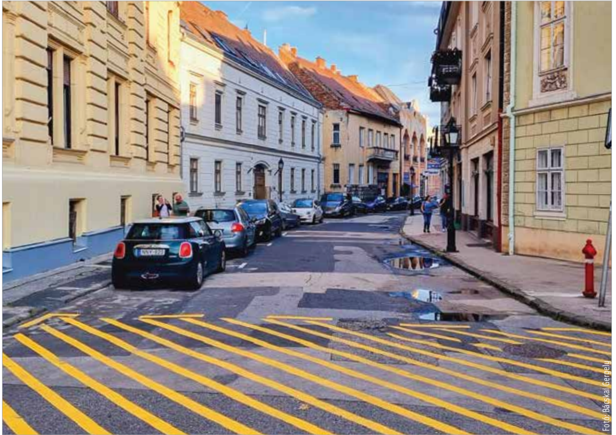
Július elsejétől a belváros környékén is elfogadják majd a történelmi belvárosba szóló lakossági parkolóberleteket