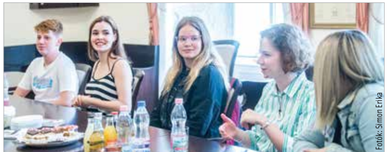
A döntősök minden diáktársukat buzdítják: vegyenek részt a Fehérvári Versünnepen, hiszen életre szóló élménnyel gazdagodhatnak!

lők, az osztálytársak azokra a gyerekekre, akik vették a bátorságot és elindultak. Lelkesek voltak, és az irodalom szeretete a nyilvános szerepléstől való félelmet is felülírta. Nagy öröm volt hallgatni őket!” A Versünnep következő állomása a Székelyföldi Varga Sándor Verstábor lesz július végén, ahol határon túli fiatalokkal is találkozhatnak a résztvevők. Ősszel pedig egy nagyszabású galát is szerveznek a versenyzőknek a Szent István Király Múzeum díszudvarán.