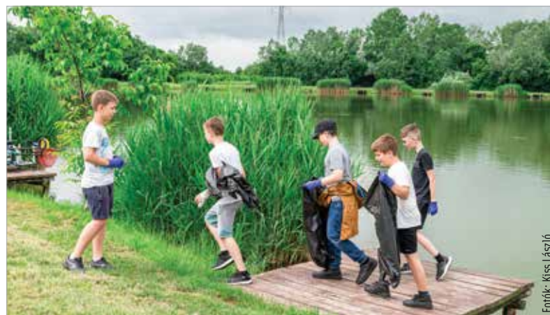
Szeméttől tisztították meg a palotavárosi tavak környékét az István Király Általános Iskola tanulói