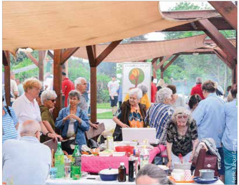
Nagy volt a sürgés-forgás, készültek a finomságok a gasztroudvarban

Velencei bentlakásos táborba, ahol sok mozgás, kultúra, kézműves-foglalkozás, kalandok, de még strandolás is vár a jelentkezőkre. A vakáció kezdetével elindul az országos Nyári diák munkaprogram is. Erre idén három és fél milliárd forint áll rendelkezésre. A 2013 óta futó kezdeményezés elsősorban bértámogatással ösztönzi a középiskolások, egyetemisták vakációs foglalkoztatását, ami segít abban is, hogy minél hamarabb munkatapasztalatot szerezzenek. A diákok június tizenötödikétől regisztrálhatnak a területileg illetékes járási hivatalok foglalkoztatási osztályainál, a támogatással elhelyezkedő fiatalok legkorábban július elsején állhatnak munkába. Az augusztus végéig tartó program részletei a Foglalkoztatási portálon olvashatók.