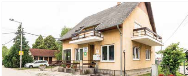
A Bregyó közti sportcentrum portáján érhető el az életmentő injekció

úti temetőben – adta hírül közösségi oldalán Cser-Palkovics András. „Tekintettel a nyári szezonra, amikor fokozott veszélye van többek között a rovarcsípés okozta allergiás rohamoknak, különösen fontos, hogy minél több helyen álljanak rendelkezésre ezek az injekciók. De bízom benne, hogy nem lesz rájuk szükség!” – hangsúlyozta a polgármester. A tavalyi évben már az összes székesfehérvári bölcsődebe, óvodába, általános, valamint középiskolába helyezték el az önkormányzat allergiás roham elleni injekciókat.