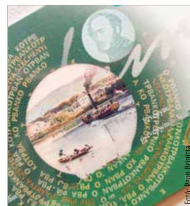
Egyre több mindenért fizethetünk SZÉP-kártyával

A gazdaságvédelmi akciótervbe illeszkedő döntésként a kormány arról is határozott, hogy lehetővé teszi a SZÉP-kártyák felhasználását hidegét vásárlására – mondta el a Miniszterelnökséget vezető miniszter. Augusztus elsejétől december harmincegyedikéig erre korlátlanul lesz lehetőség. Ezzel egyidejűleg azt is lehetővé teszik, hogy ebben az időszakban a munkáltatók a SZÉP-kártya keretét, amelynek maximális összege négyezerötvenezer forint, további kétszázézer forinttal megemeljék