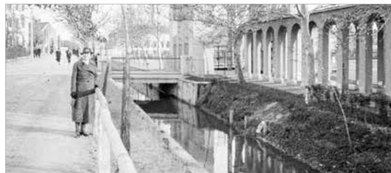
A még befedetlen Malom-csatorna a mai Szabadságharcos út és a Mátyás király körút találkozásánál