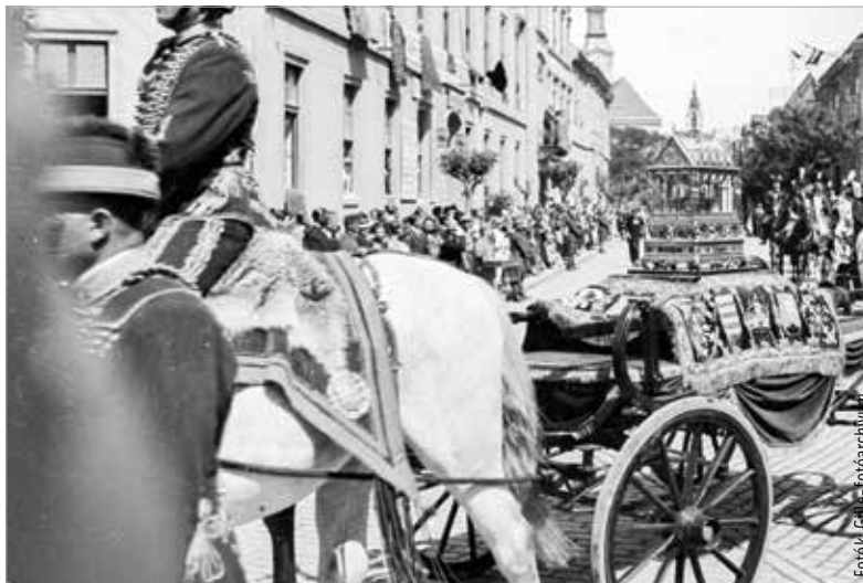
A Szent Jobb 1938-ban Székesfehérváron