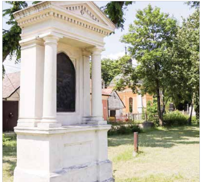
A stációk ma kiváló állapotban vannak

Szintén biztosra vehető, hogy a stációházakat a Havranek családi vállalkozás jegyezte. Kőfaragóként korábban már id. Havranek Antal (1829–1892) is dolgozott Székesfehérváron, de abban, hogy a kőfaragó dinasztia mely tagja a készítő, a források ellentmondanak egymásnak. A Havranek céget ifjabb Havranek Antal (1865–1917) alapította idősebb Havranek Lajossal (id. Havranek Antal öccse, 1848–1915). A legvalószínűbb verzió szerint az