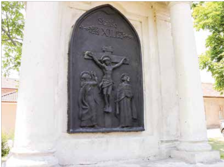
A tizenkettedik stáció: Jézus meghal a kereszten