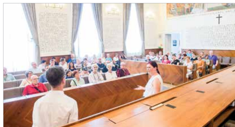
Szó esett arról, hogy a Városháza udvarán 1938-ban megtartott, kihelyezett országgyűlésen iktatták törvénybe augusztus huszadikát mint nemzeti ünnepet, és a Díszteremben látható az Aranybulla 1222-es kihirdetését megőrkítő falfestmény is, ami a mindenkori államvezetőnek a fehérvári törvénylátó napokat „előírja”. Emellett Aba-Novák Vilmos seccóját is megnézheték a résztvevők.

veterán járgányok töltötték meg a főteret, egyedi zseboragyűjteményt csodálhattunk meg, és a Helyőrségi Zenekar koncertje is színesítette a programot. Az élményekkel teli