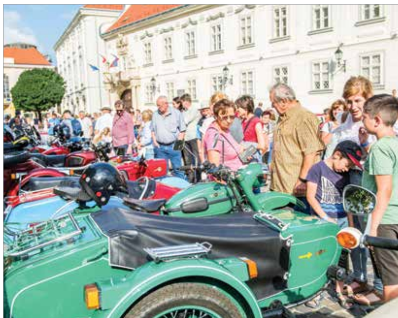
A járgányok minden korosztály körében népszerűnek bizonyultak...

meg a résztvevőket. Székesfehérváron is több mint száz programmal várták az érdeklődőket: különleges sétán vehettünk részt a Városházán,