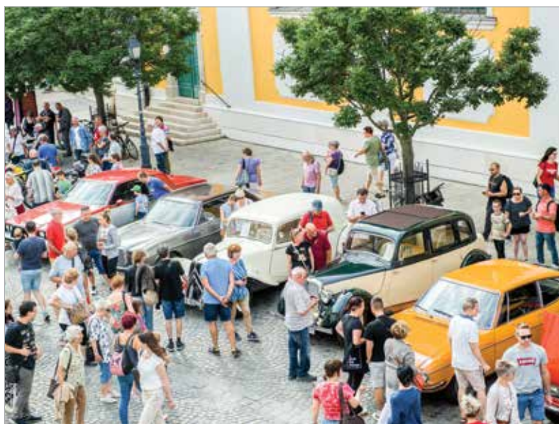
Különleges, veterán autókat és kétkerekű oldtimereket is megcsodálhattunk a belvárosban

A sok régi hagyományhoz immár több mint két évtizede csatlakozott a Múzeumok éjszakája elnevezésű országos programsorozat, mely számtalan élménnyel ajándékozza