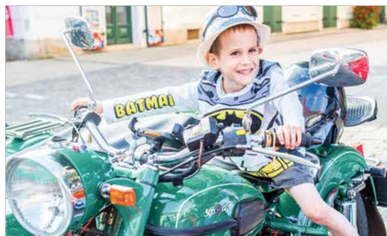
...némelyiket ki is próbálhatták a lelkes kíváncsiskodók

este jótékonyasági célt is szolgált: a belépőjegyet megváltók ugyanis az Ukrajnából menekült gyerekek székesfehérvári múzeumlátogatását támogatták.