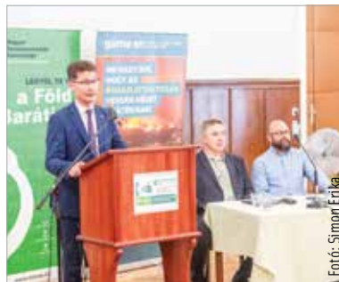
A megnyitóra egy igazán jó hírről érkezett a város polgármestere

Eger Ákos, a Magyar Természetvédők Szövetségének ügyvezető elnöke lapunk kérdésére elmondta: „Az összejövetelen szó esett például a Velencei-tó és vízgyűjtőterülete víziügyi kérdéseiről, az ökoszisztéma javításáról, a bevásárlóközösségekről, arról, hogyan tudjuk összekötni ezeket a csoportokat a mezőgazdasági termelőkkel. Beszéltünk a húsmintességről, az energiaközösségekről, a megújuló energiáról, de a közösségépítésről is, hiszen nagyon fontos, hogy a helyi közösségeinket újraépítsük!” Cser-Palkovics András polgármester a megnyitón egy jó hírről számolt be: „Az uszoda felújítása kapcsán a teljes naperőmű- és napelenrendszer kiépítésének finanszírozására megkaptuk