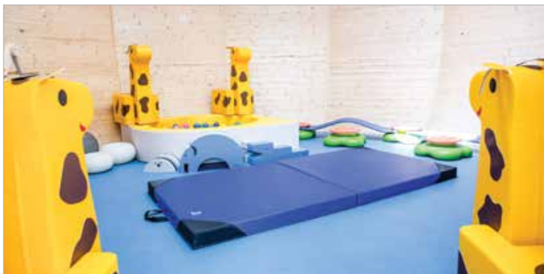
A barátságos terekben játékokkal, fejlesztőeszközökkel és sószoával is várják a gyerekeket

– a konyhát, az irodai és szociális blokkot, valamint a nevelési-gondozási egységeket – egy közlekedő folyosó köti össze. Három gömb formájú szoba is helyet kapott, ezek szószoaként, mozgásfejlesztő helyiségként, illetve előtérként szolgálnak majd szeptembertől. A normál főzőkonyha mellett kialakítottak egy olyan egységet is, ahol glutén- és laktózérzékenyeknek készülnek az ételek.