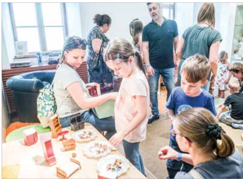
Népszerű volt a Hetedhét Játékmúzeum által meghirdetett múzeumpedagógiai foglalkozás is. Rózsa és Artúr új otthonában vendégeskedhettek a gyerekek, akik közösen rendezhették be a különleges babaház hat helyiségét.