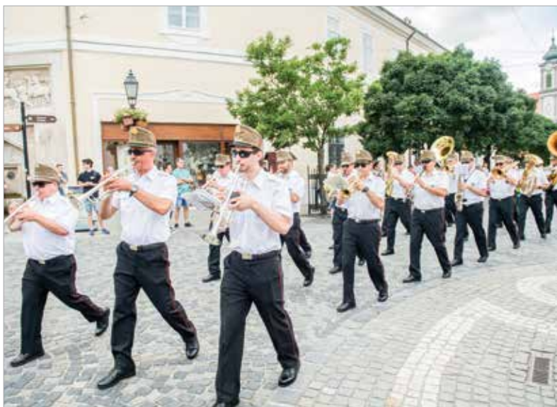
Voltak, akik zenei kísérettel sétálták végig a Fő utcát