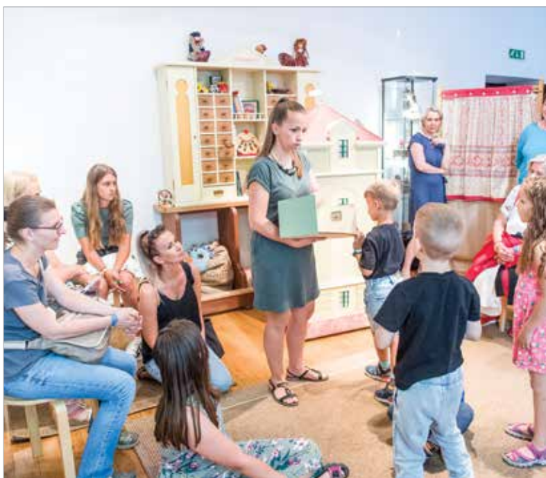
A Hiemer-házban található gyűjtemény gyönyörű és különleges minidarabjai évről évre megörvendeztetik a látogatókat