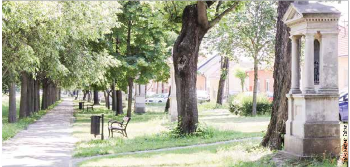
A költözéskor bővült tizennégyre a stációk száma

Maga a keresztút eredetileg az a nagyjából másfél kilométeres útvonal, melyen Jézus a kereszttel a Praetoriumtól (Gabbata) kiment a Golgotára. A magyar golgota elnevezés a héber gulgolet (koponya) szóból ered. A görög evangéliumi fordításokban kranion, a