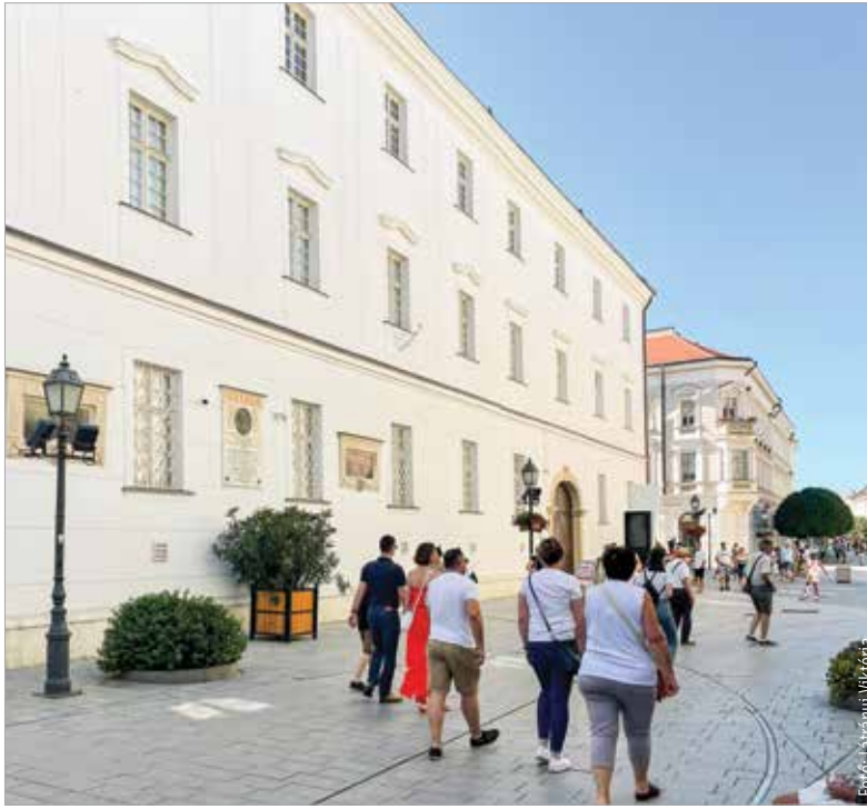
A Rendház épületében minden adott ahhoz, hogy nagyszabású kiállításoknak adjon otthont