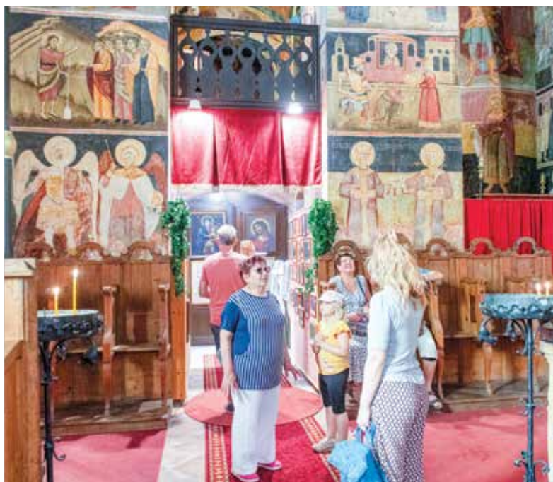
Minden évben népszerű helyszín a Rác utcai Szerb ortodox templom is