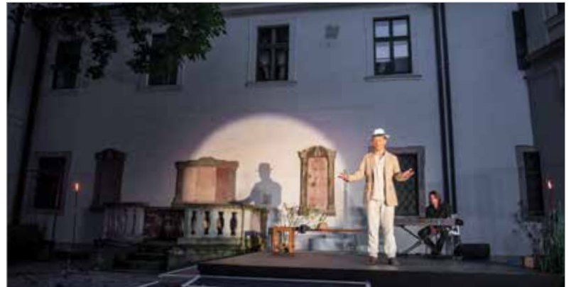
Új műfaj született, a régész színház. Schliemann kalandjain keresztül élhetik át a nézők Trója felfedezését.