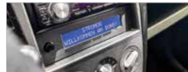
Külön üdvözlö a vezetőt a Stromos

De nem csak ehhez hasonló paripák gurulnak Fehérvár utcáin. A ma már egyre népszerűbb elektromos fémdobozok előfutáraiból is megfordul egy. Amiről ráadásul csak nagyon kevesen tudják, hogy villany hajtja, főleg, mert kívülről az egyik hazai gyártású kedvenc, a Suzuki Splash gúnyáját hordja. Azonban nem csak emiat egyedi a Stromos Move: ez az alig két-háromszáz darabból álló széria egyik legkülönlegesebb példánya, amiben még meghagyták a hagyományos kézi váltót. Az átalakítást végző cég mindössze az