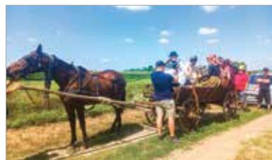
Egy másik forgatási helyszínen, Dinnyésen lovas szekérrel is filmezett a tábl

Különleges eseményre lehetnek figyelmesek a hétvégén a 62-es úton közlekedők, ugyanis filmforgatás zajlott a Börgöndpuszta melletti búzátáblában. A Haza! – Lantai Májor József szibériai hadifogolynaplója című film megalkotása Kovács Szilvia, a