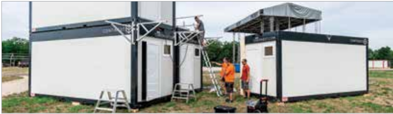
Ismét lesz lehetőség a FEZEN területén megszállni: a fesztivál külső parkolójából alakítanak ki egy hatszázhetven sátor befogadására alkalmas kempinget