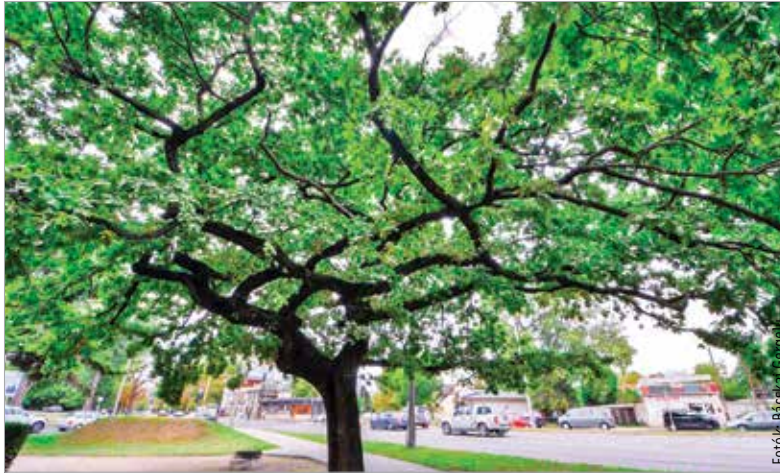
Székesfehérvár legidősebb fái több mint százévesek. A Haleszban, az 1848-as emlékmű és a Kossuth-cimer mellett áll a város legidősebb kocsányos tölgye.

A városban nyolcvanezer közterületi fa található, melyek fenntartása, gondozása folyamatos munkát jelent a szakembereknek. Székesfehérvár Városgondnokságán két faápoló szakmérnök is dolgozik. „Szerencsére olyan sok fa van Fehérváron, hogy nehéz minden egyedre figyelni, éppen ezért nagyon köszönjük a hibabejelentőnkön keresztül érkezett lakossági jelzéseket, hiszen a fényképes bejelentések nagyban segítik a munkánkat!” – emelte ki a viharok kapcsán Homoki László, a Városgondnokság parkfenntartási vezetője. Fehérváron a platánok és a tölgyek bírják a legjobban a városi környezetet, a kőrisek és a fűzfák pedig