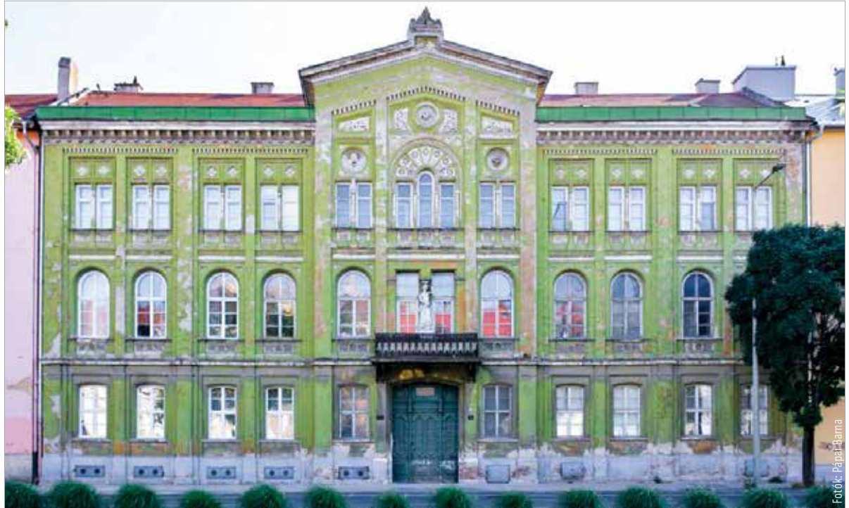
Az épületet valószínűleg Ybl Miklós tervezte

A Vörösmarty tér a régi épületek iránt rajongók számára kihagyhatatlan élmény. A különleges építészeti megoldások, érdekes vonalvezetések mellett a házak díszítőelemnek szánt műalkotásai is gyönyörűek és egyediek. A tér helyén korábban hosszú ideig majorság működött. A XIX. században a vár déli sarkának megnyitásával, valamint az áthaladó forgalom erősödésével szerepe felértékelődött. A tér forgalmának rendezése és első kialakítása az 1870-es évekre fejeződött be, a tér közepén ekkor egy liget állt. Évtizedekkel később a forgalom erősödése miatt változtatni kellett ezen az állapoton. A Vörösmarty-szobor és a 69-es gyalogezred Bory Jenő által készített emlékművének átköltöztetése után alakult ki a végleges állapot. A Vörösmarty tér 5. alatti ház valamikor 1860 körül épült, csakúgy, mint a tér házainak nagy