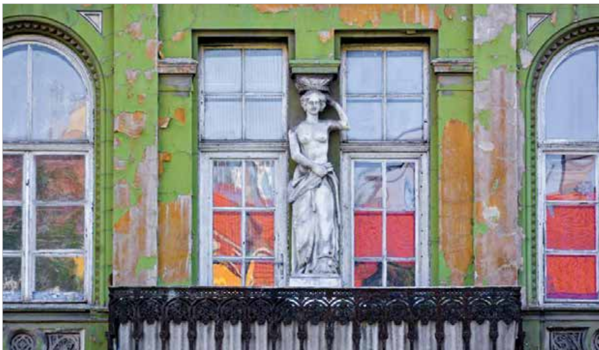
A kariatida erkély- vagy párkányhordozó nőalak az ókori görög építészetben

A fenti sorok gyakorlatilag arra is megadják a választ, mi is az a kariatida: oszlop helyett alkalmazott nőalak, erkély- vagy párkányhordozó az ókori görög építészetben. Leginkább a jón oszlopokat helyettesítette, legszebb antik példája az athéni Erekhtheion oszlopcsarnoka az Akropoliszon. A fehérvári nőalak keletkezése szinte biztosan a ház építésével egyezik meg, valamikor 1860 körül készülhetett. A művész személye sajnos ismeretlen, ennek ellenére elismeréssel adózunk neki, hiszen egy, a város utcaképéhez százhatvan esztendeje hozzátartozó alkotással gazdagította Székesfehérvár műtárgyainak sorát!