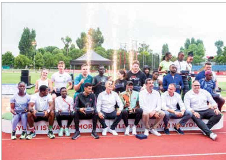
Ismét nagy siker volt a székesfehérvári verseny!