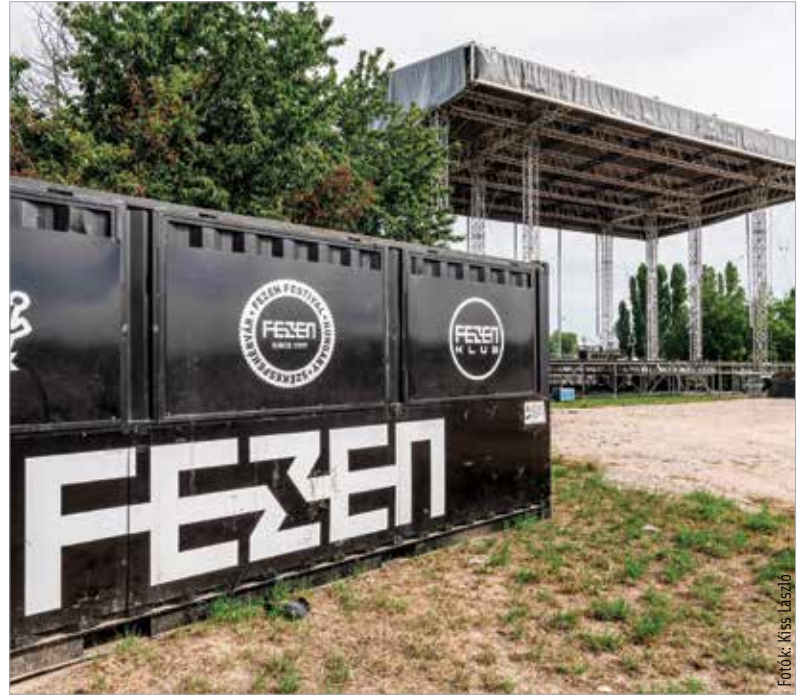
Idén is érkeznek híres külföldi előadók, zenekarok, és a magyar zenei élet krémje is megmutatja magát a fesztiválon