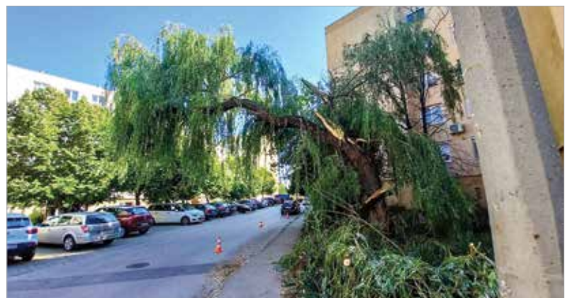
Nemrég a Sziget utca 35. előtt életveszélyes állapota miatt kellett kivágni egy fűzfát