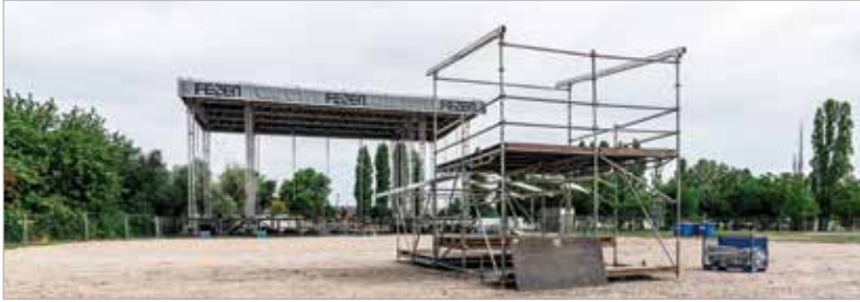
A FEZEN négy napon keresztül közel száz produkciót kínál a közönségnek négy színpadon

Bár a fesztiválynitástig még van pár nap, az élet már elindult a FEZEN fesztivál területén: elkezdődött a színpadok építése és a helyszín kialakítása. A visszaszámlálás elindult, mindjárt itt van július huszonhatodika!