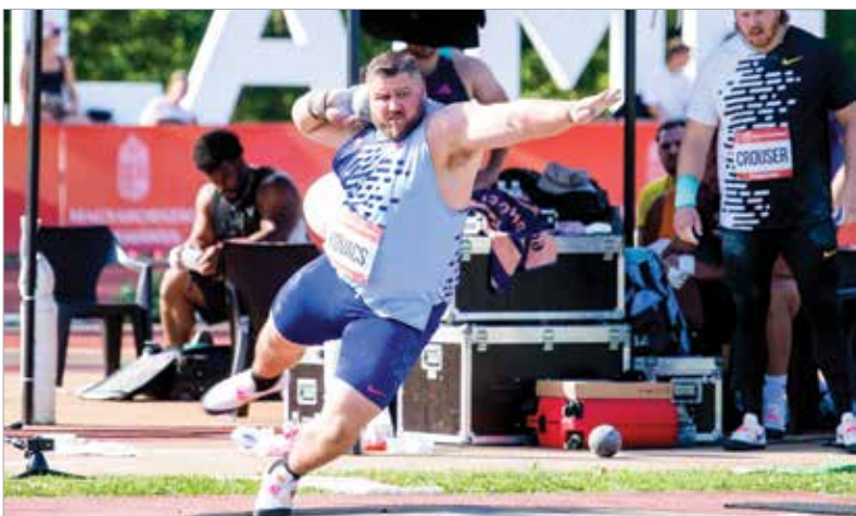
A férfi súlylökésben a Gyulai Memorial versenycsúcsát tartó, magyar származású Joe Kovacs idén a második helyen zárt Ryan Crouser mögött