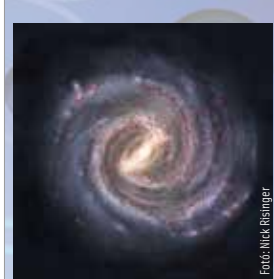
2023. július 20-26.

Hivatásod területén feszültebb, de egyben pezsgőbb is lesz a helyzet, mint általában. Nagy szükség lesz a tervezőképesedre. Ne hagyj, hogy mások türelmetlensége vagy túlzott optimizmusa tévútra vezessen! Saját intelligenciád és gyakorlati érzéked meghozza a kívánt eredményt.