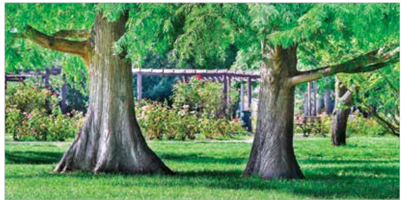
Mocsári ciprusok a Rózsaliigetben

zösségi oldalain egy-egy balesetveszélyes fa kivágásakor gyakran kapnak hideget-meleget, ám a városi környezetben mindennél fontosabb szempont, hogy ne