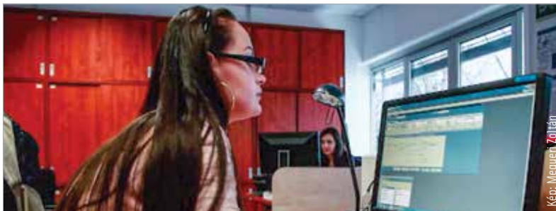
Diákmunkát vállalni már tizenhat éves kortól lehet