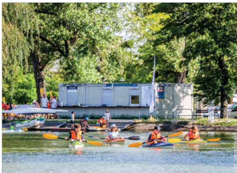
Várják azokat a gyerekeket is, akik a versenyzést is kipróbálnák!

elnöke elmondta, hogy az összes hajót igénybe vehetik a székesfehérvári iskolák és a máshonnan érkező, maximum húszfős csoportok, előzetes egyeztetés alapján. Ehhez időpontot kell kérniük a vitalclub@vitalclub.hu e-mail-címen. Szipola Antal hozzátette, hogy a nagyközönségnek szóló szabadidős tevékenységek mellett folyamatosan, a hét minden napján zajlanak a versenysporttal kapcsolatos foglalkozások, amire várják azokat a gyerekeket, akik szívesen kipróbálnák magukat, és akár versenyeznének is!