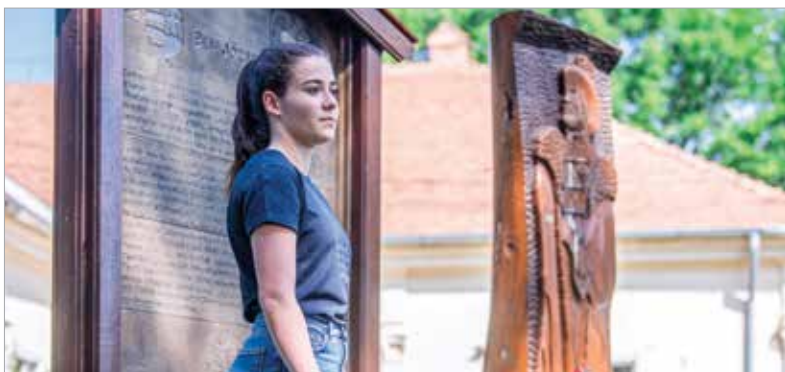
A fiatalok Székelykeresztúrra és Fehéregyházára is ellátogattak

Az öt napos, ingyenes táborban a diákoknak ebédet biztosítanak a szervezők. Érdemes minél előbb jelentkezni, hiszen gyorsan fogynak a helyek. A regisztrációt augusztus másodiká délig lehet megtenni a vmk.hu oldalon elérhető kérdőíven.