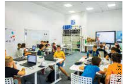
Az Alba Innovár nyári táborai és okoseszközei mindig népszerűek a fiatalok körében

gítésével csapatban tudnak majd társasjátékokat készíteni.