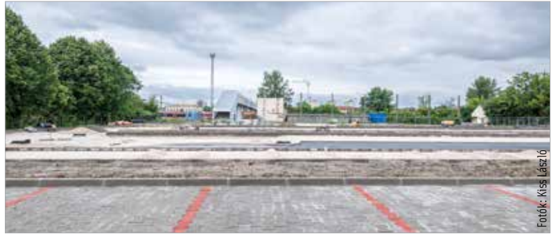
Az alapozás és a szegélyek már jól állnak