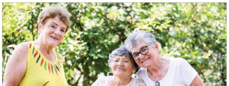
A kortárs látogató elintéz kisebb dolgokat, segít a bevásárlásban, de talán a legfontosabb, hogy beszélgetőpartner tud lenni