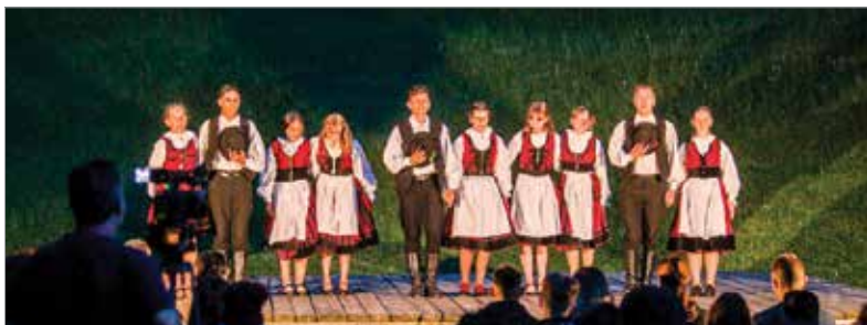
A nyitó gálán színpadra léptek a Hargita Néptáncgyűttes és a Csíksomortáni Magyarok Nagyasszonya néptáncsoport fiataljai