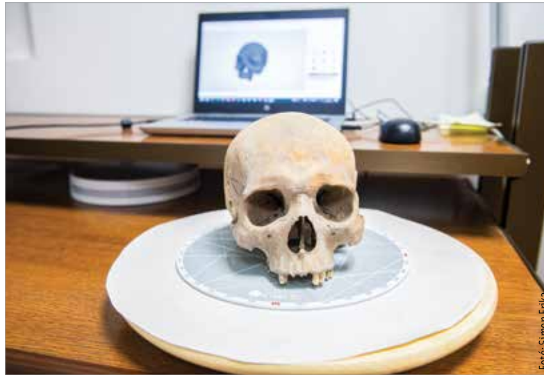
A székesfehérvári Osszáriumból elvitt csontanyag 3D-s digitalizálása is megtörtént egyes esetekben

„Az apa-fiú genetikai kapcsolatot klasszikus STR-módszerekkel és teljes genom adatokkal is megerősítették. A genomadatokból PCA-analízist, Un-supervised Admixture és f3-outgroup vizsgálatot végeztek el.” – számolt be a kutatás részleteiről Kásler Miklós. A bejegyzésből az is kiderült, hogy minden genomanalízis rámutatott arra, a Corvinok ősi európai genom összetételűek, azaz legmagasabb genetikai hasonlóságot az európai neolitik mintákkal (mely népek szintén a Kárpát-medencéből eredeztethetőek) és az ősi magyarországi neolitik és rézkori mintákkal mutattak, úgy, mint a Kőrös kultúrából (Kr.e. 6000-5500), az Alföldi Vonalászes Kerámia Kultúrából (Kr.e. 5500-5000), a dunántúli Lengyel-kultúrából (Kr.e. 5000-4400) vagy a Bodrogrkeresz-