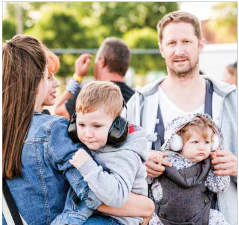
Igazi családi program is lehet – persze csak óvatosan

A FEZEN Fesztivál miatt július harmincadikán, vasárnap délig zárva lesz az Új Váralja sor az A3 jelű út és a Takarodó út közötti szakaszon. Az A3 jelű út egyirányú lesz az Új Váralja sor felől a déli összekötő út felé. Az Új Váralja soron az Arok utcától az A3 jelű útig, a Takarodó úton és az A3 jelű úton tilos a megállás mind az úton, mind a padkán, valamint 30 km/h-s sebességkorlátozást vezetnek be. A Waze-ben egyébként a fenti lezárások és a fesztivál parkolója, mint kiválasztható úticél is megtalálhatóak lesznek.