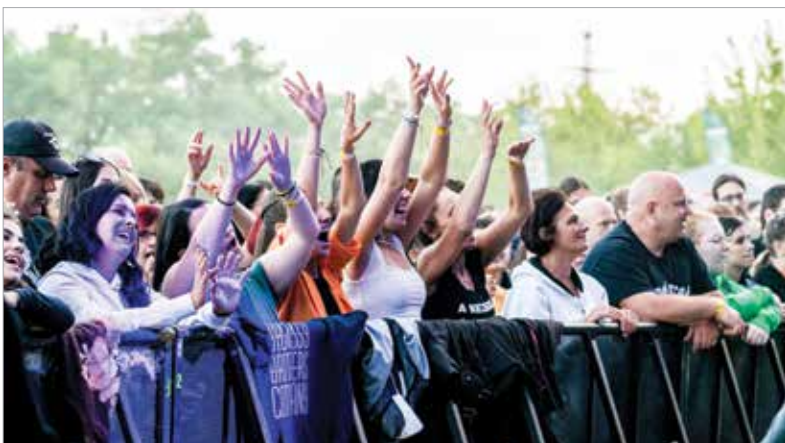
Óriási bulik, partihangulat, jó társaság