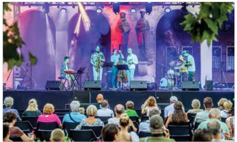
A Bartók Béla tér minden évben megtelik a dzsesszkedvelőknek köszönhetően