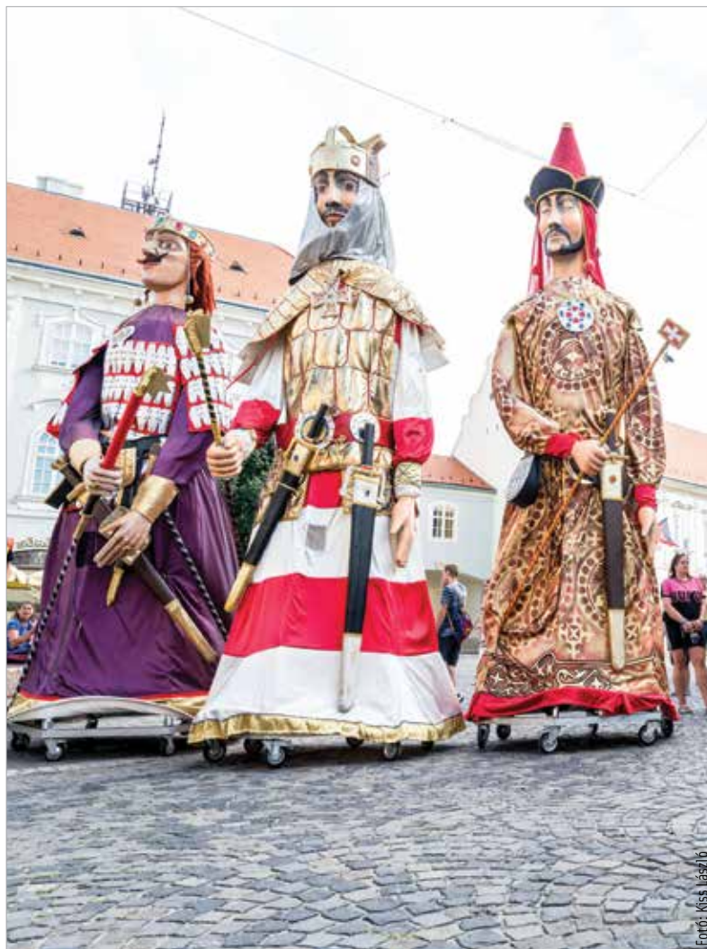
Legutóbb Álmos herceg, II. István és II. (Vak) Béla király vonult végig a Fő utcán