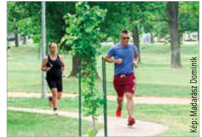
Megfelelő hidratálás és kiegyensúlyozott táplálkozás mellett nyáron is nyugodtan sportolhatunk