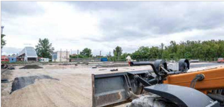
A déli városrészekről könnyebb lesz megközelíteni a vasútállomást, hiszen nem kell majd forgalmas csomópontokon keresztül eljutni a Béke térre

adta hírül közösségi oldalán Székesfehérvár polgármestere. A déli összekötőről is elérhető parkolóra azért is van nagy szükség, mert így a déli városrészekről a Mártírok, a Széchenyi, a Horvát István, Prohászka utak érintése nélkül elérhető lesz a vasút, ezzel tehermentesítve mind a környéki csomópontokat, mind az állomás mostani parkolóit.