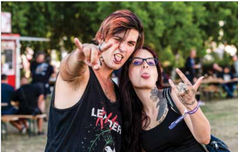
Pop, rock, metál, elektronikus műfajok – itt mindenki megtalálja a maga stílusát