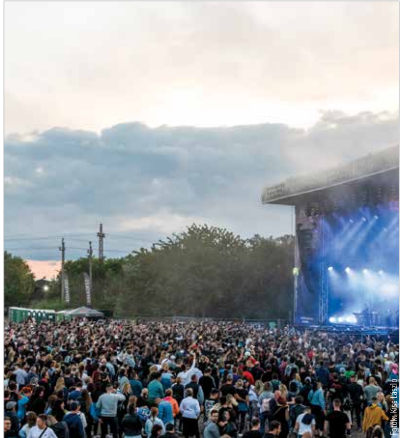
A Bagossy Brothers Company tömegeket vonzott a fesztivál első napjára