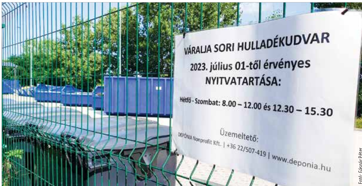
Az új hulladékudvar az Új Váralja soron érhető el

A hulladékfajták közül korlátlan mennyiségben adható le a papír, karton, fémek, műanyagok, vegyes és üveg csomagolási hulladék, fa, étolaj, sütőzsír, elemek, akkumulátorok, olyan kiselejteztett elektromos és elektronikus berendezések, amelyek nem tartalmaznak veszélyes anyagot. Korlátozott mennyiségben veszik át a kiürült festékes dobozokat, az olajos flakonokat, a hajtógáz palackokat, gumibroncsot, fáradt olajat, veszélyes és nem veszélyes festék-hulladékot, veszélyes anyagokat tartalmazó, kiselejteztett elektromos és elektronikus berendezéseket, napelemeket. A hulladékgyűjtő udvarok bármelyikében a lakosok magyarországi laccím-kártya, tartózkodási engedély/kártya, hatósági bizonyítvány, regisztrációs igazolás, vagy bejelentőlap valamelyikének bemutatását követően tudják a hulladékokat leadni. A Közép-Duna Vidéke Hulladék-