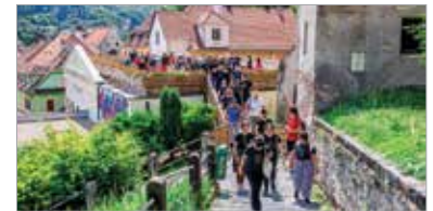
Petőfi nyomában címmel egész napos kiránduláson ismerkedhettek meg a táborlakók a költő tragikus halálának történetével

A Fehérvári Versünnap a Fehérvár Média centrum társadalmi felelősségvállalási programjának fontos alappillére, melyet a város önkormányzatával, a Székesfehérvári Egyházmegyével, valamint a Szent István Hitoktatási és Művelődési Házzal együttműködésben idén 13. alkalommal szerveztek meg. A tavaszi döntő minden versmondója részvételt nyert a héten zajló Székelyföldi Varga Sándor Verstabornak.