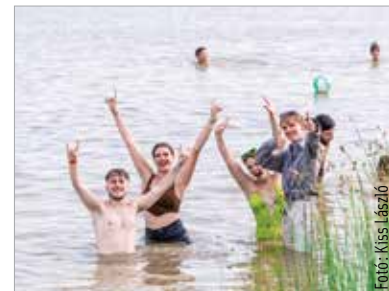
Nyugodtan csobbanhatunk a Velencei-tóban!

Az üzemeltetők által megbízott laboratóriumok a fürdővizet az idegy megkezdése előtt, majd a szezon ideje alatt havonta ellenőrzik. A mintákban a szennyvíz eredetű szennyezést jelző baktériumok számát vizsgálják. Attól függően pedig, hogy ezek a vizsgált baktériumok milyen mennyiségben vannak jelen, az adott vízminta a „megfelelő” vagy a „nem megfelelő” kategóriába sorolható. Az éves értékelés a legutolsó négy fürdősi idegy összesített eredményei alapján készül el, a fürdővizet „kiváló”, „jó”, „tűrhető” vagy „kifogásolt”