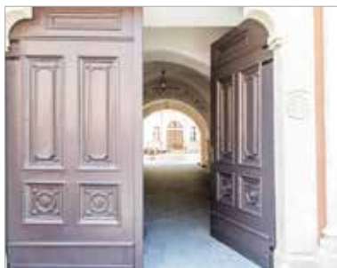
A bejárat nagykaput először darabjaira szedték a restauráláshoz