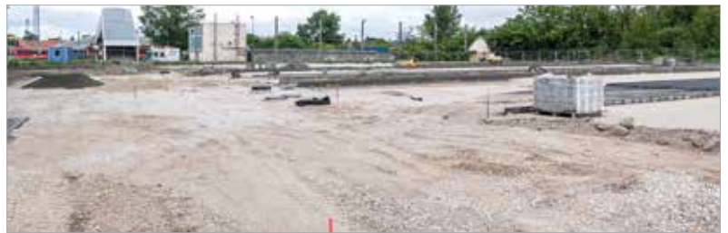
A P+R parkolók a városok külterületén, valamilyen tömegközlekedés közelében találhatóak, és arra szolgálnak, hogy az ingázók ott leparkoljanak, és onnantól a tömegközlekedést vegyék igénybe