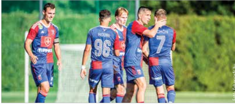
Gólörömbben gazdag új szezonban bízunk, de nem lesz könnyű dolga a Vidinek

Hogy mikor múltak el a szép idők, már történelmi kérdés, de tény, még Mol Fehérvár néven is a kiesés ellen küzdött az elmúlt idényben a fehérvári focicsapat. Volt ilyenre példa a történelemben, de az utóbbi tizenhárom évben a bajnoki címért, nemzetközi kupaszereplésért folytatott harchoz szokott hozzá a közönség Sóstón, így nehezen ment az „átállás” a szurkolóknak. Márpedig a szombaton kezdődő 2023/24-es szezon előtt úgy tűnik, a klubtulajdonos és szakmai vezetés inkább óvatos, az élmezőnybe kerülést nem is említve fogalmazza meg a célokat. A csapat immár „moltalan”, Fehérvár FC néven szerepel, egyes információk szerint a korábbi költségvetés harminc százalékkal gazdálkodva. Ezzel a realitással a vezetőedző, Bartosz Grzelak is tisztában van. „Mondhatni olyan volt ez az időszak,