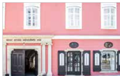
A Belváros felőli homlokzat már megújult, ami sokak tetszését elnyerte

A Szent István Hitoktatási és Művelődési Ház kiemelt műemléki védelem alatt álló épület, amely meghatározza a Belváros utcai látképet. Székesfehérvár egyik legnagyobb közművelődési intézményének a felújítása éppen ezért hosszú ideig elhúzódott, hiszen egymásra épülő, nagyon összetett munkafolyama-