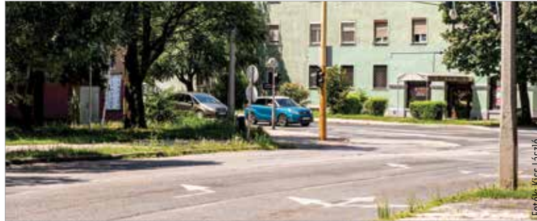
Célszerű rögtön a belső sávba kanyarodni, amikor a Horvát István utcából a Prohászka fordulunk

A másik hasonló helyszín, amikor a Gáz utcából haladunk a vasútállomás felé, a Lövölde irányába. Itt egy indítósváv van, viszont a túloldalon már kettő. Itt régen volt felfestés,