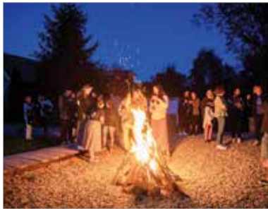
A nyitóest hagyományos tábortűzzel zárult

Megnyitotta kapuit hétvégén a XI. Székelyföldi Varga Sándor Verstabornak Csíksomortánban, ahol ismét az irodalom, a versek és a kultúra iránt érdeklődő fehérvári és határon túli fiatalok töltenek el együtt tíz napot. Székesfehérvár Önkormányzata is támogatja a programot, ahol székelyföldi, felvidéki, délvidéki, kárpátaljai és az anyaországból érkezett fiatalok, köztük a Fehérvári Versünnap döntősei mélyíthetik el tudásukat a Petőfi Emlékévben, amelynek hívógondolata: Szabadság, szerelem.