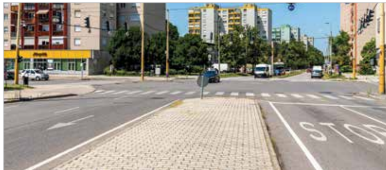
A Lövöldén két sáv fogadja a Gáz utca felől érkezőket

emelkedőnek áll az autó. Ha látja, hogy nem jön semmi, elengedi a féket, az autó természetesen megindul hátrafelé, majd megijed, rálép a fékre, de közben felengette a kuplungot, ettől meg lefullad. Akkor pedig jön az indítózás. Egy kezdő vezetőnek ez nagyon összetett feladat. ” Aztán, ha ugyanitt megyünk tovább, jön egy lámpás kereszteződés a Géza utca-Kadocsa utca találkozásánál. Telezöldes lámpa mellett, ha balra nagy ívben szeretnénk fordulni, ott mindenképpen azt kell mérlegelni,