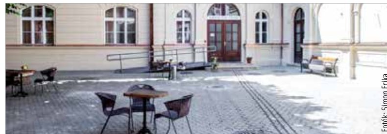
A belső udvarban majdnem teljesen levették a vakolatot, hogy biztosítsák a kiszáradást

tus kapu nagyon nehéz, így visszahelyezéséhez nyolc- tíz ember összehangolt munkájára volt szükség. Harmadik, egyben utolsó fázisként felújítják az épület Mátyás király körút felőli részét, melyet már fel is állványoztak. A hátsó homlokzat falai ki vannak téve az erős napfénynek, az esőnek egyaránt, így bőven lesz mit renoválni. Emellett időtálló módon javítani kell a négy teraszajtó külső burkolatát, és meg kell oldani a négy hatalmas ablakportál nyithatóságát is, hogy a jövőben biztosítani tudják az épület szellőzését.