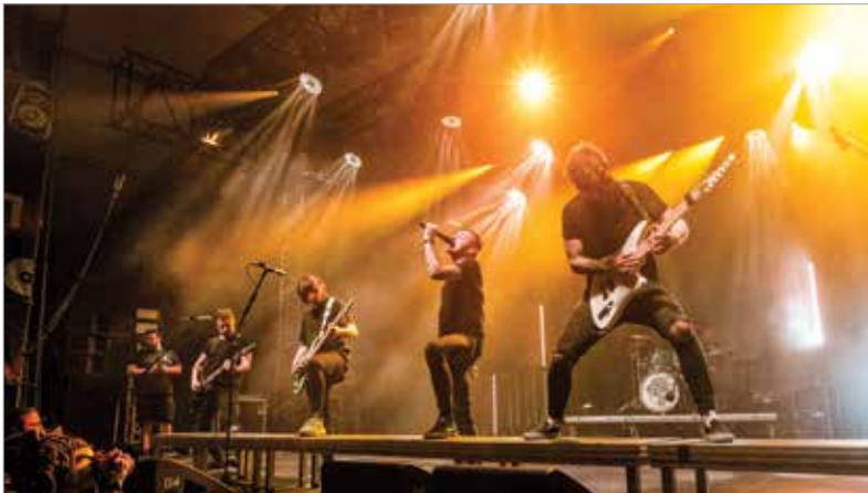
Az AWS sem spórolt, mindent beleadtak a fiúk

közlekedéssel és személygépkocsival egyaránt könnyen megközelíthető, az autósok számára pedig az Új Váralja soron biztosítják a parkolást. Aki nem szeretne minden nap utazni, azoknak ismét biztosított a helyszínen a pihenési lehetőség: 600 férőhelyes kemping várja a megfáradt bulizókat.