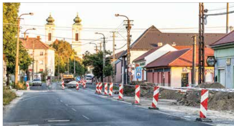
A Móri útról nem lehet behajtani a Szent Vendel utcába, a Malom utca irányából pedig zsákutcaként működik

közlekedjenek ezen a környéken, illetve használják az útvonaltervező alkalmazást.