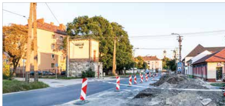
Az épülő körforgalom komoly torlódásokról mentesítheti a csomópontot

Megállási korlátozást vezettek be a Móri úton az Irányi Dániel utca és a Szent Vendel utca közötti