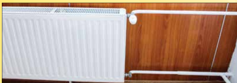
A fűtés elindításához elengedhetetlen, hogy a házakban folyó átalakítások, felújítások, radiátorcserék mielőbb befejeződjenek!

ezirányú igényüket a társasházak közös képviselőinek, a lakásszövetkezeteknek vagy a fűtési megbízottaknak jelezhetik, akik az erre kialakított internetes ügyfélszolgálati felületen tudják elküldeni fűtésindítási kérésüket a távhőszolgáltatóknak. Ha a ház rendszere üzemkés, a bejelentést követően rövid időn belül már melegek lehetnek a radiátorok.