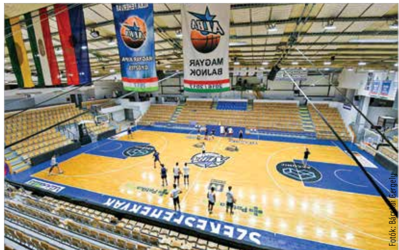
Az önkormányzat és a klub közösen dolgozik a csarnok felújításán

Az energetikai korszerűsítések mellett az első ütemben felújították az épületben lévő öt apartmant, a vizesblokkokat és az egészségügyi szobát is