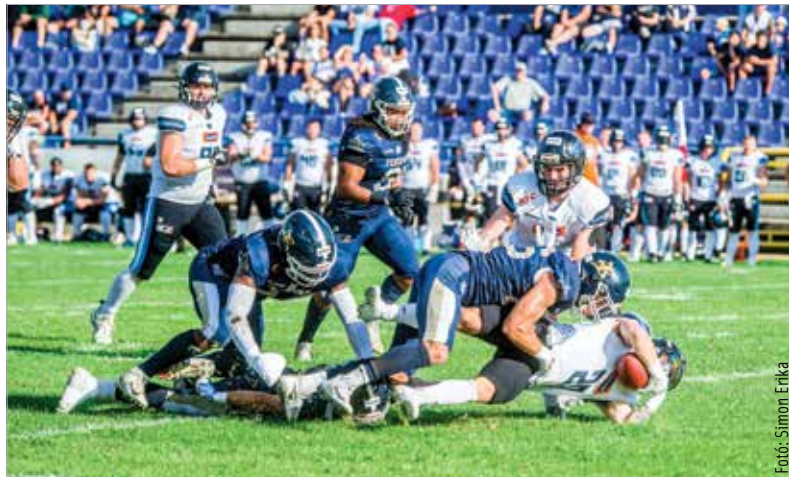
A kékezes fehérvári védelem többször meg tudta állítani a lengyel támadókat

A szezon fénypontjának mindenképpen a Prága elleni győzelem számít, ami akkora lökést adott, hogy a következő héten a regnáló veretlen bajnokot, a Vienna Vikings csapatát is majdnem sikerült legyőzni. Ez mutatja, hogy a csapatnak van keresnivalója az ELF-ben. Jó felkészüléssel és igazolásokkal a szurkolók joggal bízhatnak egy erősebb Enthronersben 2024-ben.