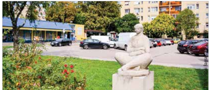
Az Ülő nő 1965 óta az Eszperantó téren figyeli a város forgalmát

Gádor Magdának összesen tizenöt köztéri alkotását tartják számon hazánkban. Egy-egy alkotása Szlovákiában, Németországban és az Alaszakai Nemzeti Parkban is megtalálható. A sorban az első az 1961-ben a fővárosban felavatott Ülő fiú névre keresztelt ivókut volt. Érdekes, hogy első három köztéri alkotása ülő alakot formál: az 1961-es, budapesti Ülő fiú után