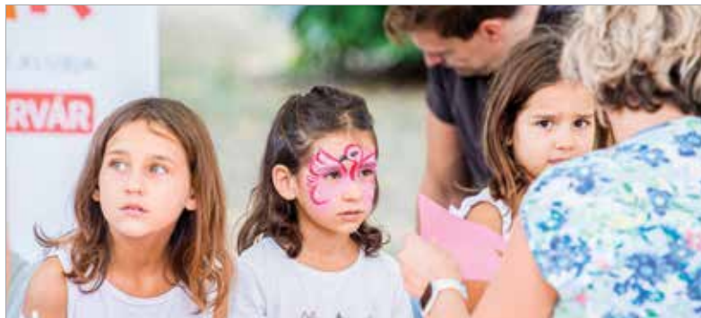
A Fiatal Családok Klubja arcfestéssel és kézműves-foglalkozással várta a kisebbeket

Az alpolgármester hozzátette: „Reményeim szerint több mint nyolcmillió forint lesz az a keretösszeg, amire a város civilszervezetei pályázhatnak, hogy a működésüket segíthesse az önkormányzat.”