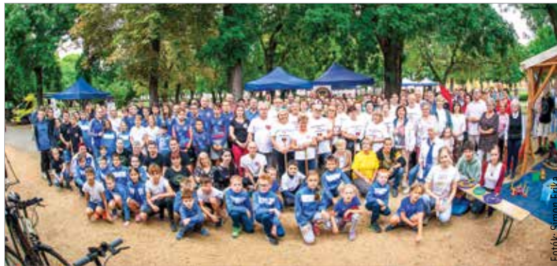
A hétfvégén több mint hetven civilszervezet mutatkozott be a Zichy ligetben, melyek többek között az egészségügy, a kultúra, a sport, a családügy, a nyugdíjasügyek és az állatvédelem területén tevékenykednek

Duplájára emelné az önkormányzat a karitatív és szociális civilszervezetek támogatását. A Cser-Palkovics András által jegyzett előterjesztés azt is tartalmazza, hogy több mint nyolcmillió forinttal segítse a város a fehérvári civilszervezetek működését – tájékoztatott Róth Péter alpolgármester: „Az elmúlt másfél év nehézségeiben partnerünk volt az önkormányzat, az intézmények és az önkormányzati cégek minden munkavállalója. Az ő fegyelmettségük teszi azt lehetővé, hogy a városi költségvetésben maradt mozgástér, és Székesfehérvár polgármestere pénteken a Közgyűlés elé azt a javaslatot tudja betervezni, hogy a karitatív és szociális civilszervezetek támogatását a duplájára emelje a város.”