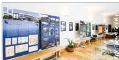
A konferenciához a cégek történetét bemutató kiállítás is kapcsolódik, amit a Városházán szeptember huszonötödikéig tekinthetnek meg az érdeklődők

A Depónia, a Fejérvíz és a SZÉPHŐ legkiemelkedőbb teljesítő munkatársai Polgármesteri Elismerő emlékérmeket vehettek át a konferencia elején. Mint Cser-Palkovics András fogalmazott, azért, mert a dolgozók évtizedek óta fáradoznak azon, hogy az itt élőknek ne legyen gondjuk az alapvető szolgáltatásokkal, hiszen ezek nélkül egy város sem működhet. Steigerwald Tibor, a Depónia Kft. ügyvezetője kiemelte: a hulladékgazdálkodás hetven évvel ezelőtt indult a városban. A cél azóta is a tisztaság biztosítása, de most már mindez a