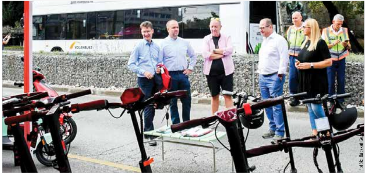
A rendezvényen az Ikarus elektromos busza próbakörre vitte a látogatókat

Ötödik alkalommal adott otthont szombaton az elektromos járművek napjának Székesfehérvár. A Rákóczi utca és a Vár körút lezárt szakaszán, valamint a Prohászka ligetben az érdeklődők kipróbálhatták a legújabb elektromos autókat, rollereket és más közlekedési eszközöket. Cser-Palkovics András elmondta: évekkkel ezelőtt azzal a céllal hívták életre a rendezvényt, hogy az akkor még gyerekcipőben járó