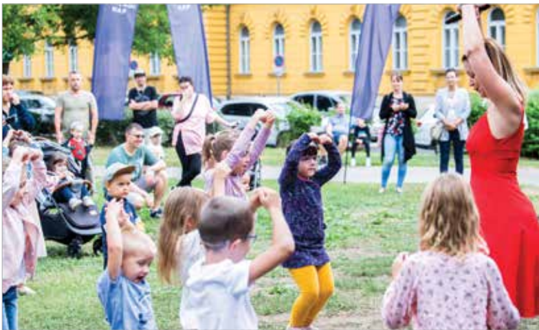
A gyerekeket a Pitypang zenekar varázsolta el