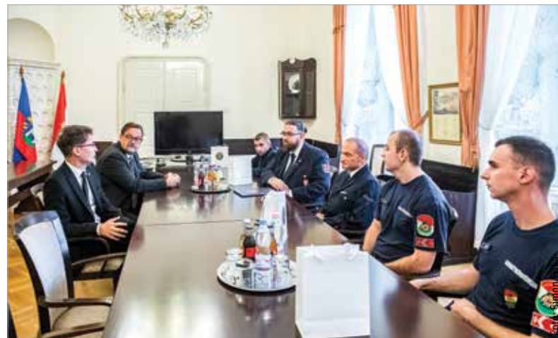
Fehérvári és budapesti tűzoltók is segítettek a börgöndi baleset helyszínén

tizedikén történt tragédia során tanúsított bátor helytállásukért. Cser-Palkovics András úgy fogalmazott: szerették volna a csapat minden tagjának megköszönni azt a gyors és szakszerű munkát, amit a tragédia napján végeztek. Koppán Viktor Dávid, a Fehérvári Tűzoltó Egyesület elnöke megköszönte a város elismerését és a sok évre visszanyúló jó kapcsolatot, támogatást. Külön kiemelte két hivatásos tűzoltó barátjukat, akik ugyan Budapesten teljesítenek szolgálatot és a rendezvényen mint látogatók vettek részt, a tragédiát követően azonban rögtön csatlakoztak a kármentéshez.