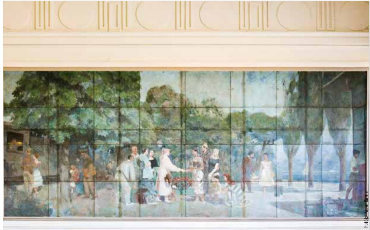
„A Balaton-parti téma üde plein-air atmoszférát áraszt”