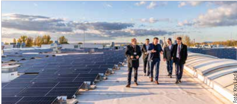
A napelemek segítségével a teljes telephely éves energiafelhasználásának tíz százalékát tudják fedezni, és évi kétszázhetvenegy tonna szén-dioxid-kibocsátását elkerülni

a Grundfos Magyarország Gyártó Kft. ügyvezető igazgatója. A város számára fontos, ha egy ipari partner beruházást valósít meg. Az is, ha valamilyen klímavédelmi beruházás történik, amikor egyszerre valósul meg a kettő, azt meg kell köszönni – hangsúlyozta Cser-Palkovics András polgármester a napelempark szerdai avatóünnepségén: „Jó üzenet, ha az ipar oda tud figyelni a környezetére, az energiakorszerűsítésre, az energiatartósságra. A Grundfos eddig is elharcosa volt ennek, és most is példát mutatott!”