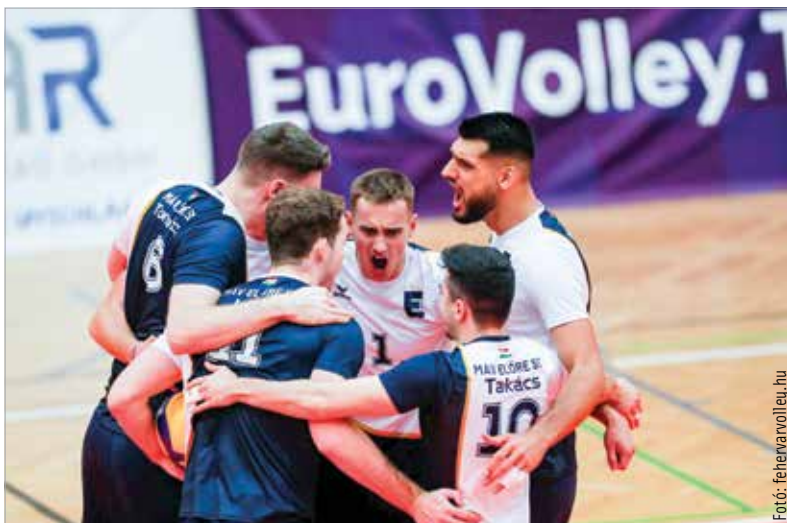
Eddig minden meccsük után ünnepelhettek a MÁV Előre röplabdázói