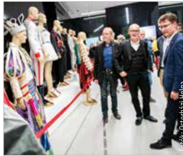
A jelmezek és a vitrinekben látható relikviák megidézik a Diótörő, a Fantomfájdalom, a Hattyúk tava, a Rómeó és Júlia, a Parádé, a Pillangók és a Franc című bemutatók hangulatát