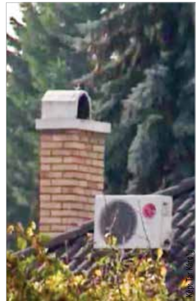
Fontos a rendszeres ellenőrzés: a fűtőberendezéseket, kéményeket érdemes évente, két évente átvizsgáltatni!

„Javasoljuk, hogy a gázüzemű fűtőberendezéseket évente legalább egyszer szakemberrel ellenőriztessék, a szükséges karbantartást végezzék el, ha szükséges, a berendezéseket tisztítsák ki! Ugyanilyen fontos a kémények ellenőrzése! Gázfűtés esetén ez két évente, míg szilárd tüzelés esetén évente szükséges. A lakossági kéményseprést Fejér vármegyében a katasztrófavédelem végzi. Ennek érdekében a családi házakban élőknek időpontot kell egyeztetniük” – hívja