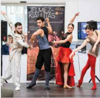
Jelmez és ami mögötte van: performance a megnyitón

„Ha csak azt nézzük, ki milyen jól forog, táncol a színpadon, az