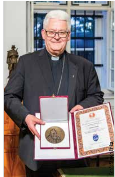
Hittel és empátiával az emberekért