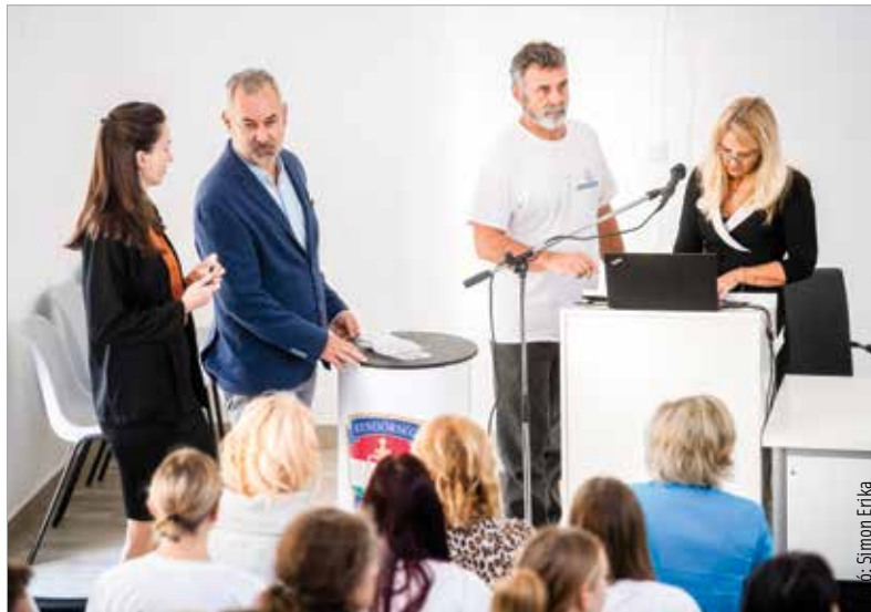
Nagyon magas a látencia: nem szívesen beszélnek az őket ért sérelmekről a gyerekek

„Készség szinten kell elsajátítani a diákoknak az önvédelem, az önszabályozás kérdését, de ez csak együttműködéssel fog menni” – hangsúlyozta Cser-Palkovics András polgármester a konferencián, aki arról is beszélt: fontos, hogy a diákokkal együttműködve történjenek a kibertérben és az iskola falai közt történő bűncselekmények megelőzését szolgáló intézkedések.