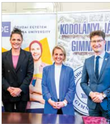
A jövőben közösen dolgoznak együtt a felek a sportolók és a sportág sikeréért

Az akadémia legfőbb célja a sportos, aktív életmódra nevelés, ami már az iskolákban elkezdődik: „Meggyőződésünk, hogy a sport és a tanulás megfér egymás mellett, sőt aki rendszeresen sportol, az kiválóan teljesít az iskolában is. Ahhoz, hogy ezt a gyerekek is elhiggyék, és ezt meg tudjuk valósítani, ahhoz az iskoláknak is partnereknek kell lenniük, folyamatos kommunikáció szükséges köztünk és az intézmények között” – hangsúlyozta Kovács Katalin háromszoros olimpiai, harmincegyszeres világ- és huszonkilencszeres Európa-