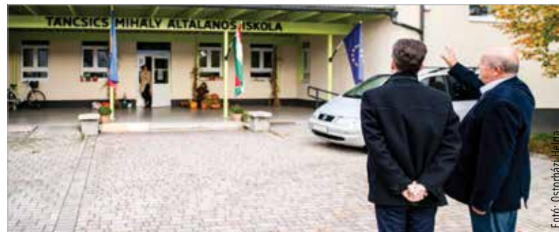
A küllemében is megújult épületben hétfőn sajtónyilvános bejárást tartottak, ahol elhangzott, hogy más iskolákban is hamarosan folytatódnak a hasonló volumenű felújítások

A Táncsicsban nemrégiben újultak meg a vizesblokkok, az energetikai korszerűsítés után pedig – mint arra a város polgármestere, Cser-Palkovics András hétfőn ígéretet tett – tetőcsere következik az intézményben. A polgármester hozzátette: Székesfehérvár számára kiemelten fontosak az iskolák, és ez nem változott meg attól, hogy már nem az önkormányzat a fenntartó. Kormányzati forrásból még ebben a hónapban megindul a Hétvezér és az Arany János iskola Budai úti épületének felújítása is.