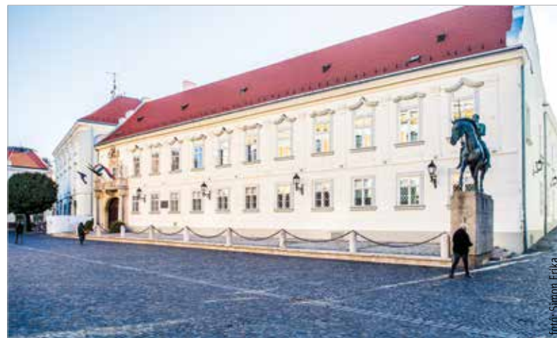
A város emblematikus épületeinek felújításával végre a Városház tér egésze méltóvá vált Székesfehérvár történelmi múltjához, jelenkori fejlődéséhez és a jövő ígéretes kilátásaihoz

A felújítás ideje alatt a hivatal munkatársai az épületben dolgoztak, ezt folyamatos költözéssel oldották meg. A polgármester szerint nemcsak nekik, hanem a városban élőknek is jó hír, hogy véget értek a munkálatok. Aki kíváncsi, milyen lett az épület a felújítás után, megnézheti, hiszen idén is lesz Városháza-túra: a hagyományokhoz híven az adventi időszakban újra megnyílik az érdeklődők előtt az épület, és vele együtt a polgármester irodája is.