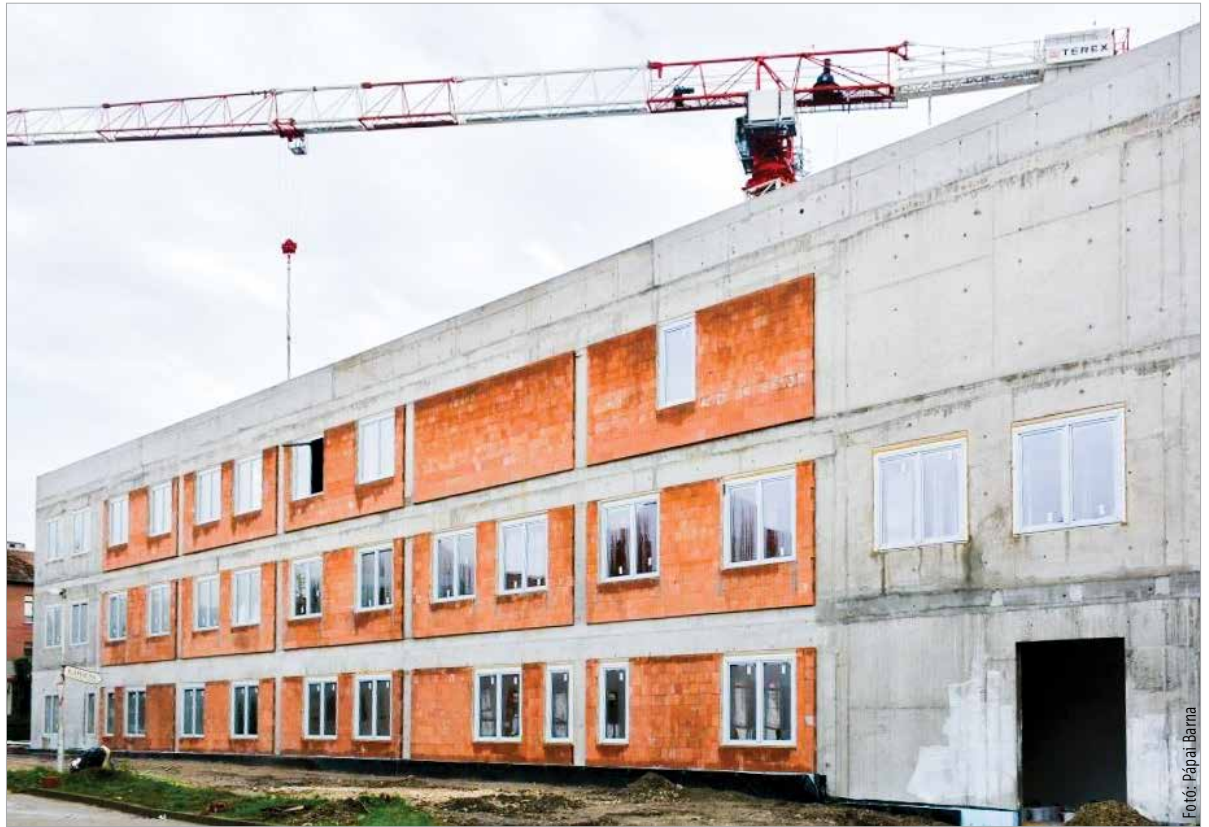
A kórház új belgyógyászati tömbje is épül tovább

ben. Ezen beruházások mindegyike meg fog valósulni! A fedezet döntő része a város számláján van, az önkormányzatnak visszafizetési kötelezettsége nincs.