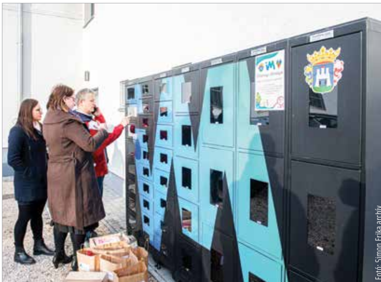
Az IVM ajánlotta fel tavaly az adománygyűjtő automatákat Székesfehérvárnak

ismerős lehet, hiszen 2022-ben az ő felajánlásuk révén helyezhették el a város három adománygyűjtő automatát, melyekben a rászorulóknak szánt karácsonyi felajánlásokat gyűjtötték a város és hét szociális szervezet közös jótékonykezdeményezésére. A berendezések jó szolgálatot tettek, rengeteg adományt sikerült praktikus módon összegyűjteni bennük, rugalmas lehetőséget biztosítva az adakozó fehérváriaknak az ünnepi időszakban.