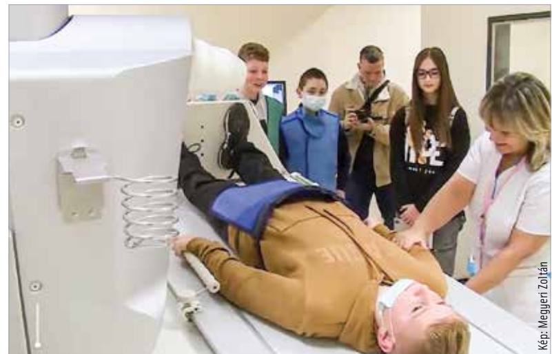
Ritkán jár örömmel egy-egy kórházlátogatás, azok az általános iskolások azonban, akik részt vettek a keddi nyílt napon, biztosan szívesen gondolnak vissza emlékeikre. Húsz vármegyei intézmény több mint száz diákja ismerkedett a Szent György Kórházzal, annak működésével a rendhagyó, interaktív programon.