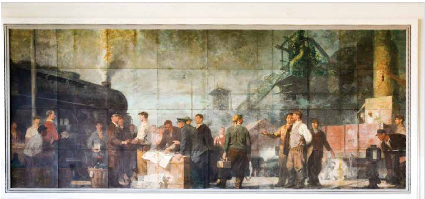
„Az ipari téma kidolgozása monumentális, ünnepies”

A két pannó a vasútállomás közelmúltbeli felújításának köszönhetően kiváló állapotban van, és sokáig díszlehet még a fehérvári fogadócsarnoknak.