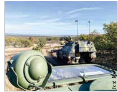
Kilátás a harcjárműből a bakonykúti lőtérre

A gyakorlat egyik fő célkitűzése az, hogy a Magyar Honvédség szervezeti elemei, illetve a védelemigazgatás bizonyos rendszerei kapcsolatba kerüljenek, ezt a kapcsolatot teszteljük, majd a későbbiekben értékeljük, és ahol szükséges, javítsanak a folyamatokon. Katonai konvojok mozgására, forgalomkorlátozásra az ország szinte egész területén számítani lehet továbbra is. A hadgyakorlaton közel ötezer katona vesz részt.