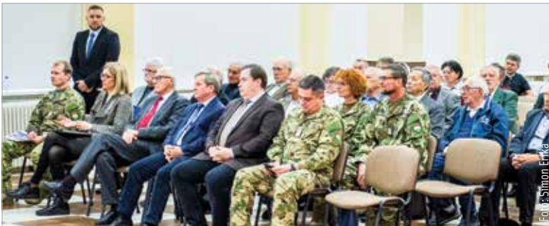
A nyugállományú katonák javaslatait és észrevételeit is várta a vezérkar főnöke