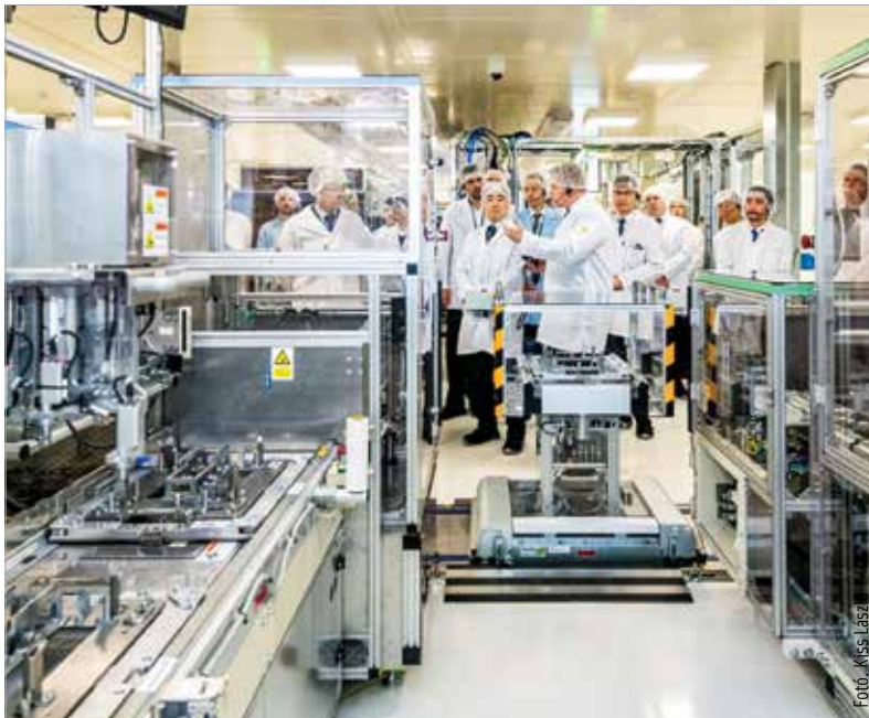
Autóipari paradigmaváltás – új korszak kezdődik a fehérvári gyár életében is

Az inverter az elektromos autók „lelke”. Kiemelt szerepet tölt be, hiszen feladata az akkumulátor egyenáramának váltóárammá való átalakítása, valamint az áram frekvenciájának változtatása a motor megfelelő működése érdekében.