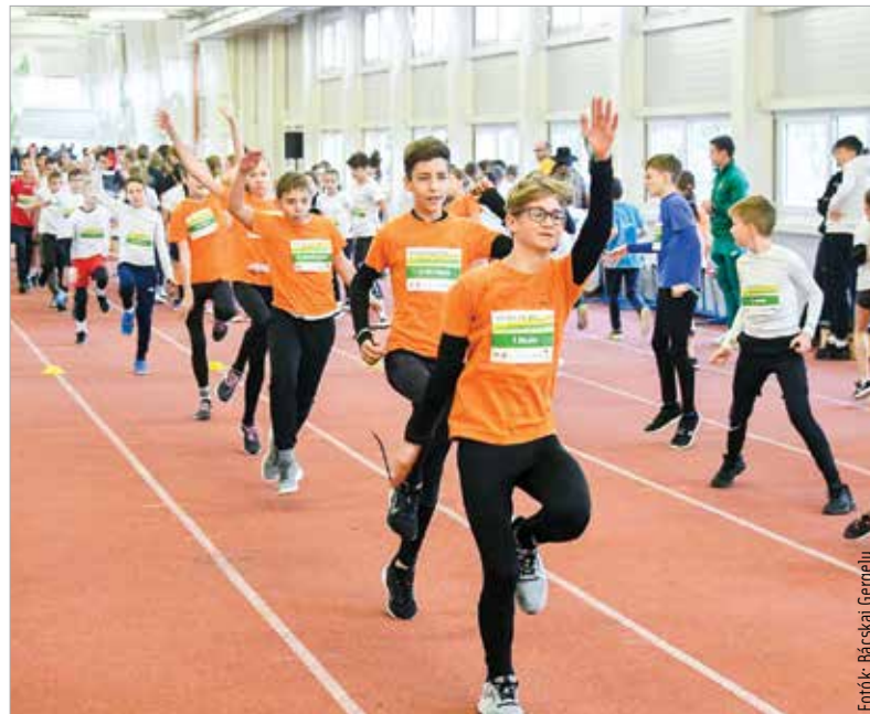
Fontos, hogy minél fiatalabb korban a mindennapok részévé váljon a sportolás

tanulóit keresi a sportklub. Pénteken délután az őszi iskolai felmérések korosztályonkénti első tizenkét helyezettje csapott össze a Bregyó közti sportközpontban.