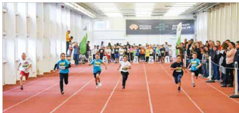
A péntek délutáni sporteseményen a gyorsaságon és a robbanékonyságon volt a hangsúly. Akik a legjobb időt futották, értékes serlegekkel és érmeikkel gazdagodtak.