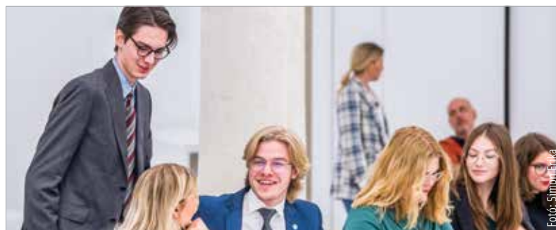
A diáktanács és a diáktanács által a kormányzat felé megfogalmazott ajánlások a diaktanacs.hu internetes oldalon olvashatók

Az Országos Diáktanács létrehozásáról 2017-ben döntöttek Fehérváron, majd a tanács nem sokkal később tizenkilenc megyei és két fővárosi küldött részvételével alakult meg. Feladata, hogy képviselje a diákok érdekeit az oktatási kormányzat felé, továbbá javaslatokat tegyen a döntések meghozatala előtt.