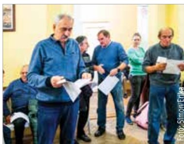
Óriási érdeklődés mellett zajlott az idei szűrőnap: százhusz helyre közel hatszázan szerettek volna bejelentkezni

Az elmúlt évek prevenció programjainak köszönhetően a szombati esemény résztvevőinek számán is jól látszik, hogy a férfiaknak is fontos