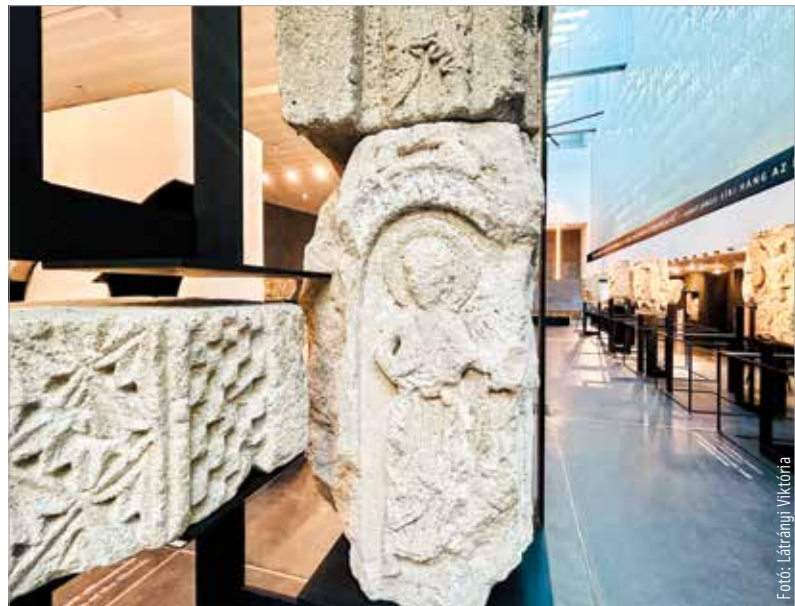
Pénteken délután öttől kilencig ingyenesen látogatható a város legújabb kulturális közösségi tere

Köz társaság mozi helyén. Az egykori koronázobazilika közvetlen közelében egy olyan kulturális és információs pontot alakítottak ki, mely a Nemzeti Emlékhelyhez kapcsolódva bemutatja annak történelmi, társadalmi, földrajzi és építészeti jelentőségét. A megnyitó napján 17 órától 21 óráig ingyenesen lehet megtekinteni az új kulturális közösségi teret.