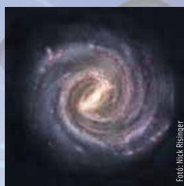
2023. november 16-22.

Ünnepeld meg a sikereidet! Légy büszke, hogy túlélte a kríziseket, és talpra tudtál állni! Végre ki mersz és ki is tudsz mondani olyasmit, amit eddig nem. Kérdés, hogy találsz-e értő füleket hozzá. De akkor is ki kell mondanod, ha a másik fél még nem fogadóképes!