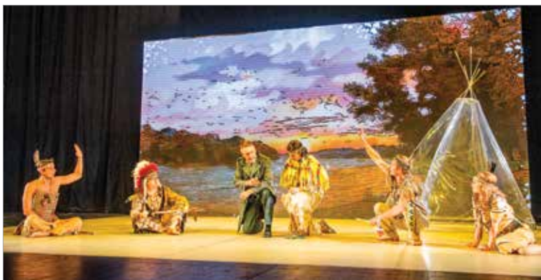
Indiánlét – menekülés a hatvanas évek problémái elől

Az Európa Kulturális Fővárosa rendezvényt sorozat támogatásával bemutatott produkció nagy sikert aratott a nyáron, most a Vörösmarty Színház is műsorára tűzi, hogy a székesfehérvári közönség megismerhesse az Apacsok megdöbbentő történetét