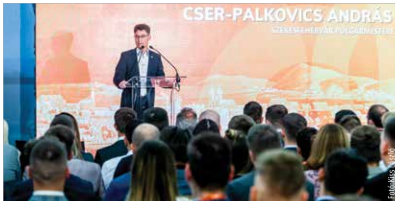
A történelmi felelőség távolra mutat, ennek a feladatnak a része a fiatalokkal való foglalkozás is – fogalmazott Cser-Palkovics András

nak fel kell vállalniuk. Olyan világot kell építeniük, amit nyugodt szívvel adhatnak tovább. Menczer Tamás, a Külgazdasági és Külügyminisztérium államtitkára is köszöntőt mondott a Fidelitas kongresszusán. A politikus arról beszélt, hogy a magyar külpolitika mindent a magyar érdekeknek megfelelően tesz. A felszólalók közül többen is beszétek a jövő évi európai parlamenti választás fontosságáról. Mint elhangzott, véget kell vetni Brüsszelben a kettős mércének. A magyarok jövőjét a magyaroknak, és nem másoknak kell írniuk.