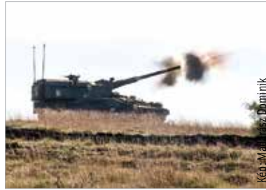
Negyvenkilős gránátokat lő ki a Magyar Honvédség új önjáró lövege

Az Adaptive Hussars 2023 elnevezésű gyakorlat keretében földön, vízen és levegőben egyaránt mozognak a katonák annak érdekében, hogy a feltételezett keletről jövő fenyegetést elhárítsák az országban állomásozó NATO-erőkkel közösen. Múlt héten a