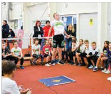
Az ugrás, a futás, a dobás minden sportág alapja

Az Alba Regia Atlétikai Klub ARAK-AKTÍV elnevezésű programja már tizenhárom éve mozgatja meg a fehérvári iskolásokat. Tavaly a Hiper-versenysorozattal bővült az esemény, ahol Székesfehérvár leggyorsabb és legruganyosabb