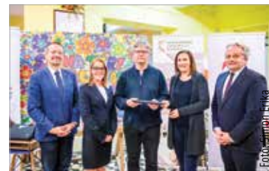
A notebookot a tanulók az iskola elvégzéséig használhatják

„A kormány elkötelezett abban, hogy a gyermekek és a pedagógusok számára is biztosítottak legyenek a megfelelő eszközök. Az előző tanévben százhuszezer notebookot osztottunk ki, az idei évben további száznegyvenezer eszköz talál gazdára a diákok és a pedagógusok körében. A programot folytatjuk: a következő félévben az ötödik, hatodik és kilencedik évfolyam következik majd a sorban” – nyilatkozta lapunknak Balatoni Katalin, a Belügyminisztérium köznevelési helyettes államtitkára kiemelte: az eszközökön túl fontos a használatukhoz szükséges háttérinfrastruktúra fejlesztése is. Ezért több mint negyezer feladatellátási helyen újult