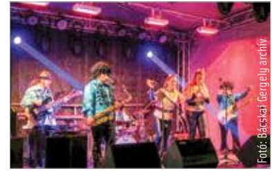
A fehérvári zenészekből álló Discover Band évek óta fergeteges hangulatot varázsol az év utolsó napján