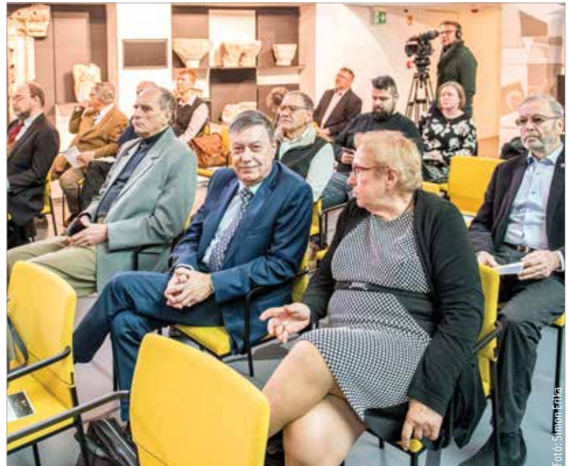
A konferencián két szekcióban összesen nyolc előadást hallhatott a közönség

„Büszkék vagyunk arra, hogy Székesfehérvár nem feleli több mint ezeréves történelmét, és méltó módon emlékezik rá!” – emelte ki Vargha Tamás, Székesfehérvár országgyűlési képviselője.