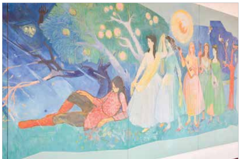
Áron Nagy Lajos munkája hatvanegy éve készült

rösmarty Színház történetében, hiszen a második világháború utáni újjáépítést követően ezzel a darabbal avatták fel a megújult színházat 1962. december 7-én. Ahogy a Theatre Architecture fogalmaz: „1959 és 1962 között Spráncz Tibor és Hornicsek László belsőépítész tervei alapján teljesen újjáépítik, többnyire a régi épület stílusában, kiegészítve a legkorszerűbbnek számító gépészettel és a kor esztétikáját és kultúrpolitikai nézeteit tükröző belsőépítészeti megoldásokkal. 1780 négyzetméter területet építettek be (teljes térfogat: 32 043 m 3 ), 36 millió forintból. Az avató előadás