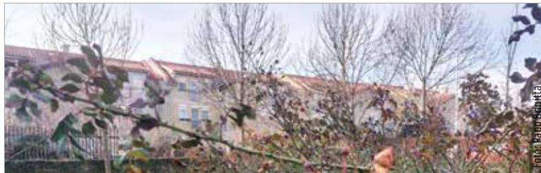
Hamarosan ébred a természet, kezdődhetnek a kerti munkák!

A tavaszi veteményezés februárban indul. Vethető sóska, spenót, petrezselyem, dughagyma, fokhagyma, borsó, lóbab. Ezenkívül a palántázást is érdemes elkezdni azoknak, akik üvegházban vagy fóliában fogják nevelni a zöldségeket. A szabadföldi palánták vetésének még nincs itt az ideje, azzal érdemes várni márciusig – mondta el a szakértő.