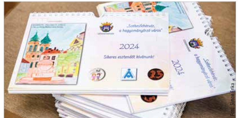
Idén is kiadták a városi diákok rajzaival díszített naptárt

Székesfehérvár önkormányzata nevében Cser-Palkovics András polgármester fejezte ki köszönetét a kezdeményezés valamennyi résztvevőjének, szervezőjének, a rajzok készítőinek és a felkészítő tanároknak: „Ezt a naptárt először nem is Székesfehérváron kaptam kézbe. Még országgyűlési képviselő voltam, amikor egyszer az ülés-terembe belépve láttam, hogy minden képviselő asztalán ott van egy naptár. Ez is jelzi, hogy egy régi hagyományról van szó, és azt is jelzi, hogy az országban sokfelé elviszi városunk hírnevét!” Az alkotó fiataloknak a polgármester elismerő oklevelét adott át, majd átvehették az idei naptárt, valamint Balajthy Ferenc költő névre szóló, Kettőskereszt című kötétit is.