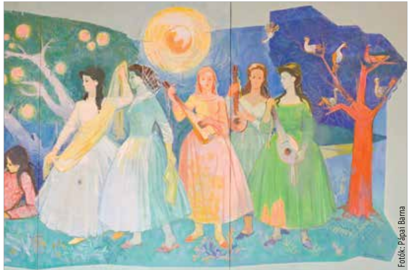
Öt táblából áll a pannó

A Csongor és Tünde kiemelten fontos előadásnak számít a Vö-