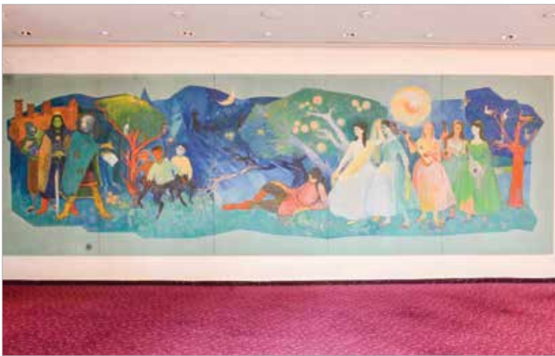
A Csongor és Tünde az egyik legfontosabb előadás a fehérvári színház történetében

sabb darab a fehérvári teátrum életében, és ezen a ponton vissza is térünk Áron Nagy Lajoshoz és alkotásához. A pannót az 1962. decemberi bemutatót és színházavatást követő esztendőben, 1963-ban festette a művész. A festmény eredetileg az emeleti társalgóban kapott helyet, innen került később a mai helyére. A pannó kiváló állapotban van, remélhetőleg hosszú évekig, évtizedekig gyönyörködhetnek még benne a fehérvári teátrum előadásainak és más rendezvényeinek látogatói!