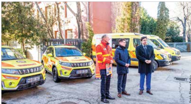
Az ügyeleti rendszer egységesítése egy országos program része

A gyermekeket a gyermekambulanciára várják. Ott is két lehetőség van: vagy háziorvosi vagy kórházi ellátásban részesülnek. Székesfehérváron és Dunaújvárosban hétköznap délután négy és másnap reggel nyolc óra között lesz ügyelet, hétfőn és ünnepnapon pedig este nyolctól reggel nyolcig. Az orvosi ügyelet központi száma 1830-ra változott, indulás