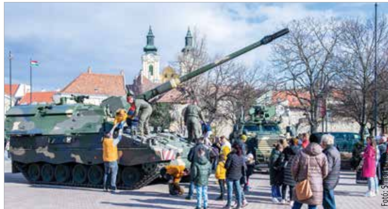
Aki a PzH 2000-es lövegen vállal szolgálatot, annak az illetménye több mint bruttó hétszáz-ezer forint lesz havonta

A Magyar Honvédség az ország számos pontján tart toborzórendezvényeket. Aki kedvet kap hozzá, hogy belépjen, az iranyasereg.hu oldalon teheti meg.