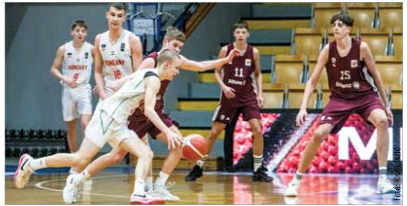
Az idei torna kellemes meglepetése volt a magyar U16-os válogatott szereplése

gatótól kapott ki, így a bronzéremtől játszhatott. Azt pedig meg is szerezte, miután 83-61-re megverte a Bayern Münchent. A döntőben természetesen a madridiak voltak a favoritok, és a német nemzeti csapat ellen is érvényesítették a papírformát: 87-70. Így ismét ők vihették haza a trófeát, az Alba Regia Sportcsarnok közönsége pedig reménykedhet benne, hogy idén is láthatott olyan fiatalokat, akik akár a világhírű viszik a későbbiekben. Mint az első Szent István-kupán itt járt, ma már a világ egyik legjobbjának számító Dallas-sztár, Luka Dončić.