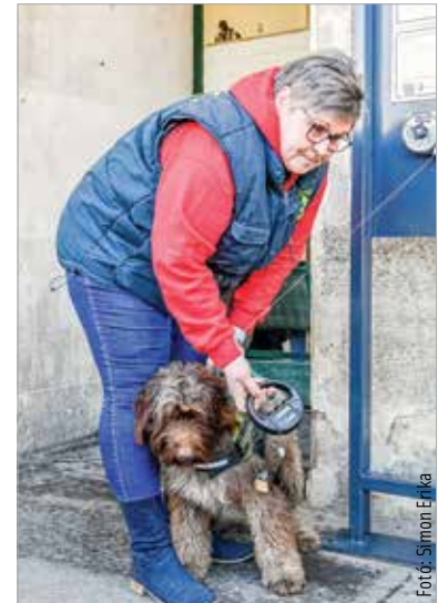
A chipleolvasó segítségével pillanatok alatt beazonosítható az elkóborolt állat és gazdája

„Az állatvédelem és a közösségi közlekedés fontos területek, ezek összekapcsolódása pedig elengedhetetlen, amikor sokan utaznak a házi kedvencekkel” – hangsúlyozta Cser-Palkovics András polgármester, aki hozzátette: mindehhez szükség van a civilszervezetek, az állam és az