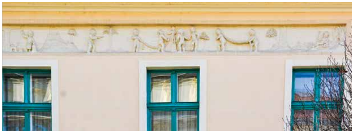
Az épület díszítésében a puttóké a főszerep, akik a több mint két évszázad alatt sokmindet láttak

A saroképületet talán mindenki ismeri, még az is, aki a nevét eddig nem hallotta. A Vörösmarty Színház mellett található, hivatalos címe szerint ez a Fő utca 13. A Galla-ház műemléki védelem alatt áll, így egy sor fontos információt tudhat róla. Építése 1810 körülre tehető. Tervezője legnagyobb valószínűséggel a német származású Pollack Mihály volt, aki az 1807 és 1812 között épült Megyeháza megvalósításában is jelentős szerepet vállalt. A Galla-ház épületdíszei közül