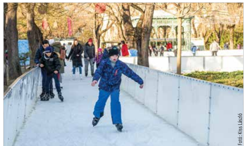
A tavaszi időjárás miatt olvadásnak indult a Koriliget jégfelülete, ezért a létesítmény a hét elején bezárt

A héten várható, több mint tízfokos nappali átlaghőmérséklettel – egy időre legalábbis – megérkezett a tavasz, így azoknak, akik ismét a Koriligetben szeretnének korszakot húzni, a következő szezon kezdetéig várniuk kell!