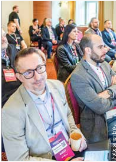
A konferencián szó esett arról, hogy mit lehet motiválni, és mi ebben az egyén, illetve a szervezet felelőssége

A polgármester szövege arról is, hogy Fehérváron a gazdasági fejlődés mellett folyamatos városfejlesztés is folyik: „Ez további feladatokat ad a környezetvédelemtől a közlekedés és a lakásépítés kérdésein át a megfelelő munkaerő biztosításáig. Abban is helyt kell állni, hogy a megfelelő egész-