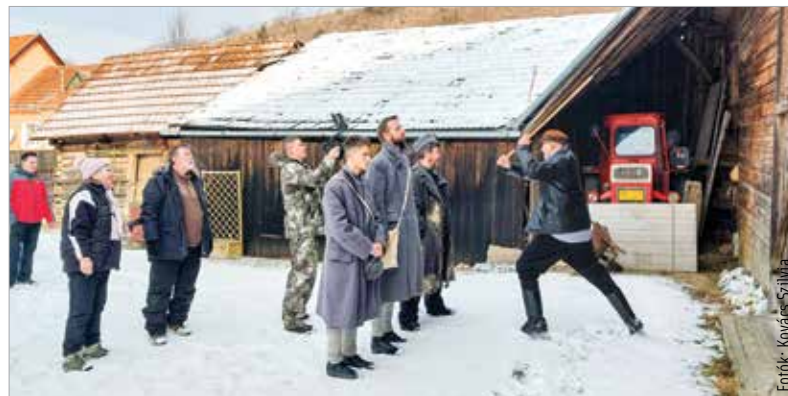
Egy másik csomortáni ház udvarán a hadifogóság mozzanatait örökítették meg