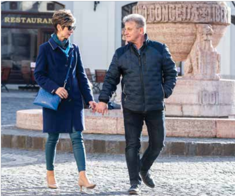
A mai napig kéz a kézben