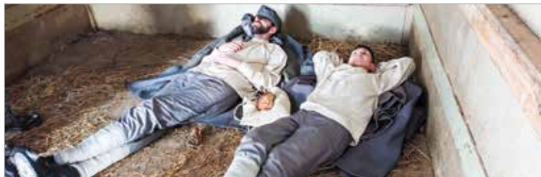
A stáb egy hegytetőn álló marhavagonban vette fel a vonatos utazás jeleneteit