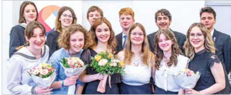
A tavalyi döntősök is igazi közösségépítő rendezvényként emlékeznek a Fehérvári Versünnepre

A Fehérvár Média centrum társadalmi felelősségvállalási programjának fontos alappillére a Fehérvári Versünnep. A programsorozat fővédnöke Spányi Antal megyés püspök, valamint Cser-Palkovics András polgármester. Akik korábban részt vettek a tehetséggondozó programon, azok megtapasztalhatták, hogy igazi közösségi élmény a Fehérvári Versünnep. A különleges program sok esetben vált kapocsá, mely évek múlva is összeköti a résztvevőket. A közönség évről évre maradandó élményekkel gazdagodik, hiszen nagyszerű produkciókkal készülnek a fiatalok, felvállalva az iro-