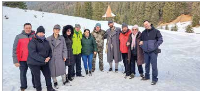
A fehérvári csapat örök barátságot kötött a csíksomortáni szereplőkkel