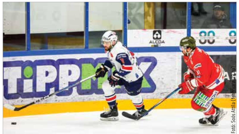
Kedden Klagenfurtban játszott, és 5-2-re kikapott a listavezetőtől a második helyen álló Fehérvár

esítése február huszonegyedikén indul, míg az ülőhelyek esetében a bérletesek által igénybe nem vett, felszabaduló ülőhelyek február huszonhatodikától lesznek elérhetők. Ezek a jegyek még az Ifj. Ocskay Gábor Jégcsarnokba szólnak, de már javában készül a klub az Alba Aréna birtokba vételére! A klub honlapján egy kérdőív érhető el, mellyel a szokásokat, igényeket és szándékokat igyekeznek felmérni, hogy az új létesítményben minden szurkoló jól érezze magát. Az ideális meccsidőponttól a bérletkonstrukción át az erre szánt összegig sok minden szerepel az online felmérésben.