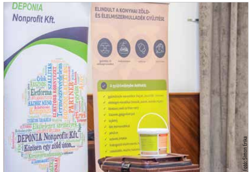
A résztvevő háztartások tájékoztatót és ötliteres zárható edényt kaptak