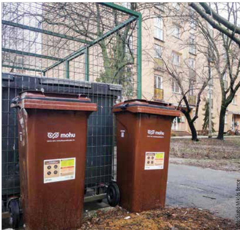
A szedreskertiek is bekapcsolódhatnak a programba

összegyűjtött hulladék, ahol hőt és villamos energiát tudnak előállítani belőle a későbbiekben, illetve a fennmaradó részt komposztyszerű anyagként a mezőgazdaság hasznosíthatja.” Székesfehérvár elkötelezett a környezet- és természetvédelem ügye mellett – tette hozzá a város polgármestere. Cser-Palkovics András abban bíz, hogy sokan élnek majd az új gyűjtési lehetőséggel: „A környezetvédelem terén az egyik legfontosabb annak a lehetőség-