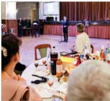
A bál résztvevőit Cser-Palkovics András polgármester köszöntötte

A jótekonysági bállal egyrészt a Viktória Rehabilitációs Központ működését támogatták a résztvevők, másrészt a nemrég elhunyt alapítóra, egykori igazgatóra, Horváth Klárára is emlékeztek. A