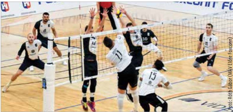
Óriási küzdelemben maradt alul a Kaposvárral szemben a MÁV Előre

ki a MÁV Előre. Kár érte, de lesz még lehetőség bizonyítani a tizenkilencszeres bajnok ellen! Kedden és szerdán pedig már Zágrábban, a Közép-európai Liga alapszakaszának nyolcadik fordulójában volt két meccse Dávid Zoltán csapatának. Az elsők a házigazda Mladost ellen volt esély, de végül 3:1-es vereség lett a vége. Szerdán a listavezető Calcit Kamnik volt az ellenfél: az eredmény – némi bírói segítséggel – ugyancsak 3:1 a szlovénoknak. A MÁV-Előre csapata első nemzetközi szezonjában azonban így is csupán rosszabb szettaránya miatt végzett az ötödik helyen a liga alapszakaszában, éppen lemaradva a döntőről.