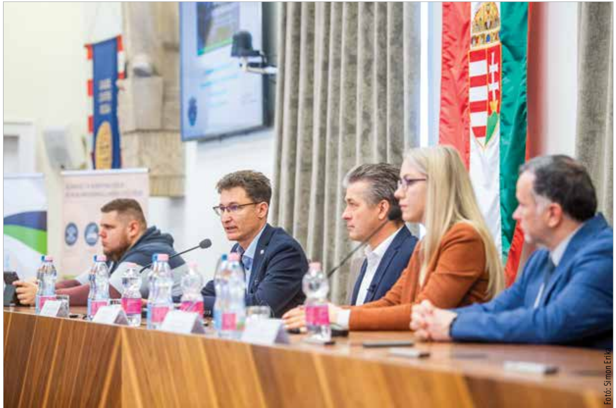
A rendszer célja, hogy a hulladék minél nagyobb részét újra tudják hasznosítani – hangzott el a Városházán tartott tájékoztatón

A konyhai hulladékok gyűjtése egy országos program része. 2024-től tizennégy hazai városban vezették be. A rendszer célja, hogy a hull-