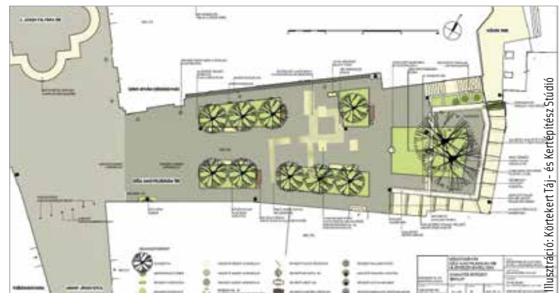
Illusztráció: Körtekeret Táj- és Kertépítész Stúdió

A Géza nagyfejedlem téren a régészeti kutatások sokáig tartottak, de jó okkal: a szakemberek falszakaszokra bukkantak az egykori királyi várból, városunk történelmének fontos emlékeit feltárva. A tér újjáépítése azonban hamarosan folytatódhat: tavasszal megújul a teljes burkolat, fákat ültetnek, zöld szigeteket alakítanak ki, és több, a helyszín történelmi értékére utaló elemet is elhelyeznek majd. „Folytatódik a történelmi belváros megújulása. A Géza nagyfejedlem tér után pedig a Városháza zásduvara következik!” – adta hírl Cser-Palkovics András polgármester szombat.