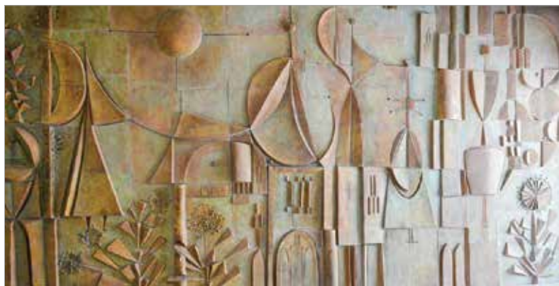
A nagy méretű alkotás jó állapotban van