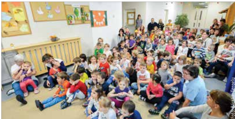
A beiratkozásról, az intézmények felvételi körzeteiről és az önkormányzati fenntartásban működő óvodák elérhetőségeiről, illetve a körzetek utcajegyzékéről részletes tájékoztató található a város honlapján

vállaló költségvetést alkottunk meg, amiben rengeteg olyan fejlesztés és szolgáltatás van, amit már hosszú évek óta biztosít az önkormányzat a székesfehérváriak számára. A költségvetés mindemellett a fejlődést és az innovációt is segíti, hiszen bölcsődék, óvodák, iskolák újulnak meg, és utak, járdák fejlesztése valósulhat meg.” A testület döntött a helyi buszhálózat bővítéséről is. Elhangzott, hogy az elmúlt időszak tapasztalatait figyelembe véve nem egyszerre, hanem ütemezetten, bizonyos időszakokként néhány járatot érintve lépnek majd életbe a hálózatot és a menetrendet is érintő változások. A bővülést követően összességében mintegy évi hárommilliárd forintot fordít a város a közösségi közlekedésre.