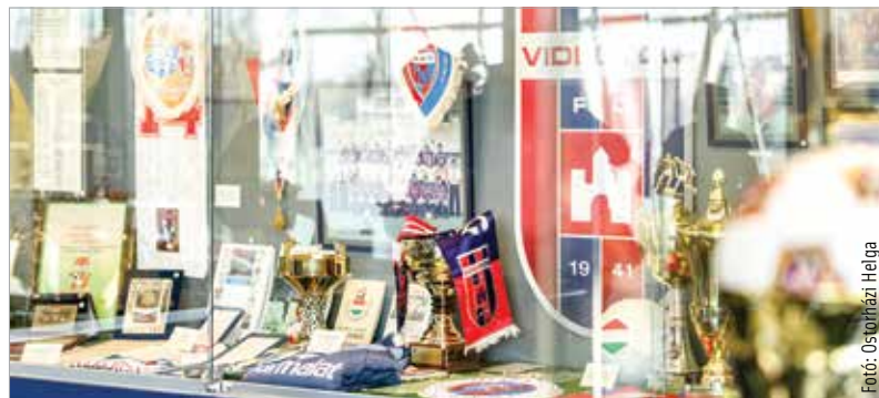
Relikviák a vitrinekben

A jövőben számos programot terveznek a helyszínen, azaz a Sóstói Stadionban megrendezni, például csocsó- és kommentátorbajnokságra, nyári táborokra is számíthatnak az érdeklődők. Kiemelten készülnek továbbá a 1984-es UEFA-kupa-menetelés negyvenedik évfordulójának megünneplésére. Folytatódnak a stadiontúrák, ezekbe minden esetben beletartozik majd a múzeumi körbevezetés is. A múzeum innentől állandó nyitvatartással, keddtől szombatig lesz látogatható, ami azt is jelenti, hogy a múzeumba ezentúl jegyet és bérletet is válthatnak a szurkolók, akár a mérkőzések előtti órákban is, hiszen akkor is várják majd az érdeklődőket.