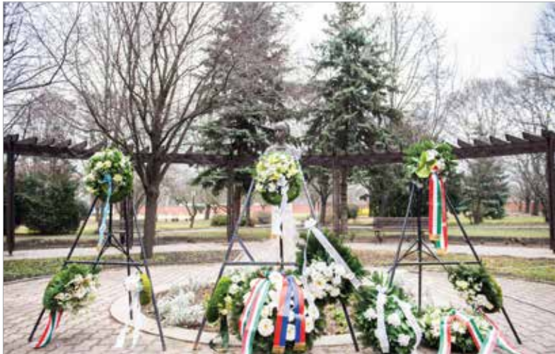
Koszorúk Kossuth Zsuzsanna szobra előtt