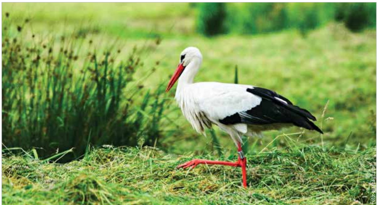
Volt, amikor nyolcezernél is több gólyapár fészkel Magyarországon

Tavaly az ország jelentős részén ismét adatgyűjtés folyt a fészkekről a mindenki számára nyitott Természetesen elnevezésű program részeként. 1143 olyan település volt, ahol a 2019-es országos felmérés során és 2023-ban egyaránt történt adatgyűjtés. A két adatast alapul véve megbecsülhető a teljes országos állomány, amely 2019-ben