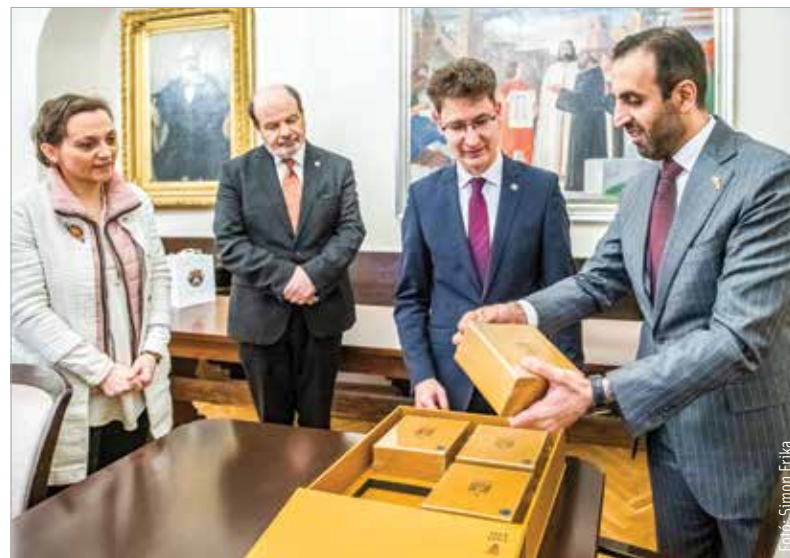
„Ugyanazok a dolgok fontosak számunkra: a vallás, a család, a történelem” – emelte ki a Városházán az Emírátusok nagykövete

belváros nevezetességeivel, így az Országzászló térrrel, a Varkocs-szoborral, valamint a bíróság és a Városháza épületével is. A nagykövet a látogatás során elmondta, hogy minél több magyar városba szeretne eljutni, így örömmel érkezett Székesfehérvárra is: „Szeretnék hídat építeni az együttműködések terén!” – emelte ki látogatása célját Saud Hamad Al-Shamsi.