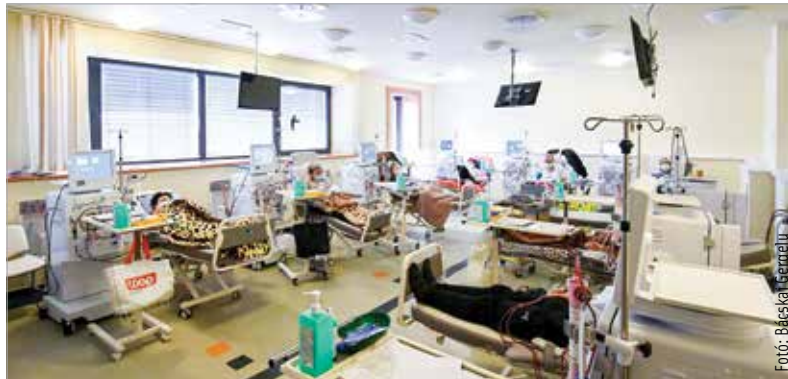
Aki dialízisre, azaz művesekezésre jár, annak hetente háromszor kell bejárnia a kórházba, alkalmanként négy órára. Egy átlagos testsúlyú ember szervezetében felhalmozódott mérgeanyagok eltávolításához ugyanis ennyi időre van szüksége.

Az eseményre azokat a húsz és hatvanöt év közötti hölgyeket várták, akiknek fontos az egészségük. Keresztury Lászlóné, az Egészségügyi Fejlesztési Iroda szakmai vezetője elmondta: a szűrőnapon az orvosok az idejében észlelt elváltozások, panaszok kapcsán tudnak tanácsot adni. A vizsgálatokat többek között