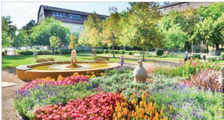
Az Arge-kutat 1978-ban avatták fel, öt éve pedig a tér egészével együtt felújították

tehát a köztéri alkotások kiemelt helyet foglaltak el. Főleg 1969 és 1996 között rengeteg hazai településen jelentek meg a munkái. A Városliget mellett Leányfalu, Visegrád, Esztergom, Vác, Oroszlány, Tata, Szentendre, Szekszárd, Siófok és Székesfehérvár is gazdagodott Szabady-alkotással, és a lis-