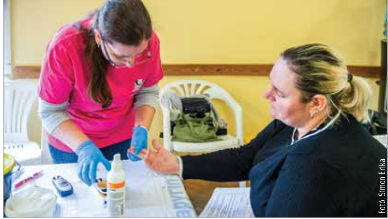
Gyors és fájdalommentes vizsgálatok várták a résztvevőket