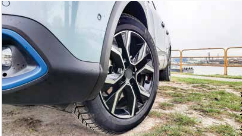
Az abroncs futásteljesítményét és élettartamát elsősorban az befolyásolja, hogyan bánunk a gázpédállal

Vannak olyan sportautók, melyeken a gumiabroncs jó esetben akár 3000 kilométert is kibír. Nem elírás, nem maradt le egy nulla! A tetemes tömeg, a hatalmas forgatónyomaték leradírozza a gumik futófelületét, melyek így egész egyszerűen mehetnek a kukába. Valami hasonló gondolat alapján pattanhatott ki az a feltételezés is, hogy az elektromos autók abroncszabálók. Hiszen a villanymotor forgatónyomatéka többszöröse egy hasonló méretű, de belső égésű erőforrásnak, na és a mérlegen is többet nyom a zöld autósoda – akár háromszáz-ötyszáz kilóval. A Magyar Gumiabroncs-szövetség (HTA) szakemberei is utánajártak a témának. Összefoglalójukból kiderül, hogy