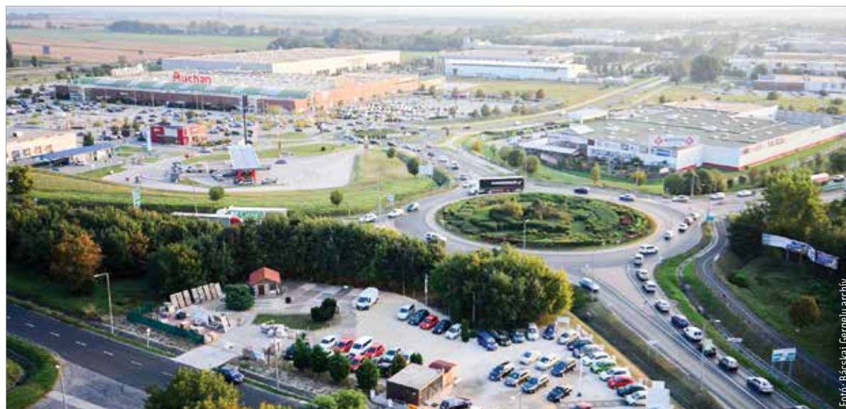
Indulhat az Auchan melletti körforgalom bővítése! A kormány döntése nem csak Székesfehérvár számára kiemelkedő jelentőségű, hiszen a csomópont régiós, sőt országosan jelentős főutak metszéspontja, emellett kiszolgálja a térség személy-, áru- és turisztikai forgalmát is.

közlekedési infrastruktúrára nehezedő fokozott nyomás miatt a továbbiakban is komoly fejlesztéseket kell végrehajtani annak érdekében, hogy a térség infrastruktúrája lépést tudjon tartani a gazdasági növekedéssel és az emelkedő ipari termeléssel” – indokolta a kormány döntését a miniszter, aki további jó hírről is beszámolt: a negyedik sztrádalehajtó tervezése is zöld utat kapott.