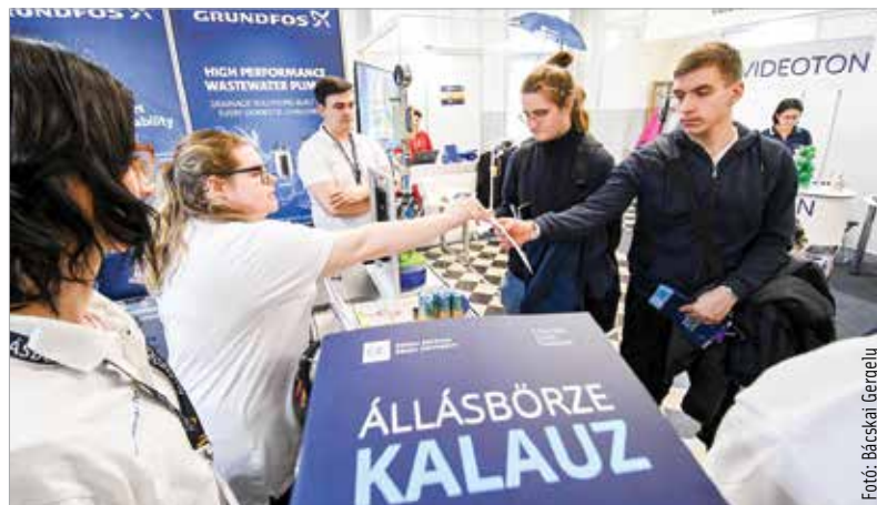
Főleg mérnök végzettségű fiatalokat kerestek a börzén felvonuló cégek