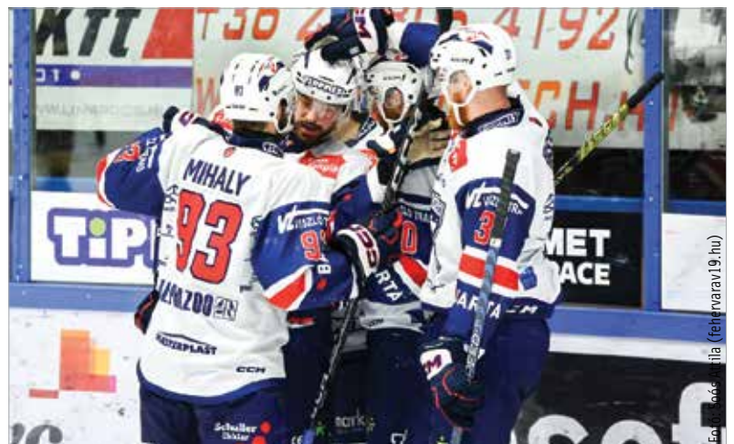
A negyedik meccsen 5-3-ra nyert, és újra vezet a párharcban a Volán