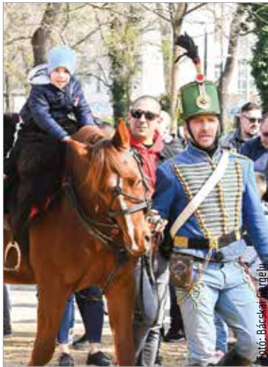
A bátrabbak nyeregbe is pattanhattak

A reformkori Székesfehérvár hangulatát idézte az az ünnepi forgatag, amely a Városház téren és a Zichy ligetben várta március tizenötödikén a látogatókat. Betyárhétpróba, kézműves-foglalkozások és népi játékok várták az ünneplőket, valamint hagyományőrző honvéd tüzerek bemutatója röpitette vissza a résztvevőket 1848-ba.