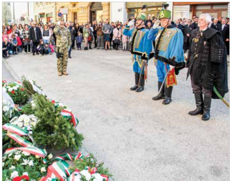
A nemzeti ünnep programjai a fehérvári események központi helyszínén, a Fekete Sas Szálló előtt értek véget

polgárok közösen cselekedtek, közös akaratot alkottak, a nemzeti egység ideálját, ha csak egy rövid időre is, de maradéktalanul valóra váltva. Egy nap azonban elhanyagolhatóan kevés idő egy