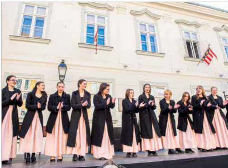
A Színpadka színjátszócsoporthoz tagjai „kinyitották” a nézők előtt a Teleki Blanka által Pesten 1846-ban indított magyar tanítási nyelvű lánynevelő intézet kapuit, és betekintést adtak a tizenkét főúri lány mindennapjaiba, a nagyon fontos magyar- és történelemórákba

tettekre a magyar lelki erő örök forrásaként tekintünk. A Fejér Vármegyei Közgyűlés elnöke az 1848-as fehérvári események felidézésével kezdte ünnepi beszédét. Molnár Krisztián ezt követően az ország függetlenség-