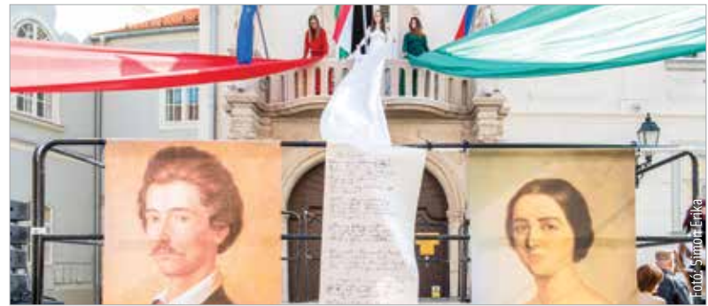
A Szabad Színház utcaszínházi előadásának is részese lehetett a közönség