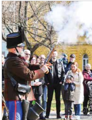
Az érdeklődők megnézheték a hagyományőrző honvéd tüzerek bemutatóját is