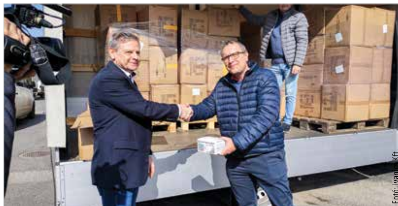
A százezer maszk hosszú időre elég lehet a kórháznak

A kórházban évente átlagosan tíz-tizenötezer darab maszk fogy el a mindennapok során, így a százezer mennyiség hosszú időre fedezheti a kórház szükségleteit.