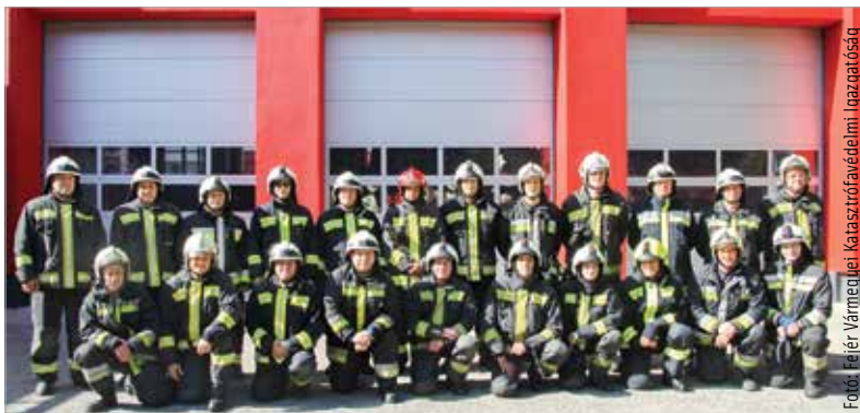
Tavaly is több, nagyon nehéz helyzetben álltak helyt a fehérvári tűzoltók