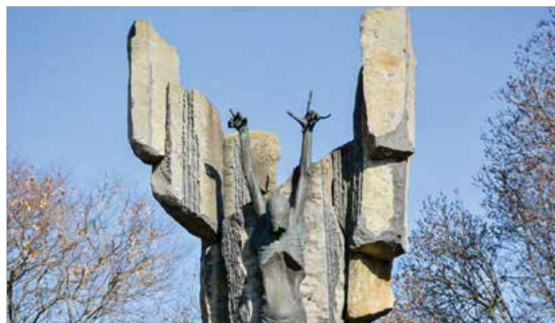
Az alkotás a magyarok erkölcsi feltámadását mutatja be