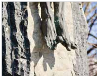
Wagner Nándor a szobor 1999-es felállítását már nem élte meg

Wagner Nándor szobrászművész 1922. október 7-én látta meg a napvilágot Nagyváradon. Itt végezte alaptanulmányait, majd Budapesten, a Képzőművészeti Főiskolán szobrászatot és festészetet tanult. A második világháború után igen aktív művésznek bizonyult, több szobrával is első díjat nyert különböző pályázatokon. Corpus Hungaricum névre keresztelt szobra is erre az időszakra tevődik: az 1952-ben megmintázott alkotás a magyarok erkölcsi feltámadását mutatja be, a minden bajból feltörő magyar testet ábrázolja oly módon, hogy a szobor egyik