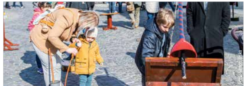
Igen népszerűek voltak a népi játékok, a gyerekek kipróbálhatták a sajtlabirintust, a hordólovaglást, a gólyalábakat és az egyensúlyozó gerendát